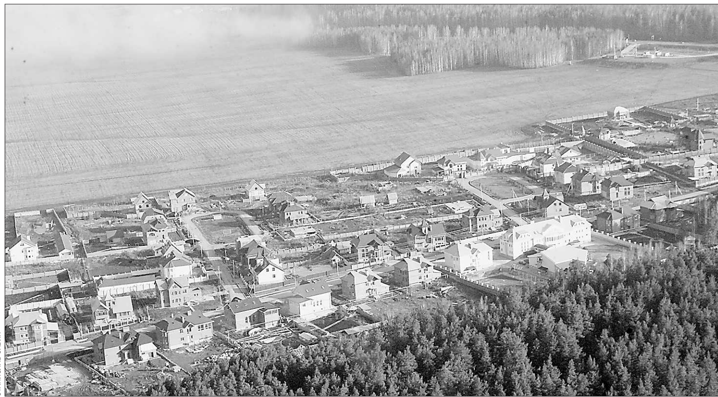
Взгляд сверху помогает рационально распорядиться землей