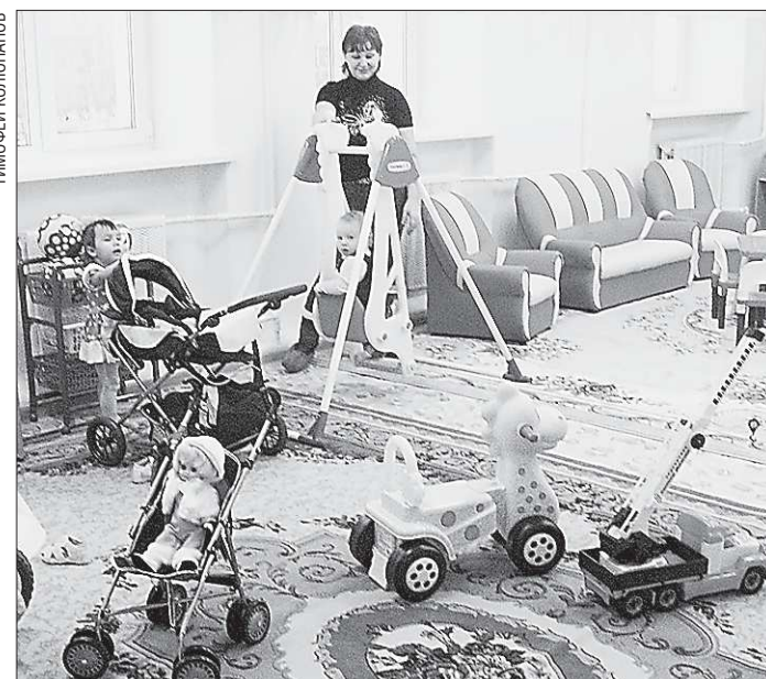
Воспитанники «Ладушек» – совсем еще крохи, им нет и трех лет

– незаконное завладение земельным участком площадью 65 660 квадратных метров. Ранее на нём располагался пионерский лагерь «Спутник». Проверка показала, что эта территория была передана по подложным документам иностранной компании, зарегистрированной в Узбекистане. А уже она в свою очередь перепоручила его английской компании. В результате государству был причинён ущерб в размере 46 миллионов рублей.