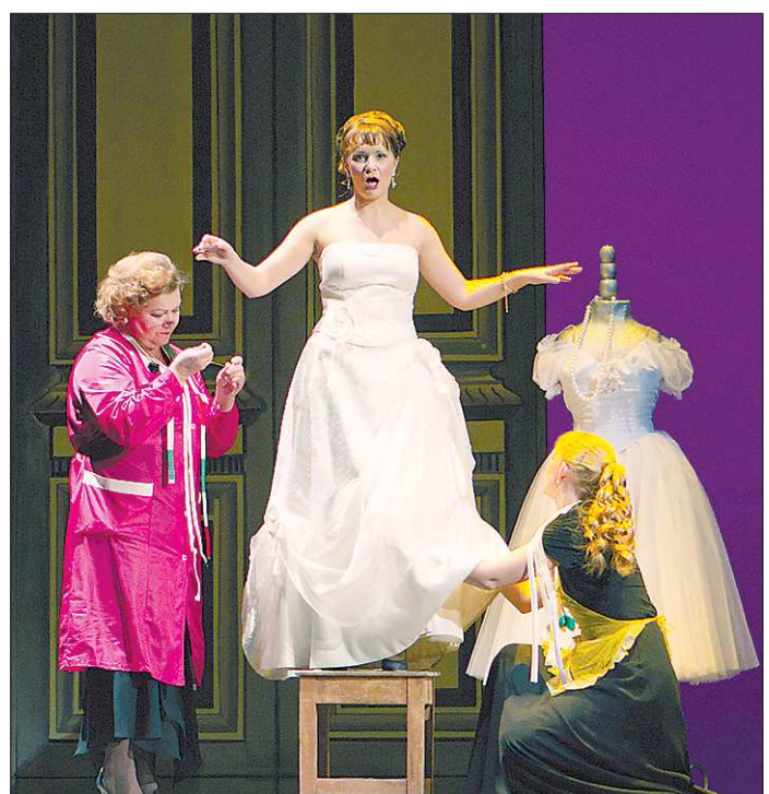
Куплеты Олимпии из «Сказок Гофмана» на сцене Екатеринбургского оперного звучали классически безупречно. Откуда ж и для чего — такой авангард в сценографии?

«Кармен на новогодней... распродаже обуви» 10