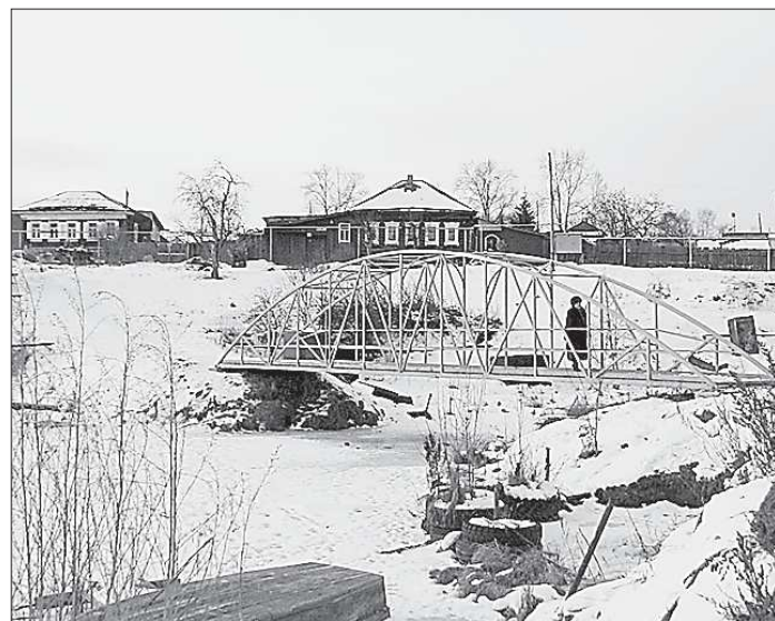
Строители выполнили все требования заказчиков: сделали переправу прочной, красивой и недорогой