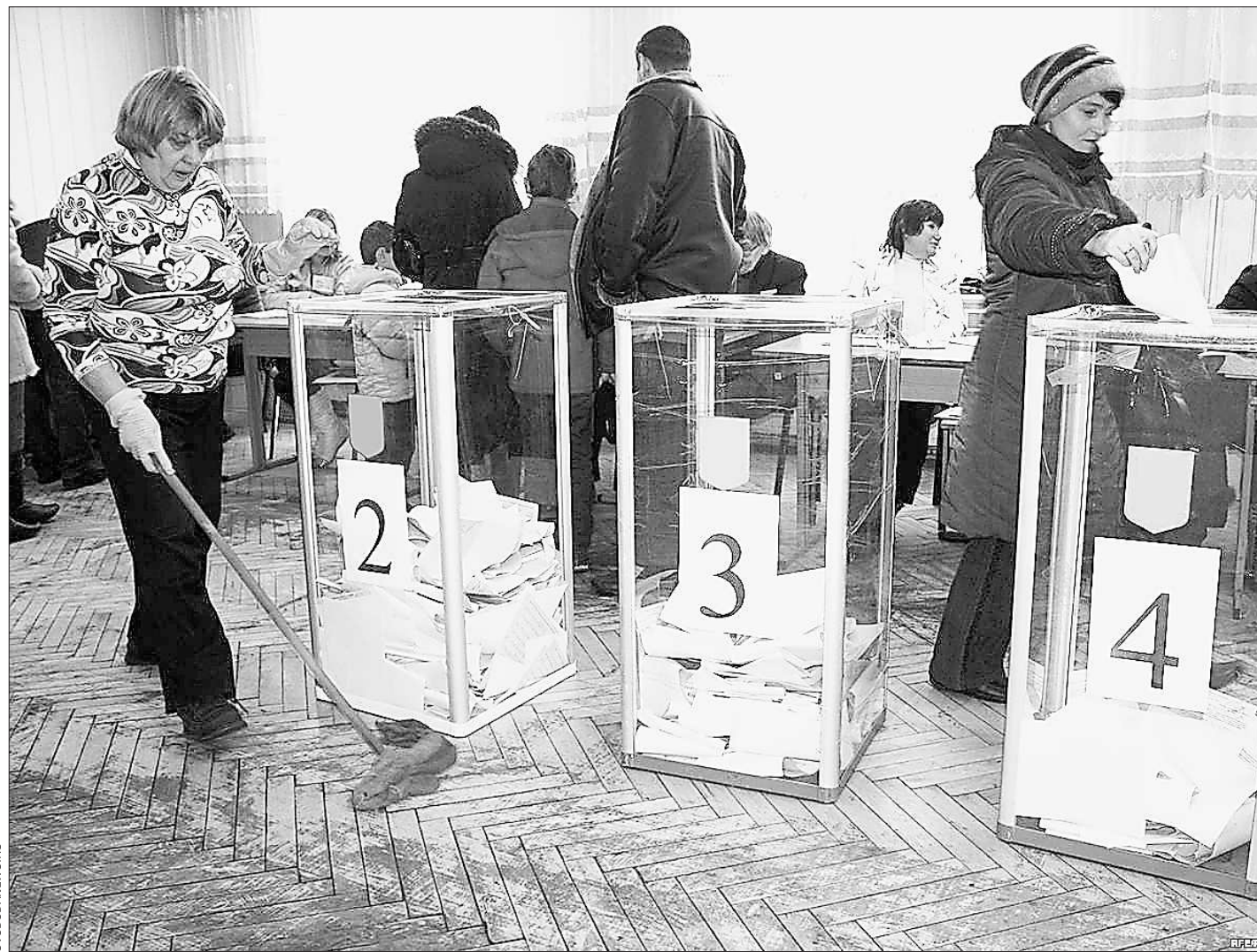
Выборы должны быть прозрачными. И чистыми...

Владимир Путин заявил, что у оппонентов нынешней власти «нет единой программы, нет ясных и понятных способов достижения цели», поэтому они всячески пытаются делегитимизировать предстоящие выборы. В таких условиях Народному штабу