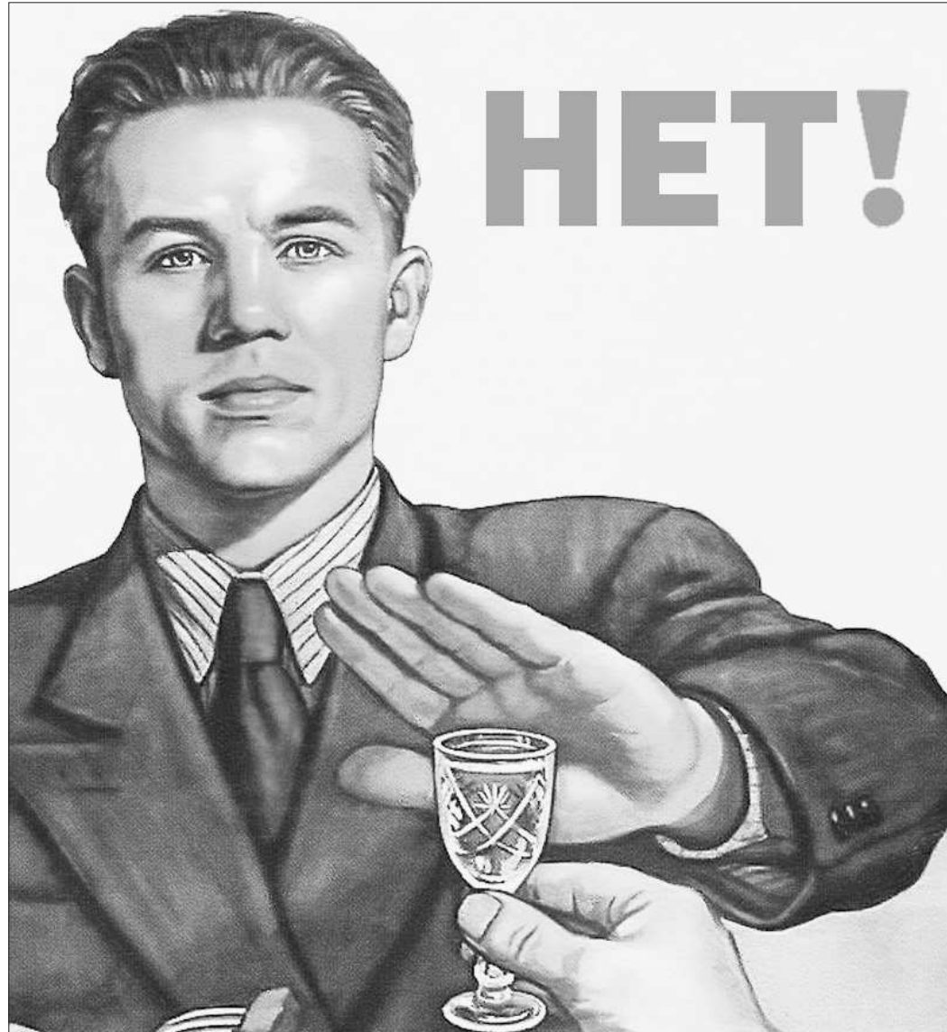
Советский антиалкогольный плакат 1954 года

—Для начала такая реплика: у нас во всех бедах всегда торговля крайняя, образование крайнее. А вот что касается продажи алкоголя несовершеннолетним, мы, как молодая семья, уже задумываемся об этом сейчас, мы видим, что все шишки летят в вас, хотя на самом деле мне кажется, что необходимо начать с семьи, всё зависит от воспитания.