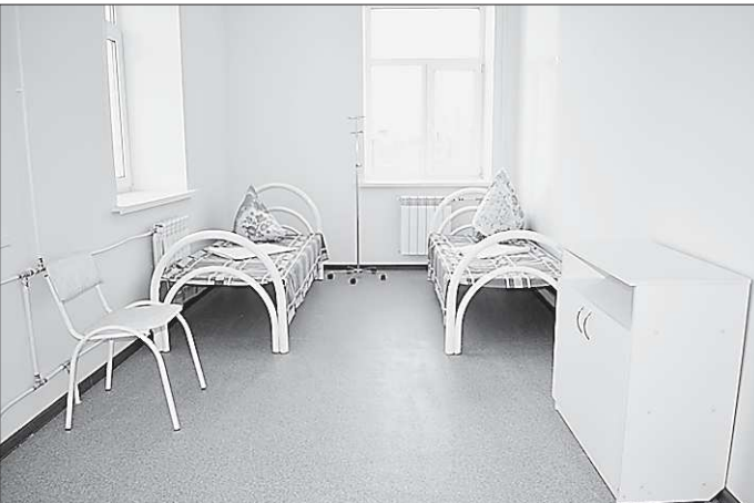
От старого здания сохранились только несущие стены, все остальное – кровлю, перекрытия между этажами, полы, оконные проемы, инженерные сети и внутреннюю отделку помещений строители сделали заново

Общеврачебную практику (ОВП) на три врачебных участка открыли в поселке имени Чкалова, районе Каменска-Уральского, сообщает официальный портал города. Внутри здания – кабинеты врачей, палаты дневного стационара, процедурные и комната здорового образа жизни. ОВП полностью готова к работе, а первичный прием пациентов медики начнут уже на этой неделе.