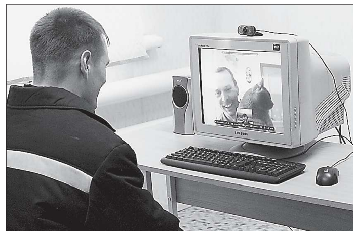
Видеосвязь может оказаться для многих заключённых и их близких единственным способом повидаться. Так что желающих воспользоваться ею, очевидно, будет достаточно