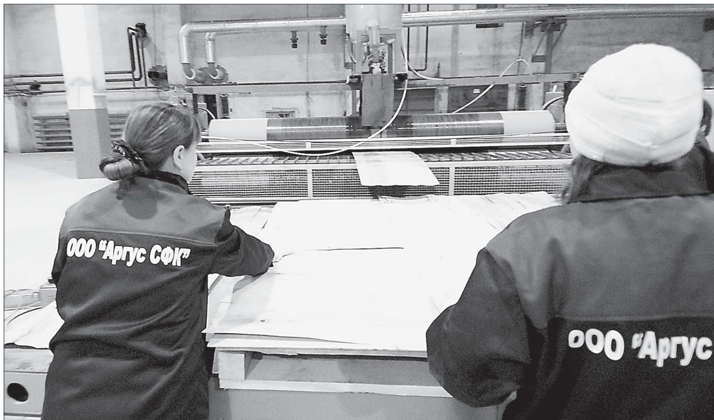
Фанеру «восточная» молодёжь выпускает на западном оборудовании

Но лихие 1990-е годы оставили здесь, как и во многих других местах, свои шрамы. И комбинат пришёл в запустение. Венцом же упадка стало разоруживание в декабре 2002 года практически всей системы отопления посёлка, которое, как все признают, стало следствием экономических неурядиц на градообразующем предприятии. В результате всех этих бед начался повальный исход жителей из посёлка, который располагается далеко от больших городов, где были в то время рабочие места, – в Сосьвинском городском округе. Многие люди просто бросали свои дома и уезжали в поисках лучшей жизни в Екатеринбург, Алапаевск, Верхотурье. Поэтому, если в конце 1980-х в посёлке проживали более 11 тысяч человек, то к моменту прихода в 2005 году в Восточный компании «Аргус СФК» число жителей сократилось здесь больше чем наполовину.