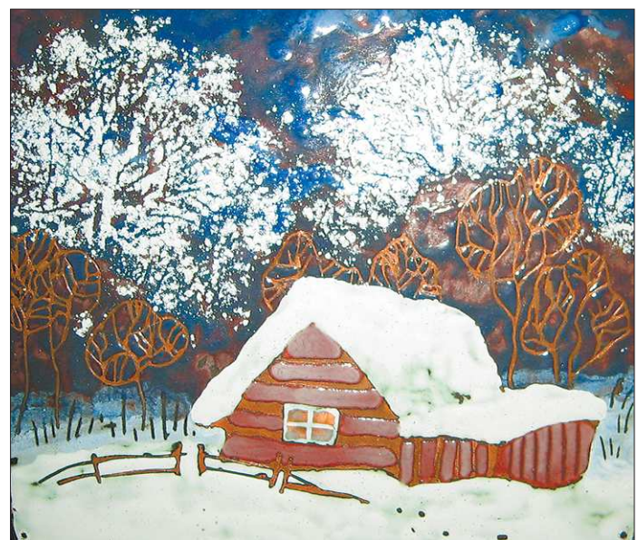
Медь, огонь и уральская стужа

Главная особенность эмали – присутствие огня. Он явно добавляет в краску, в живопись свою энергию, которую нельзя выразить словами, передать качественной полиграфией. Самый классный каталог проигрывает живой эмале, которую можно не только рассмотреть, но и почувствовать. Сила огня мистическая и необъяснимая, поэтому смотреть на эмали – только глаза в глаза.