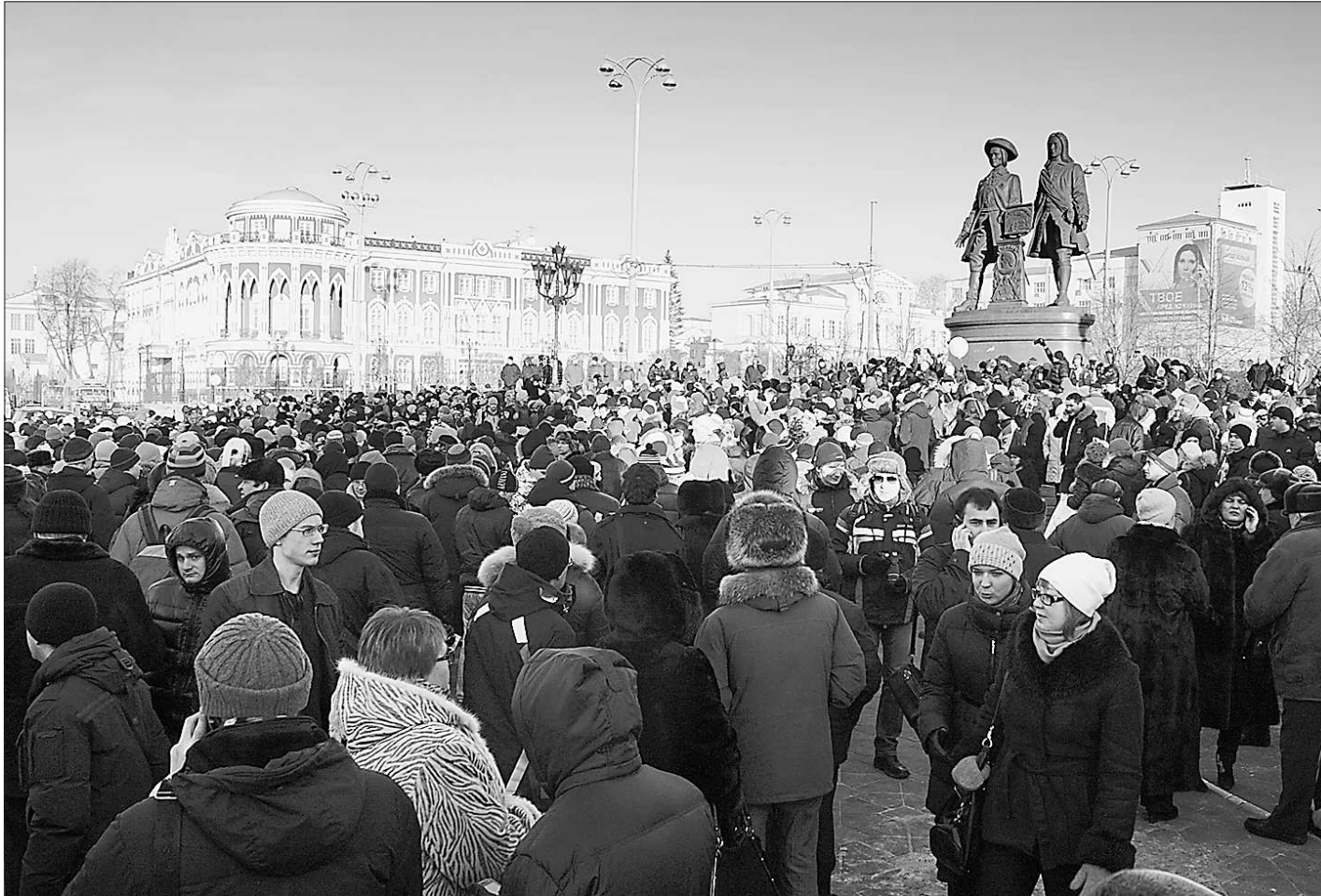
Граждане страны всё активнее высказывают свою позицию и предъявляют законные требования к власти...

Значительное место в Президентском Послании отведено проблеме искоренения коррупции. Дмитрий Медведев напомнил, что по его указанию в стране ведется «масштабная антикоррупционная работа», в рамках которой Россия присоединилась к международным конвенциям в этой сфере, приняты необходимые законодательные акты. Масштабная и системная борьба с коррупцией только началась, сказал Президент, но пообещал, что «мы будем её вести решительно, системно и последовательно». Для этого он предложил ввести ограничение на