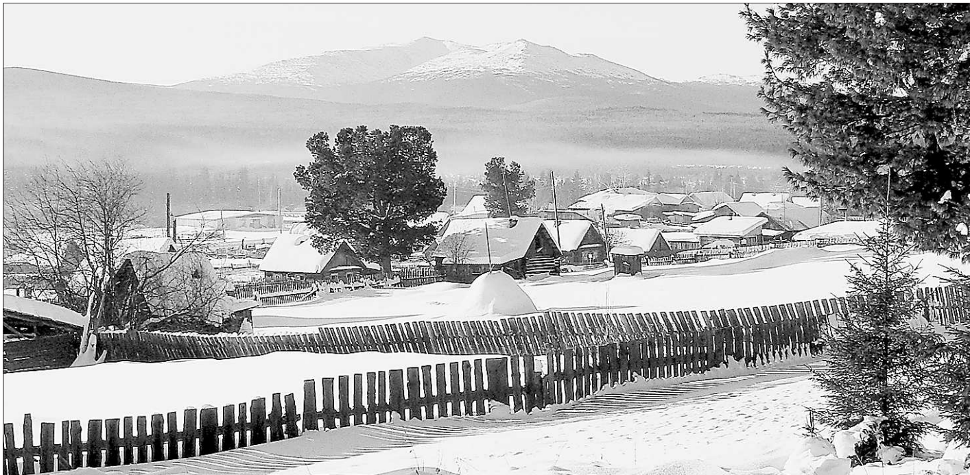
Солнечным днём на сверкающую корону Денежкина Камня больно смотреть!

Летающая братия так полюбила Всеволодо- Благодатское, что с тех пор- чуть ли не каждый месяц кто- нибудь из вертолётчиков на- езжает к Серебровым отду- хнуть, попариться в баньке, порыбачить на озёрах (их в окрестностях села сразу че- тыре: Светлое, Дикое, Нижнее и Верхнее), да хотя бы про- сто насладиться кристаль- ным воздухом и тишиной.