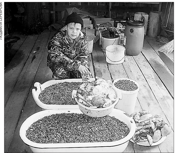
В этих местах лес всегда помогал кормиться и жить

В начале 1930-х годов Всеволодо- Благодатское было приписано к Ивдельскому мансийскому национальному району.