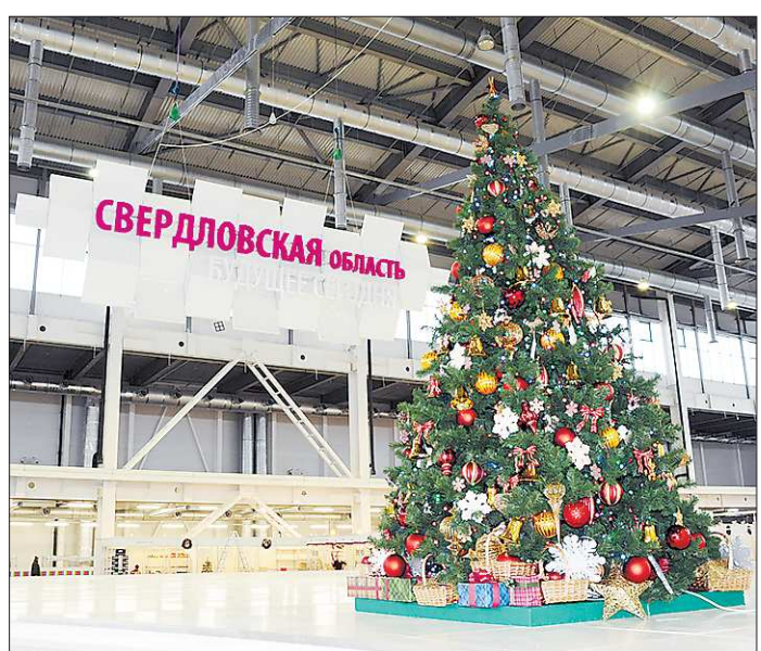
Праздничное настроение рождественская ярмарка будет дарить своим гостям почти месяц

№ 476-478 (6029-6031). Цена в розницу — свободная.