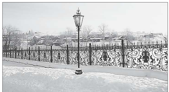
Новые фонари будут не такие красивые, как этот, стоящий в центре Невьянска, но зато свет от них будет наверняка ярче

К слову, и старые фонари не выброшены на помойку. Их устанавливают на городских окраинах. Конечно, вид у светильников советского образца не столь нарядный, но люди, до сей поры добравшиеся до дома в потёмках, рады и такому освещению.