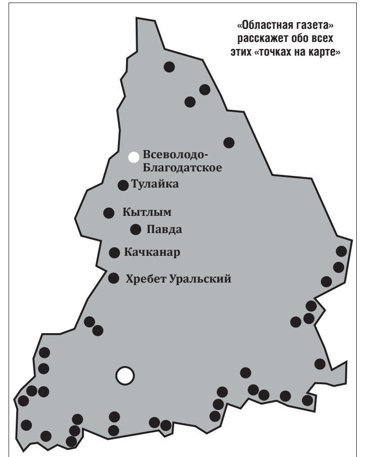
«Областная газета» расскажет обо всех этих «точках на карте»

В селе прописано 240 человек, хотя по- стоянно проживает около 130. Большинство работоспособных сельчан трудятся за пре- делами Всеволодо-Благодатского –вахтовым методом, на шахтах СУБРА, на предприя- тиях и в организациях Североуральского го- родского округа.