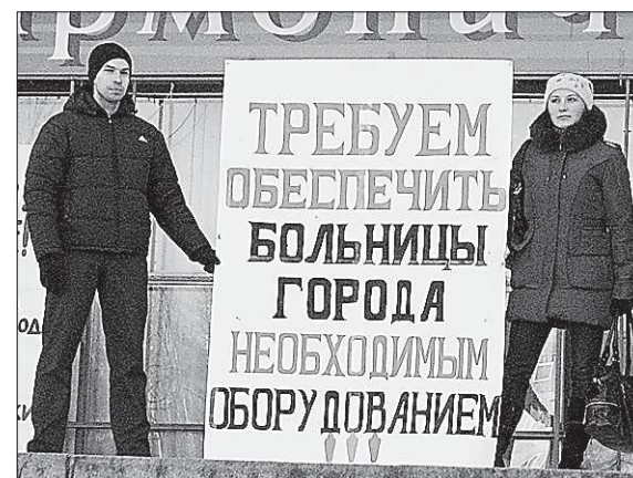
Участники митинга считают: чтобы избежать повторения трагедий, мало наказать виновных, нужно коренным образом улучшить медицинское обслуживание

вании больниц. Вместе с тем несколько не меньше размещено благодарных отзывов о спасённых жизнях, душевном общении с больными. Читая диаметрально противоположные отзывы, вспоминаю случай из своей практики. При первой встрече директор завода сказал: «Не люблю я вас, журналюг». Ответила, что увидела много директоров — разных по уровню деловых качеств и харак-