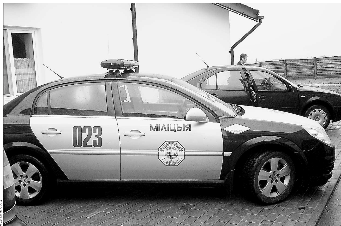
Правоохранительные органы Беларуси очень похожи на российские. Только называются по-разному

Но всем нам должно помнить, что дело всегда идёт спору, если приступить к нему с двух сторон. Государство даёт возможность овладения правовой культурой, а мы должны сделать выбор между правовым нигилизмом и формированием в своём сознании и в обществе устойчивого уважения к нормам действующего законодательства. Правовое государство – это не только знание своих прав и свобод, но и ответственность за поступки, сохранение духовных и нравственных ценностей, исторических традиций страны, в которой мы все живём и будем жить.