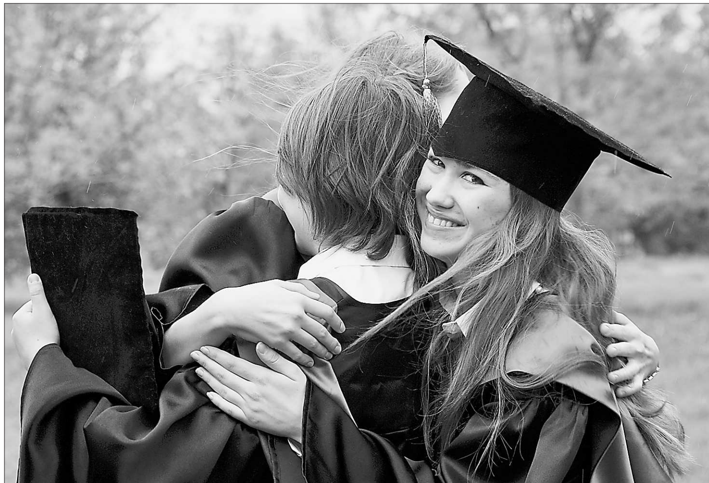
Веселится и ликует зарубежный студент: путь в Россию открыт!

Возникает мысль: во первых, коли есть такие соглашения, зачем еще закон принимать? Наверное, чтобы можно было легализовать дипломы, степени и звания происхождения из тех стран, с