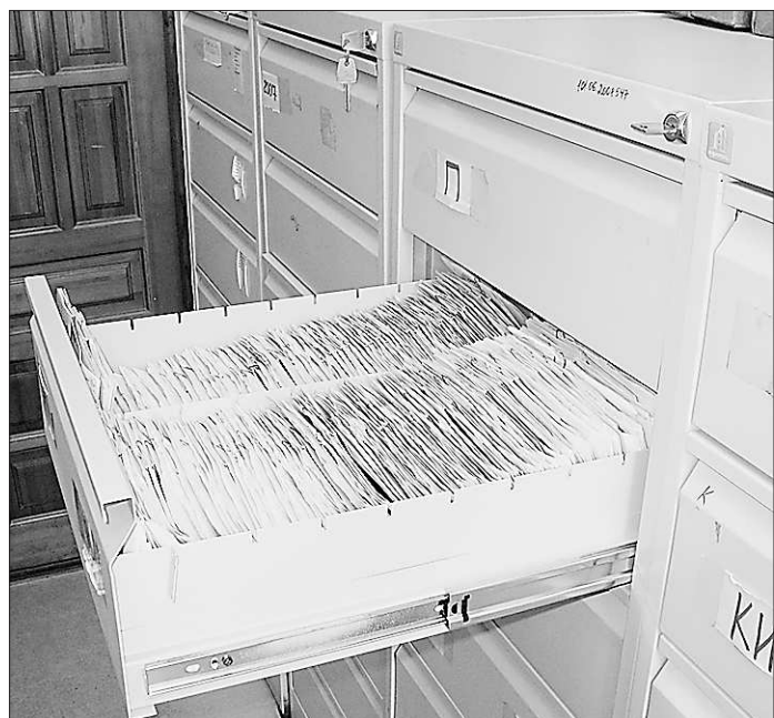
Святая святых — хранилище готовых загранпаспортов. Эти ящики заполнены документами, чьи хозяева забыли за ними прийти. До конца срока действия они будут пылиться в картотеке, а потом их пустят «на растопку»