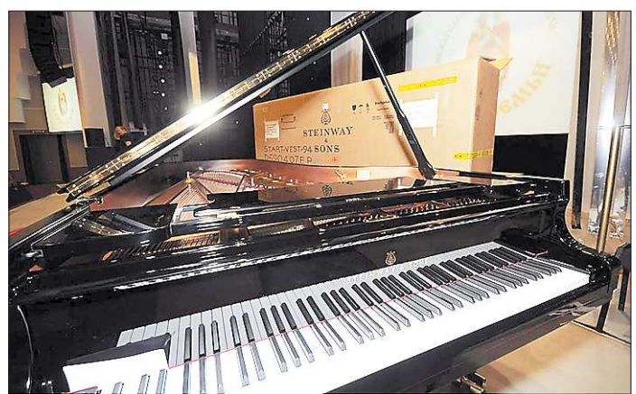
О таком роуле в Театре эстрады мечтали с момента основания