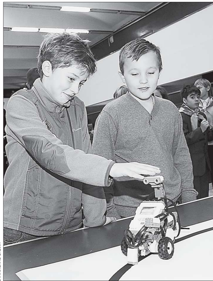
Пока такие роботы для тагильских ребят в диковинку, но скоро они научатся их делать своими руками