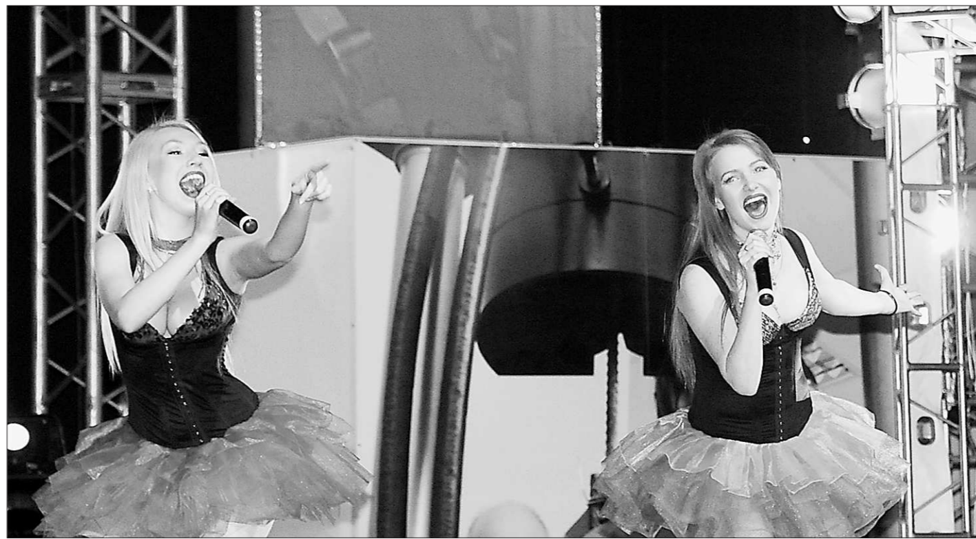
Шоу-группа «Сюрприз» Центра культуры НТМК наполнила фестиваль молодым задором. Для сидящих в зале этот день был днем отдыха и получения наград, а для артистов — днем рабочим