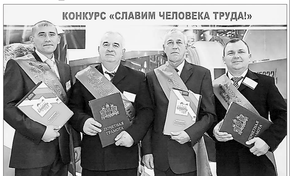
Победители «МРСК Урала» в номинации «Лучший водитель»