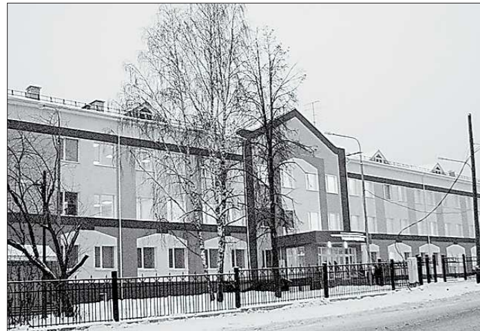
Жители Верхней Салды шутят: это раньше у нас был роддом, а теперь – роддворец!