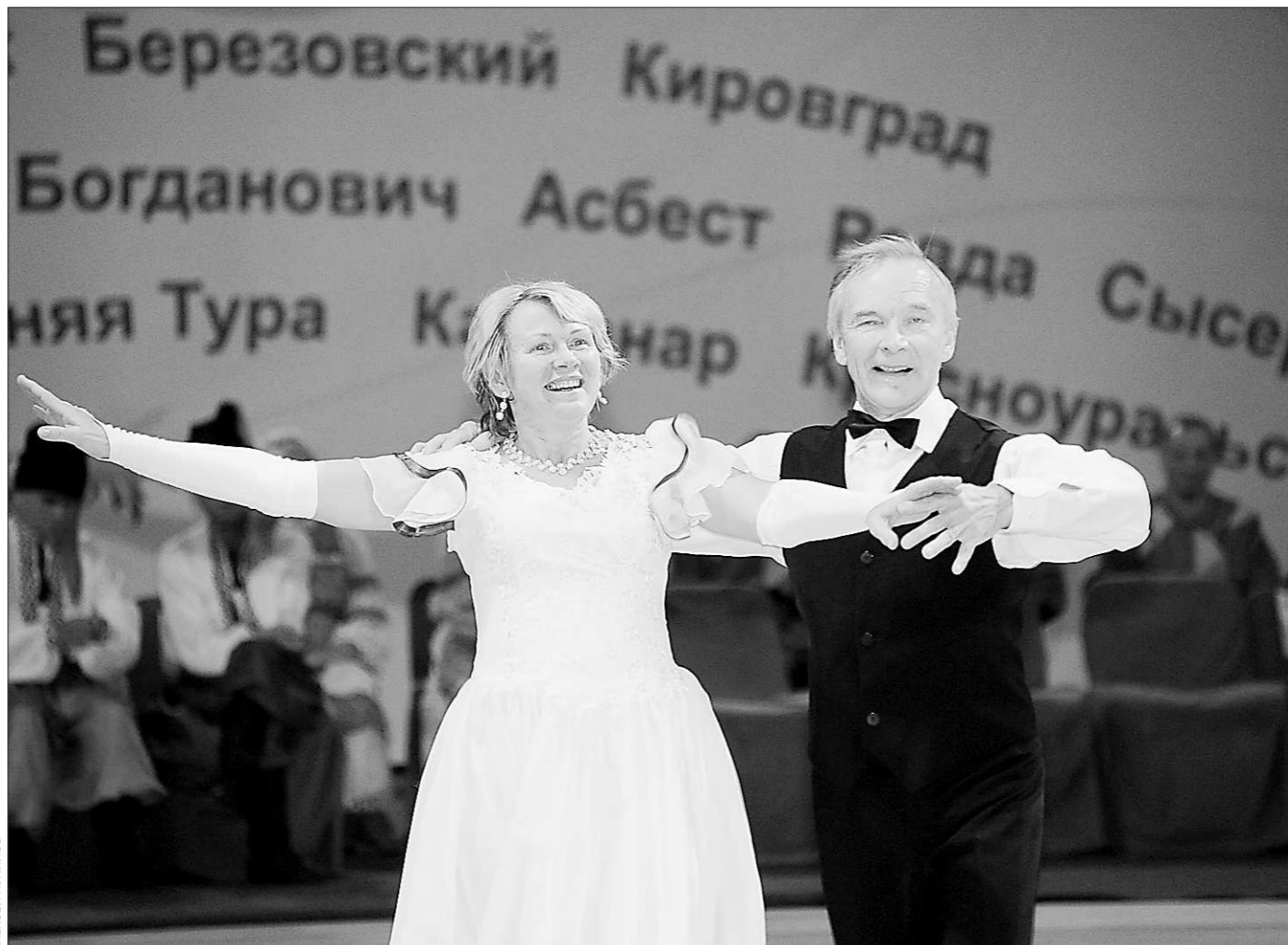
Как молоды мы есть!

А на добром пути – только добрые дела и помысли, светлое устроение души, непрестанное восхождение к высотам духа.