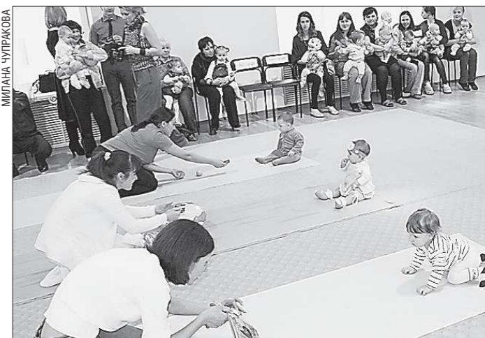
В каждом из «забегов» участвовало всего по одному мальчику – видимо, девочки более спортивные