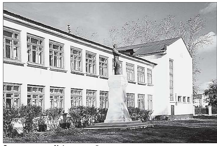
Здание школы №1, где в войну спасали раненых солдат, сегодня признано аварийным. Пока оно остается пустым

ВМЕСТЕ www.uralinfoport.ru, сайт региональных СМИ