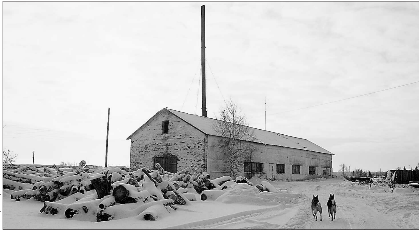
В Краснослободском есть котельная и топливо. Нет только тепла

Решение практически принято. Теперь необходимо прописать чёткие правила, в каких именно случаях казначей смогут выставлять счёт следователю или прокурору, чтобы угроза расплаты не висела над всеми добросовестными служителями закона. Важно не перегнуть палку. Ведь у нас любят назначать крайних. Что, если правоохранители после принятия этого закона предпочтут не связываться с преступником и не доказывать его вину в неочевидном преступлении, чтобы не рисковать рублём? Именно поэтому правоведы считают, что следующим шагом после принятия закона должна стать инструкция, детально прописывающая, когда следователь или судья отвечают рублём за свои промахи.