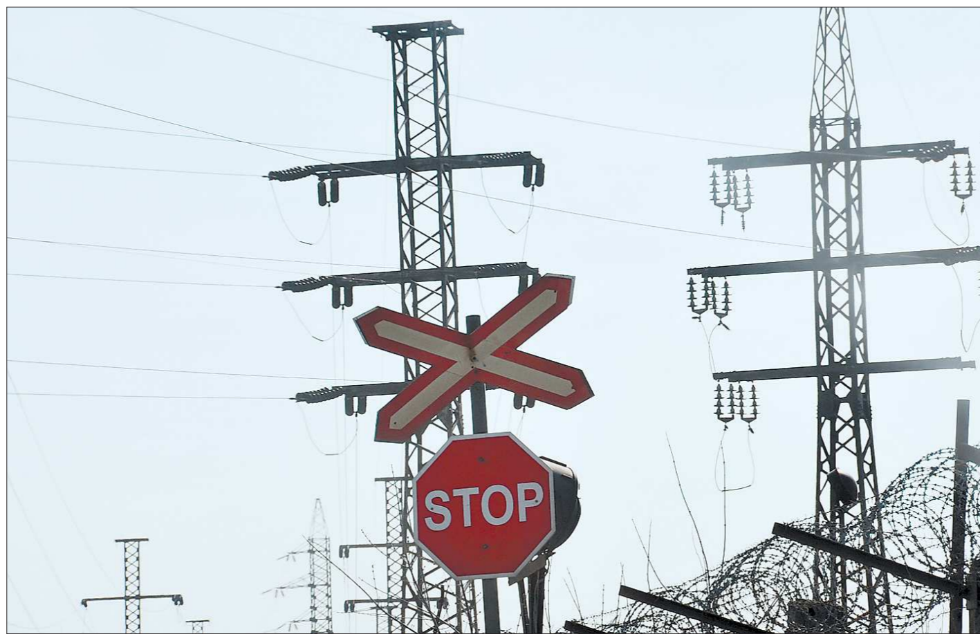
Ценам на коммунальные услуги, в том числе и на электроэнергию, до середины следующего года расти запрещено

Губернатор побывал также в поселке Мартюш Каменского городского округа, где открыл две общеврачебные практики (ОВП). Более четырех тысяч каменцев, среди которых почти одна тысяча ребятишек, получили доступ к квалифицированной медицинской помощи. На эти цели из областного бюджета направлено почти четыре миллиона рублей.