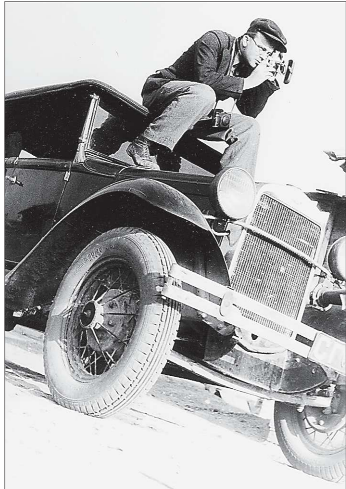
Увлечение фотографией выросло в дело жизни. Его снимки публиковали «Известия», «Литературная газета»