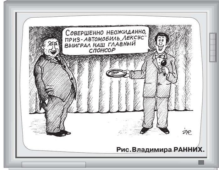
Рис. Владимира РАННИХ.