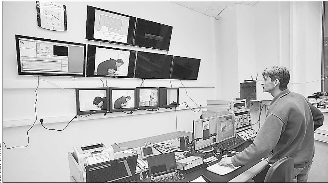
В новой студии Областного телевидения