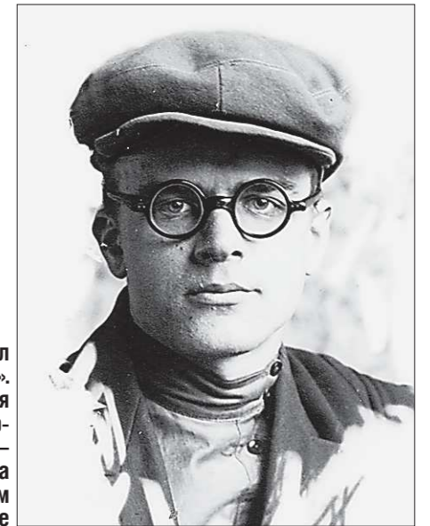
«Я свой Урал узнала сначала ногами...». Первая профессия — топограф-землеустроитель — помогла в дальнейшем в писательстве

Для писателя главная память — его книги. Поэтому издать собрание сочинений Б.Рябинина — дело части не только уральской творческой интеллигенции, но и власти.