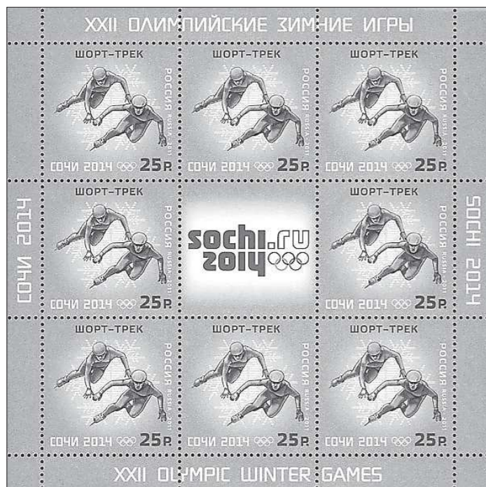
Всего в отделения почтовой связи области поступило порядка 120 тысяч марок этой серии

проводят прокуратура и Роспотребнадзор. Так, сотрудниками Роспотребнадзора при обследовании пищеблока образовательного учреждения выявлены многочисленные нарушения санитарных норм — в организации питьевого режима, в хранении скоропортящейся продукции и при обработке продуктов питания и кухонного инвентаря. Для лабораторных исследований отобраны пробы пищевого сырья и воды из разводящей сети.