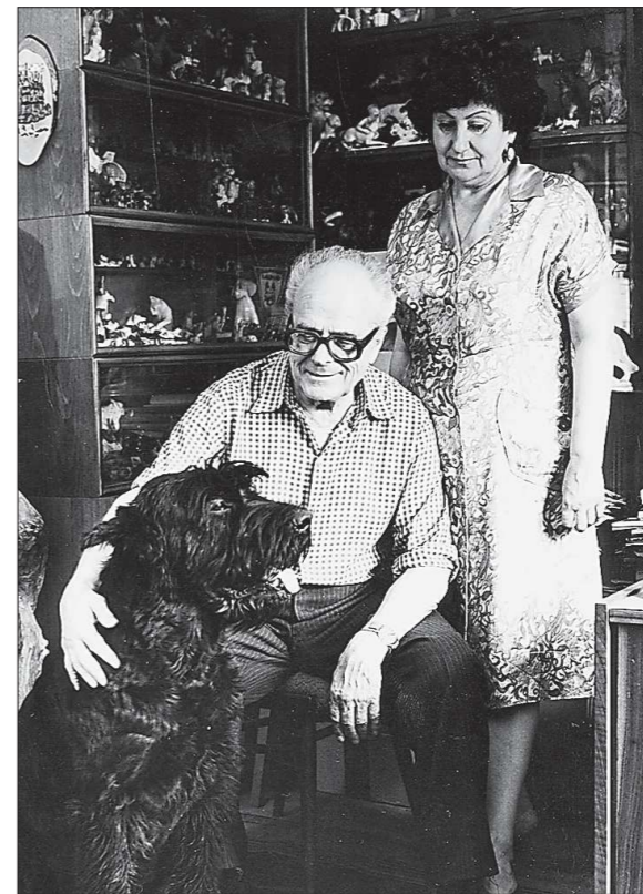
«Рассказы о верном друге» родились, как правило, в семье