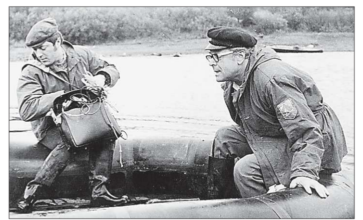
«Операция Ч» (в защиту Чусовой) стала первой всероссийской экологической акцией