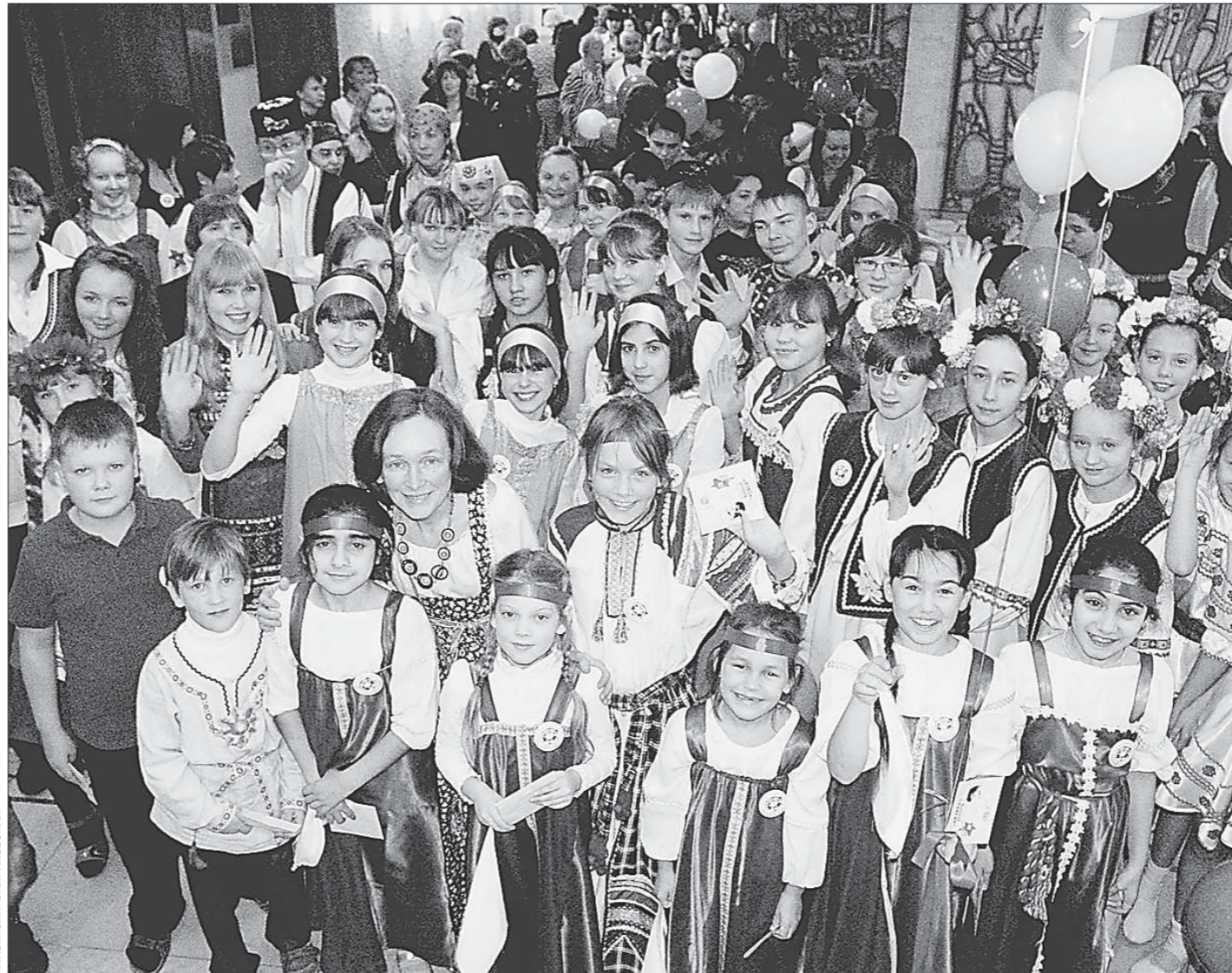
Детская дружба не знает национальности

К молитвенному шествию присоединятся военнослужащие, курсанты, казаки, а также военные оркестры. Этот Крестный ход должен стать праздником единения и торжества народного духа, и я приглашаю всех принять в нем участие.