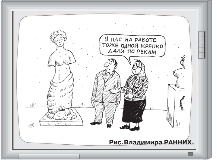
У НАС НА РАБОТЕ ТОЖЕ ОДНОЙ КРЕПКО ДАЛИ ПО РУКАМ