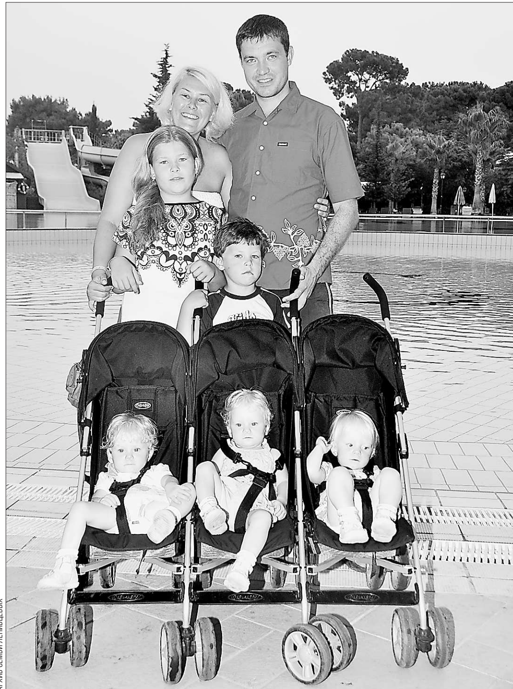
«Старших деток нам принёс аист, а младших какой-то конь-спотыкач очень долго возил окольными тропами»