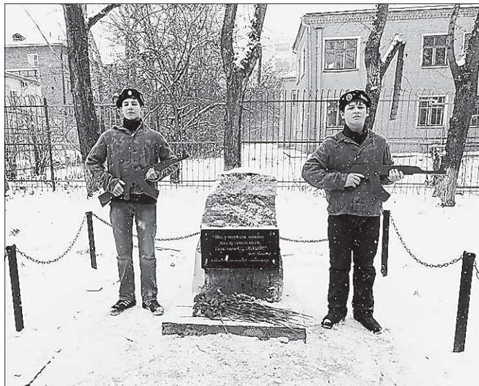
Воспитанники военно-патриотического клуба «Морской пехотинец» встали у нового мемориала в почётный караул

Участники уверены, что подобные конкурсы привлекают не столько спортивным азартом, сколько возможностью лишний раз отточить свои умения и навыки. Да и призы - неплохое поощрение за хорошую работу.