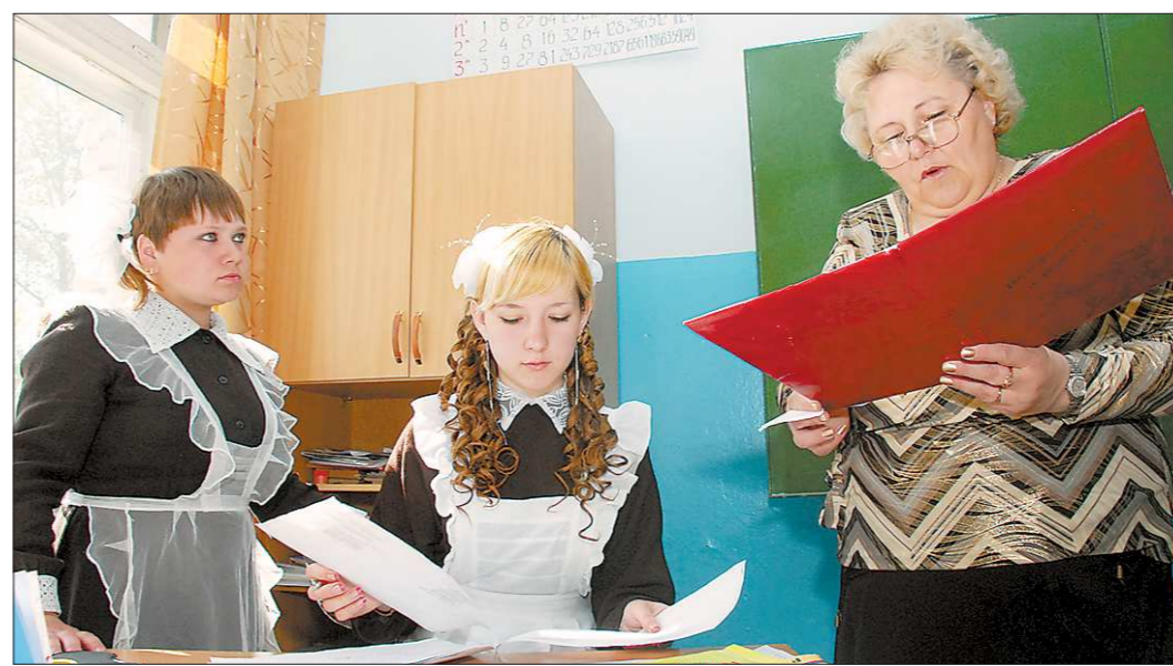
Победители конкурса получат по 300 тысяч рублей

«Педагогический работник общеобразовательного учреждения», «Педагогический работник дошкольного образовательного учреждения», «Педагогический работник дополнительного образования детей», «Педагогический работник специального (коррекционного) образовательного учреждения для обучающихся, воспитанников с ограниченными возможностями здоровья», «Педагогический работник образовательного учреждения для детей-сирот и детей, оставшихся без попечения родителей», «Педагогический работник образовательного учреждения начального профессионального и среднего профессионального образования» —