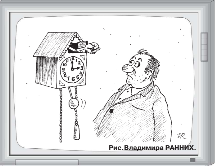
Рис. Владимира РАННИХ.

«ПЕРВЫЙ КАНАЛ» 23.45 - Комедия «ОТПУСК ПО ОБМЕНУ» (США, 2006). Режиссер и автор сценария Нэнси Майерс. В ролях: Кэмерон Диас, Кейт Уинслет, Джуд Лоу, Джек Блэк, Рудус Сьюэлл, Эдвард Бернс, Эли Уоллак.