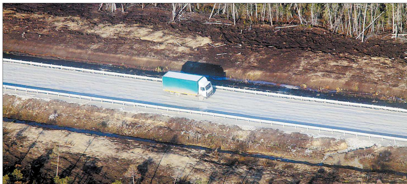
Новая автодорога является частью Северного широтного коридора, который связывает регионы, оказывая значительное влияние на развитие экономики этих территорий

Мы неоднократно, перераспределяя полномочия, сталкивались с тем, что эффекта нет, — сказал Дмитрий Медведев. — Почему? Основная причина, наверное, заключается в том, что нет или недостаточно стимулов и возможностей увеличивать