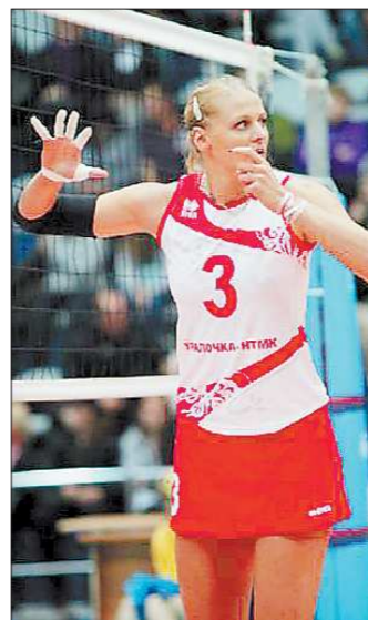
Эволюция формы: так выглядели волейболистки в начале 90-х годов («Уралочка»), в 2004-м (сборная России), в 2005-м (сборная Кубы) и в 2011-м («Уралочка») Владимир ВАСИЛЬЕВ