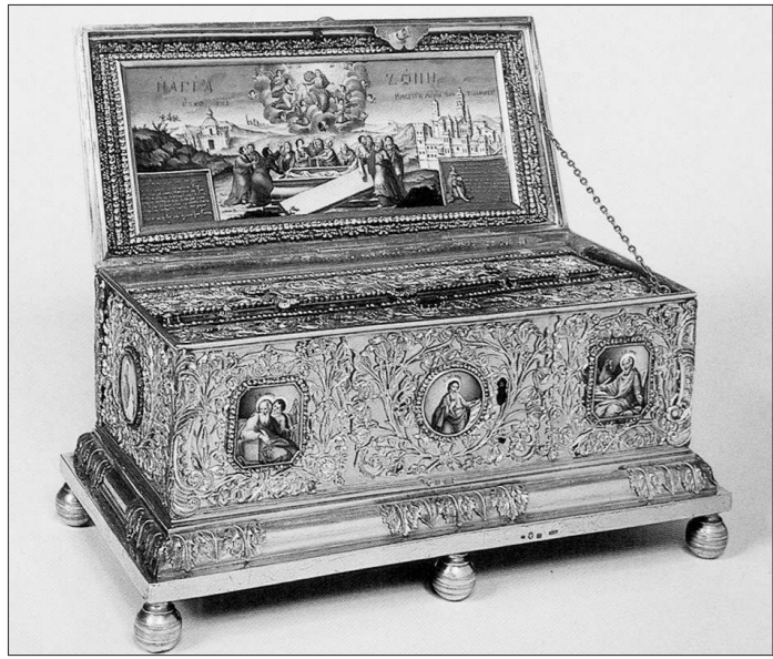
Согласно легенде, чудотворный Пояс Богородицы сплела своими руками из верблюжьего волоса и носила его вплоть до конца земного пути