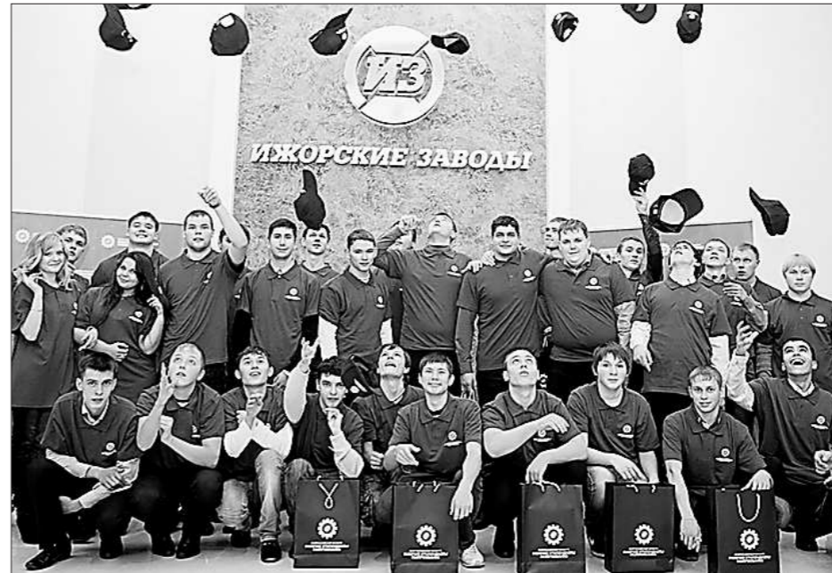
В этом году рабочих стипендиатов со всей страны принимали на знаменитых Ижорских заводах

Из Екатеринбурга в финал Всероссийского конкурса попали четыре студента. Это лучшие учащиеся Екатеринбургского техникума химического машиностроения, Екатеринбургского профессионального лицея им. Курочкина, Нижнеисетского профессионального училища и Екатеринбургского машиностроительного колледжа.