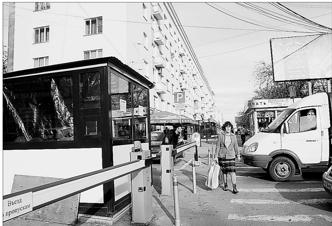
Въезд по пропускам: никаких договоров, чтобы попасть в двор-«рекордсмен», на охрану не действуют

Если придомовая территория находится в собственности жильцов, то в том самом протоколе должно быть описано, за счёт каких средств шлагбаум будет установлен. Это могут быть собственные деньги жильцов, которые