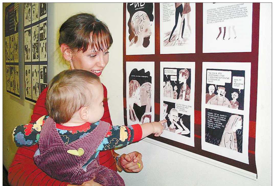
Комикс стал полноправным видом современного искусства, язык которого понятен детям и интересен взрослым