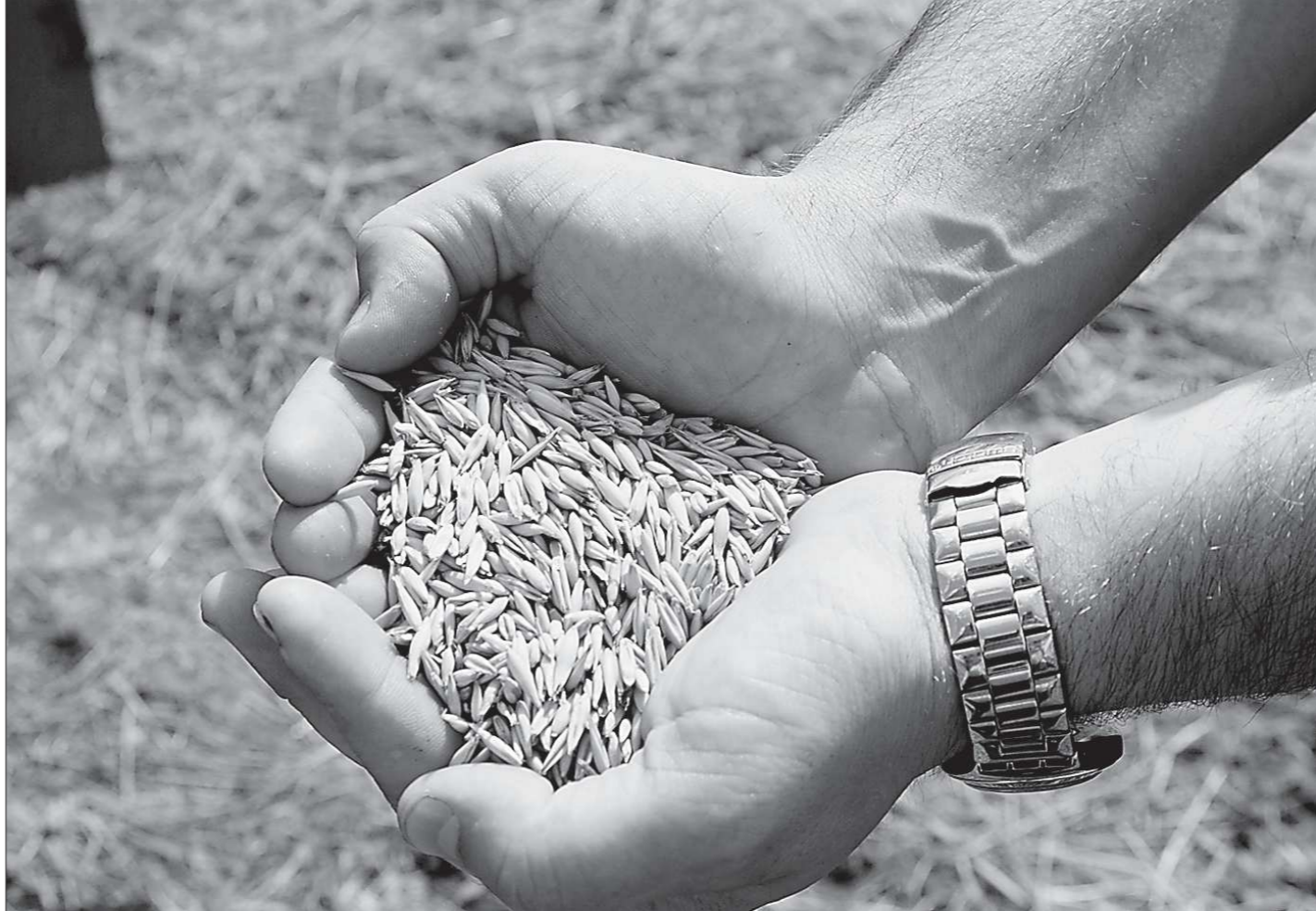
Ещё весной, на волне засухи, звучали призывы приврать зерно к золотому запасу. Сегодня, когда закрома лопаются от хлеба, крестьяне не знают, как продать этот запас, чтобы не остаться в прогаре

Одним словом, если производитель и продавец дружат с требованиями стандартов, то презумпция соответствия гарантирована ему, а качественный и безопасный товар — потребителю.