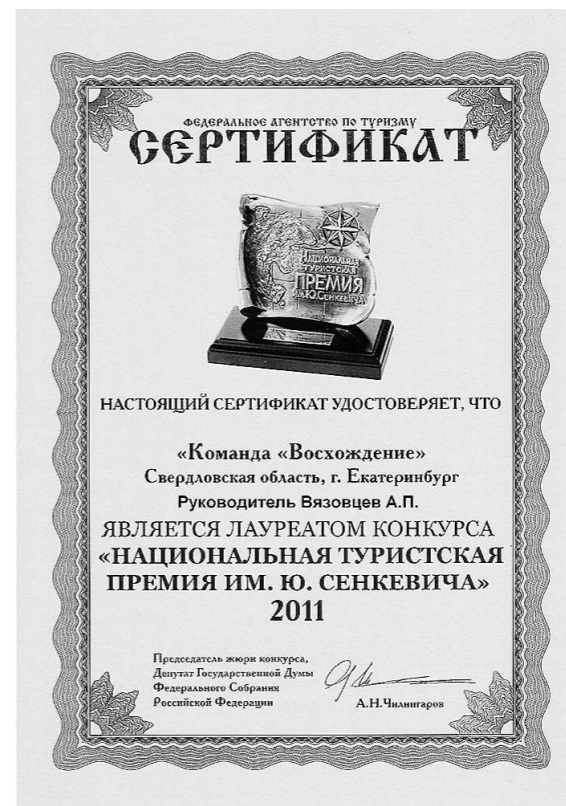
ные средства: премия, уву, не предполагает денежного вознаграждения.