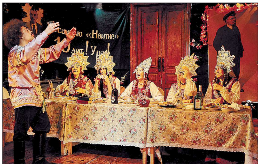
Этот творческий коллектив стал одним из брендов Свердловской области

процессе стало ясно, что замену труб придётся производить на гораздо большем участке, чем запланировали. Но и на этом неприятные неожиданности не закончились — уже во время ремонта начались перебои с поставкой труб, нередко партии и вовсе оказывались бракованными. Поэтому работы затянулись. На данный момент, по словам Николая Смирнова, с поставщиками достигнуто договорённость, труб должно хватить, чтобы закончить ремонт в срок.