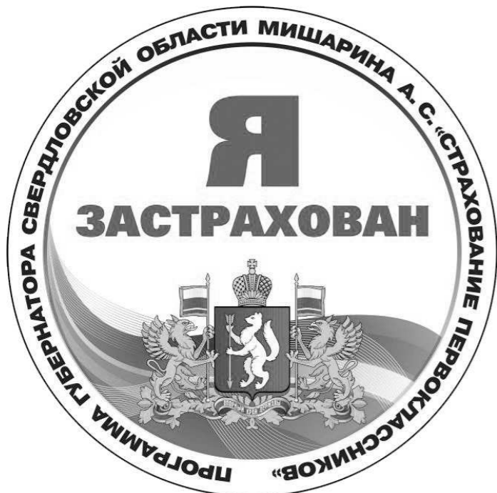
Такой значок получит каждый первоклассник