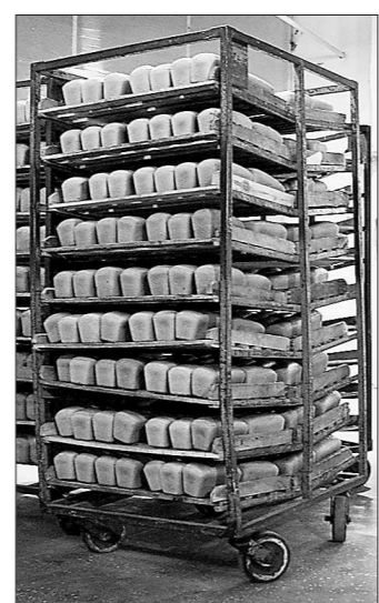
Среднедушевое потребление хлеба в России составляет 350 г в день