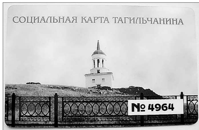
Вот такие карты были введены в Нижнем Тагиле около двух лет назад