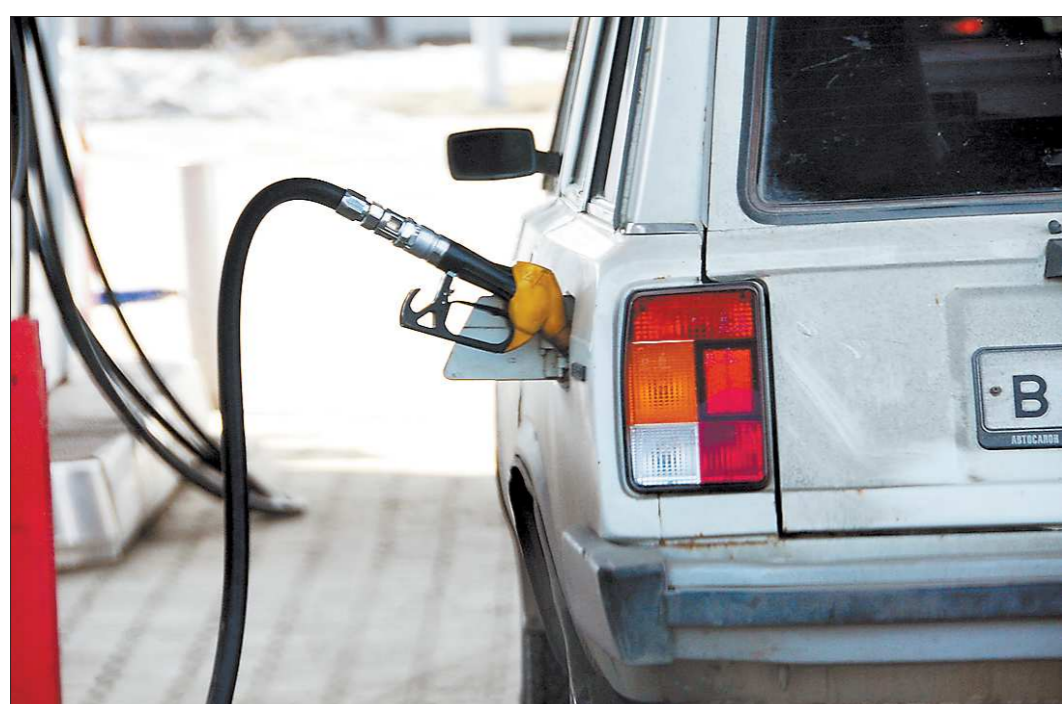
Программа обустройства федеральных автодорог предполагает сокращение количества придорожных бензоколонок в 10-15 раз

На пятый мультифестиваль «Золотой тигр» в Екатеринбург приехали сильнейшие представители четырнадцати силовых видов спорта и единоборств.