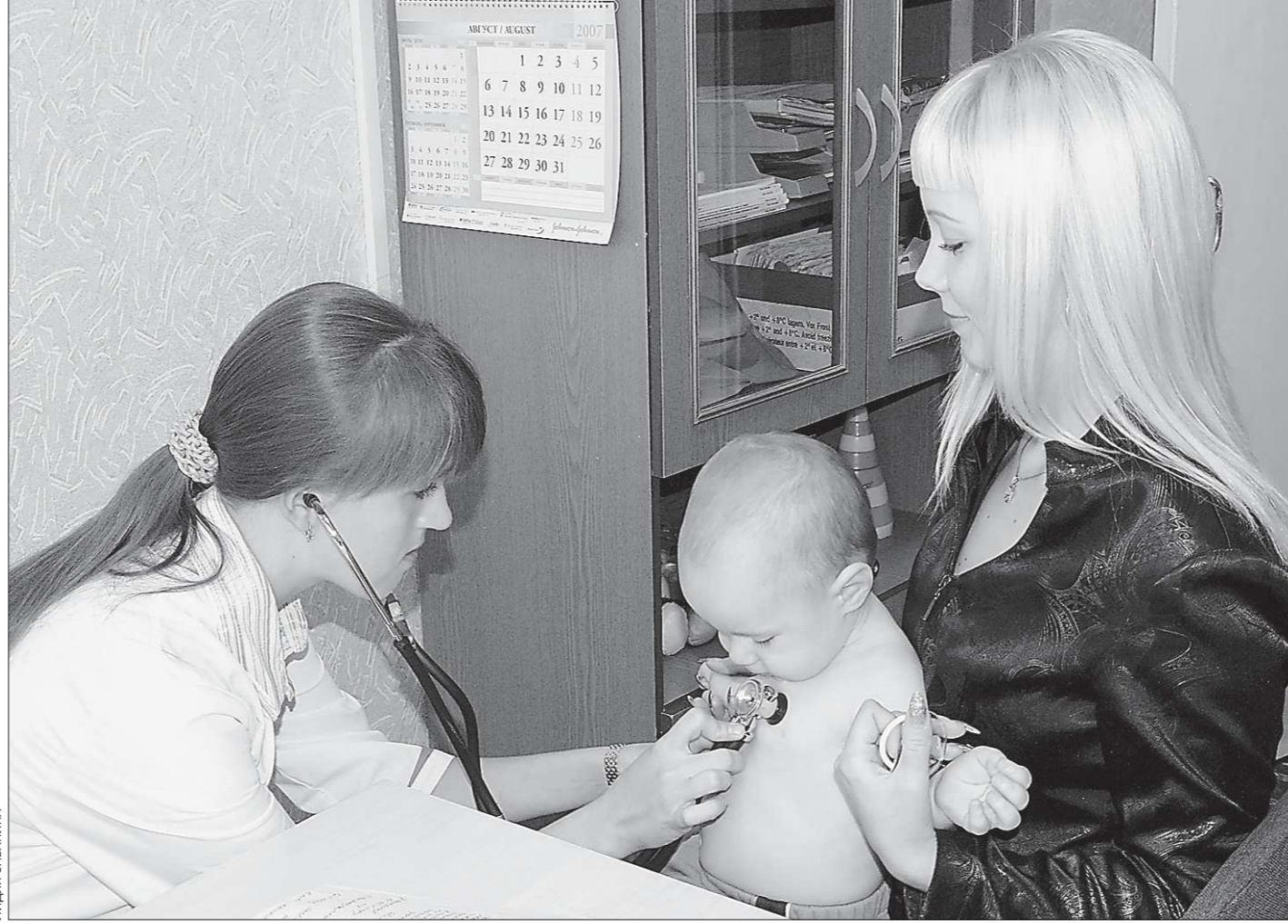
Эпидпорог по ОРВИ среди детей трех-шести лет превышен на 19,5 процента, среди школьников – на восемь процентов. Заболеваемость населения пока на 23 процента ниже эпидпорога

Вот такие метаморфозы у техосмотра, то есть переобразования, разумеется, делаются с целью улучшения, повышения, оптимизации и так далее.