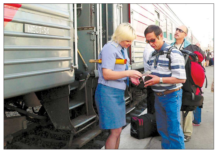
В скором времени «предъявлять документы» нам придется еще и на автовокзалах

Воздухо-разделительная установка не только производит больше продукта, чем старые агрегаты, но и экономит электричество, воду и пар