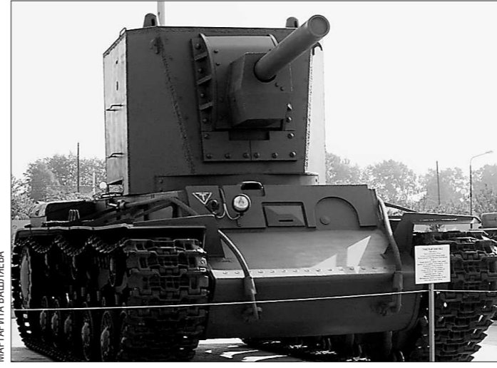
KV-2: на войне и на «пенсии»