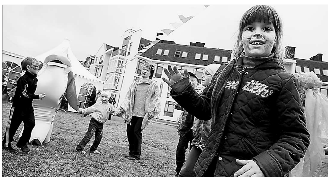
Дворовое пространство комплекса настолько велико, что там вполне можно устроить грандиозный праздник для всех жильцов

На весёлом семейном празднике, который по этому поводу организовала Управляющая компания посёлка «Карасьеозёрск-Сервис», жильцов поджидало много приятных сюрпризов – творческие мастерские для детей и взрослых, передвижной зоопарк с кроликами, енотами и птицами, конная повозка с кучером, готовая прокатить всех желающих. В конце дня в небо были запущены воздушные шары, что символизировало новый старт продаж в жилом комплексе.