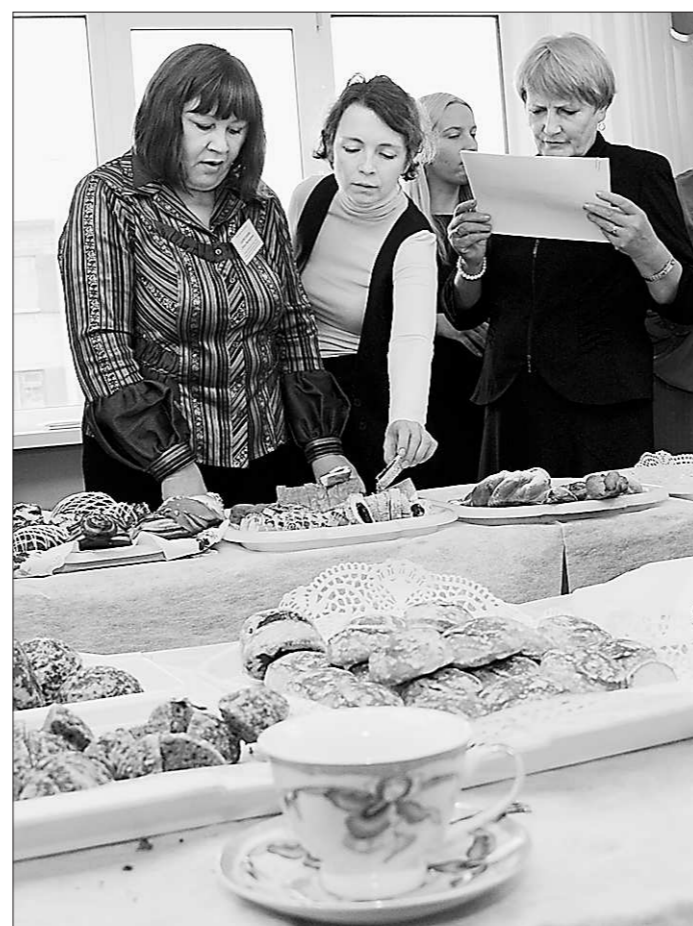
На дегустацию одного вида продукции у экспертов уходило не более 15 минут

– Наши эксперты уже настолько опытные, что могут сразу распознать, использовались ли при приготовлении искусственные добавки или ароматизаторы, – говорит исполнительный директор Союза предприятий