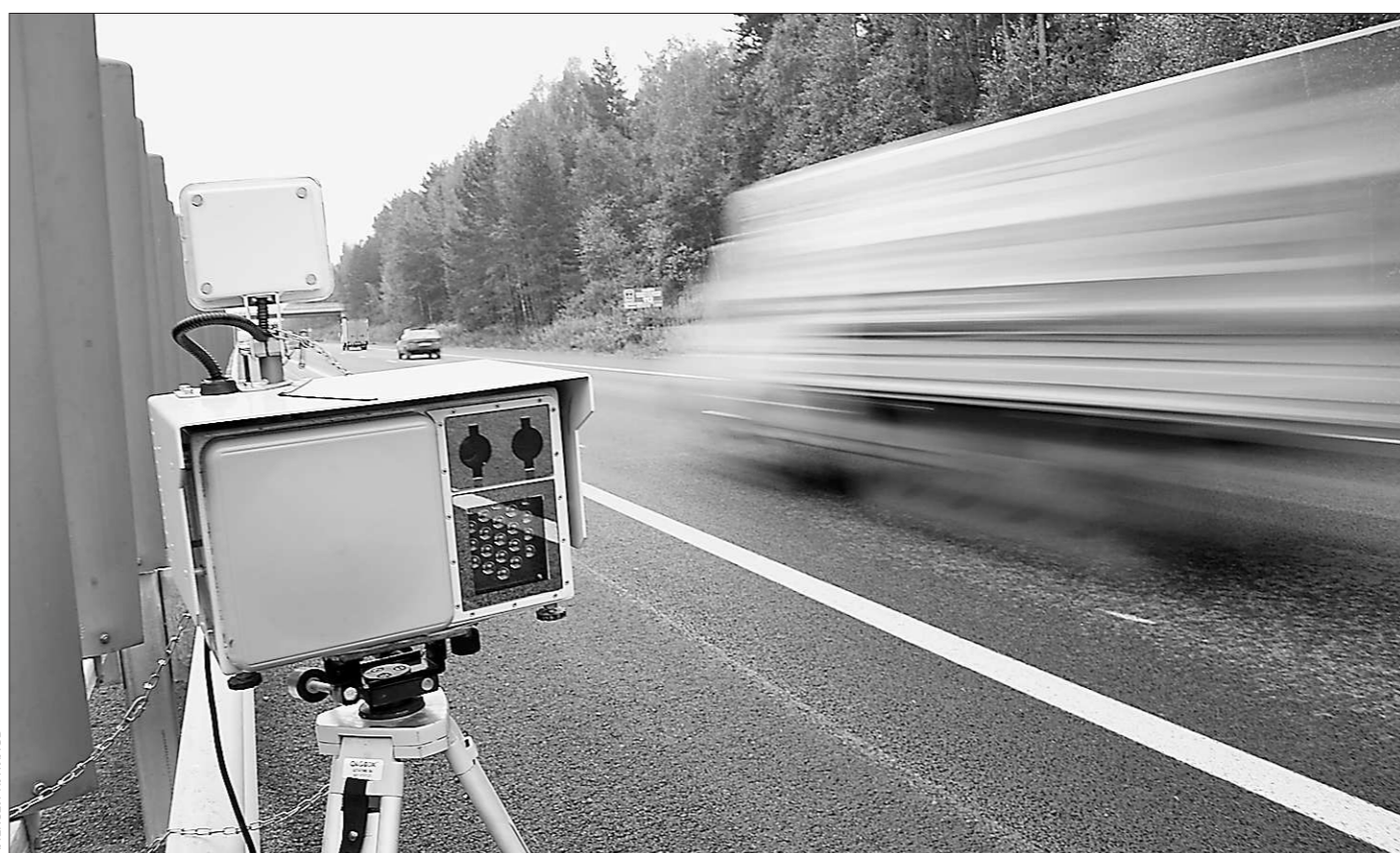
Не заметил фоторадар — жди квитанции со штрафом

Одобрил комитет и внесённый областным правительством законопроект «Об областном материнском (семейном) капитале». Он устанавливает размер областного материнского капитала — 100 тысяч рублей, которые будут выплачиваться в дополнение к федеральным деньгам. Члены комитета поддержали и предложенные правительством законопроекты о ежегодных выплатах всем пенсионерам единовременного пособия к Дню пожилого человека и об установлении прожиточного минимума пенсионера в 2012 году в сумме 5484 рублей в месяц.