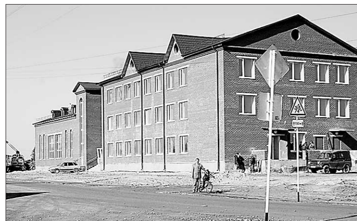
В новую школу по новой дорожке