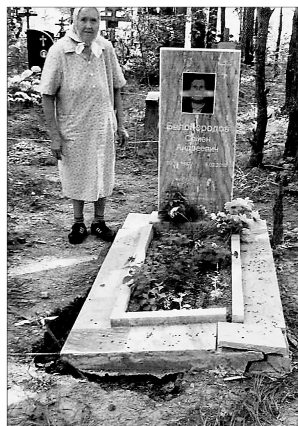
Вдова ужаснулась состоянию памятника