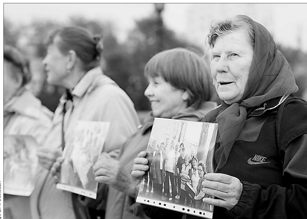
Екатеринбургские пенсионеры с гордостью демонстрировали фотографии, на которых были изображены их увлечения

Действительно, прохожие с удовольствием останавливались возле живой