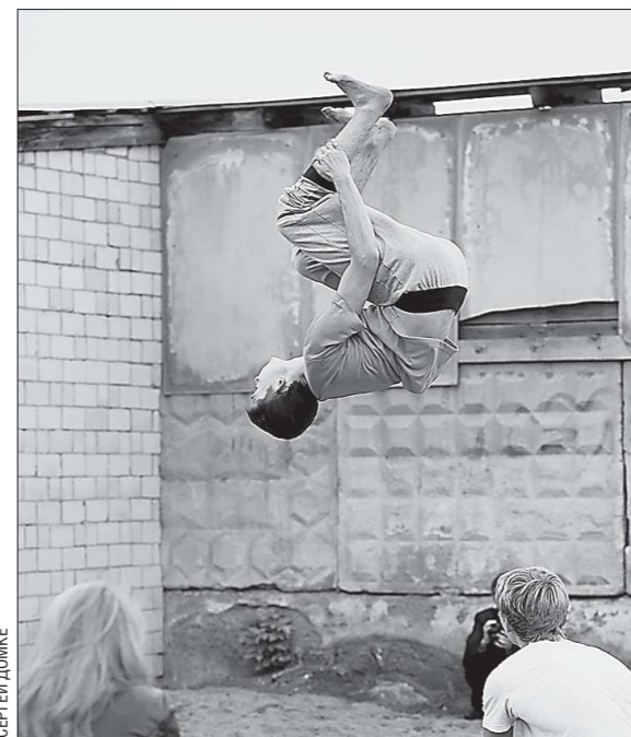
Исполнение подобных трюков всегда связано с риском, поэтому не все родители одобряют увлечения своих детей

Во время Сафин уже работал в комитете по делам молодёжи Красноуфимска,