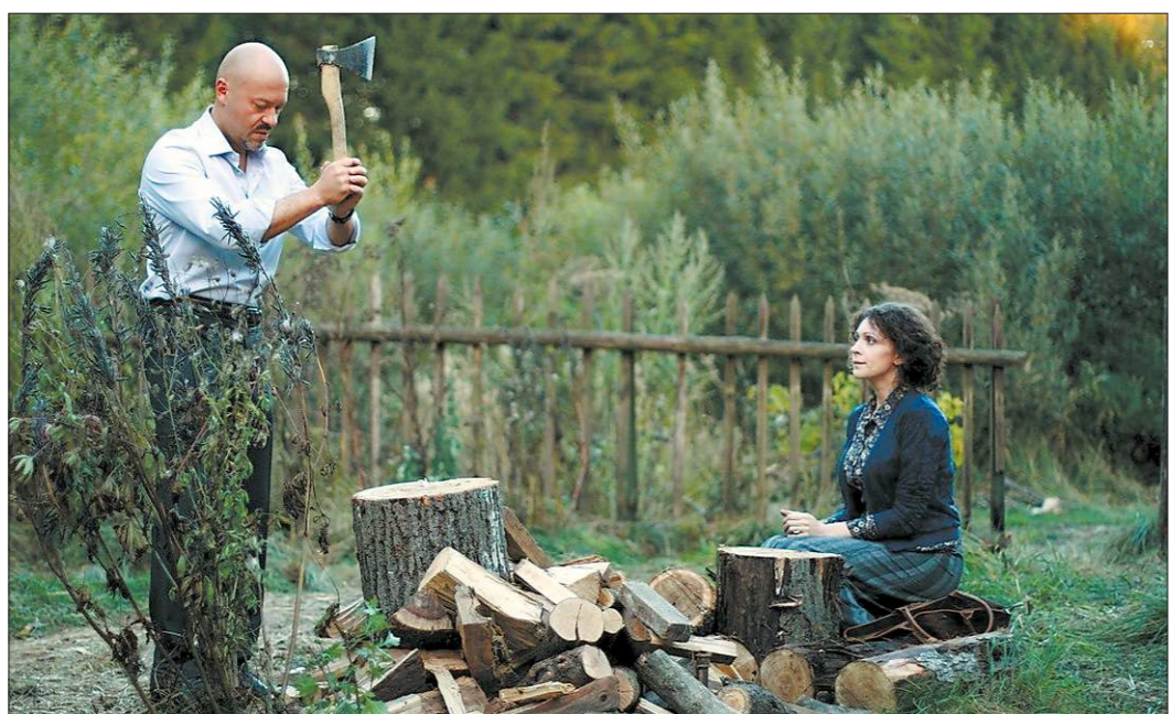
В фильме герою Фёдора Бондарчука пришлось «рубить сплеча», выбирая между карьерой и чувствами

Условием продюсеров было - любовь, юмор и, как в каждой сказке, «невозможное возможно». По законам жанра должен быть эппи-энд, но мой жизненный опыт не да-