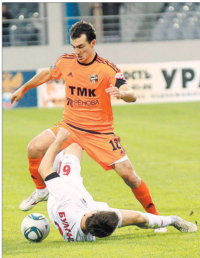
В матче с «Аланией» футболисты «Урала» чудом избежали больших неприятностей, чем потеря одного очка