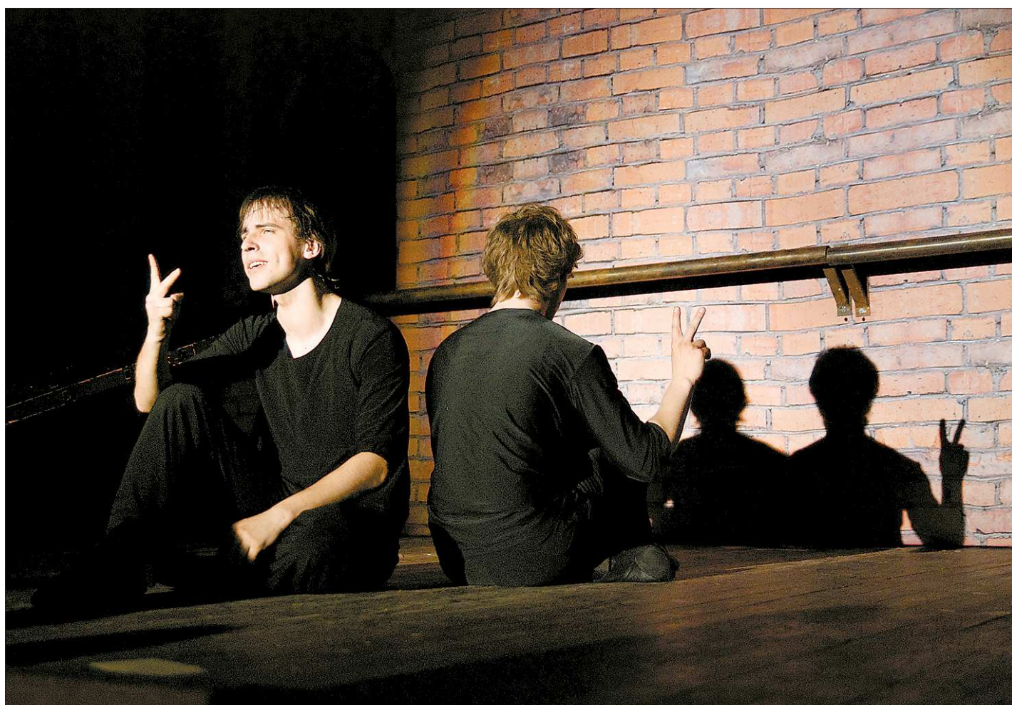
В театре «СинематографЪ» нет штампованных актёрских телодвижений, каждый жест — конкретная цель, точность в выражении эмоций

Совсем другой настрой в романтическом и озорном мюзикле от режиссёра Варвары Гребельной «Le Petit cafe», который вчера был представлен екатеринбуржцам. В «Маленьком кафе» зрители подали жаркое из чувств, десерт из мечтаний, свежеспойманное счастье и крепкий скандал со взбитыми сливками недоразумений. Детективная история разыграна под живую музыку саксофона и песни Мирей Матье, Далиды, Челентано. Сегодня — премьера