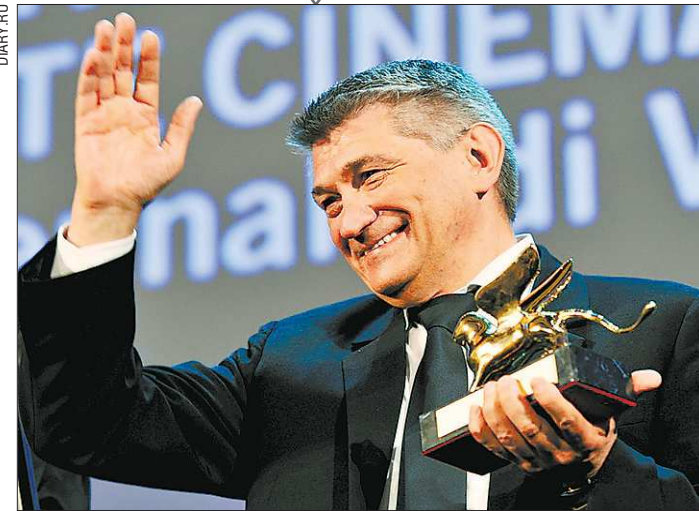
Улыбка победителя от Александра Сокурова