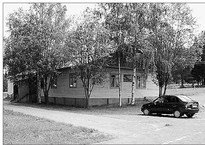
На такой лыжной базе даже городские соревнования не проведешь...

Вчера в Краснотурьинске состоялось открытие новой спортивной базы