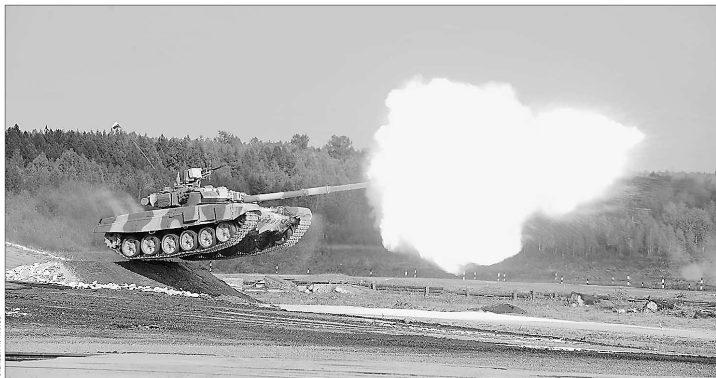
Танк Т-90С поражает цели с лёту и на лету

Наступило время объединения собственников жилья в каждом многоквартирном доме, время включения жителей в управление жилым фондом.