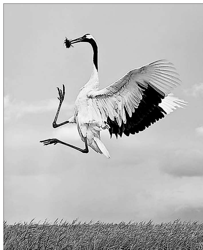
Эти грациозные птицы умеют «танцевать» в воздухе