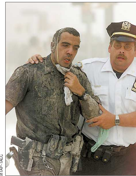
Так выглядел Манхэттен сразу же после обрушения небоскрёбов

На этом снимке – Пётр Столыпин во время знакомства с хуторским хозяйством недалеко от Москвы. Довести свои реформы до конца ему помешали выстрелы террориста в Киеве