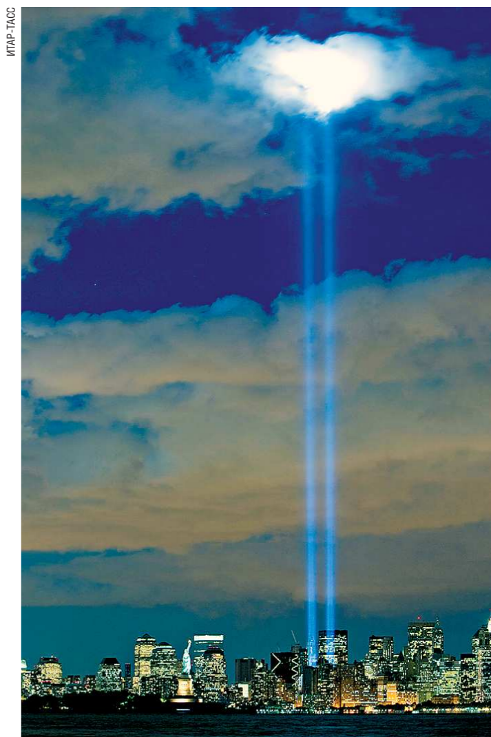
В дни памяти жертв 11 сентября два направленных ввысь луча света указывают место, где произошёл крупнейший в истории человечества теракт