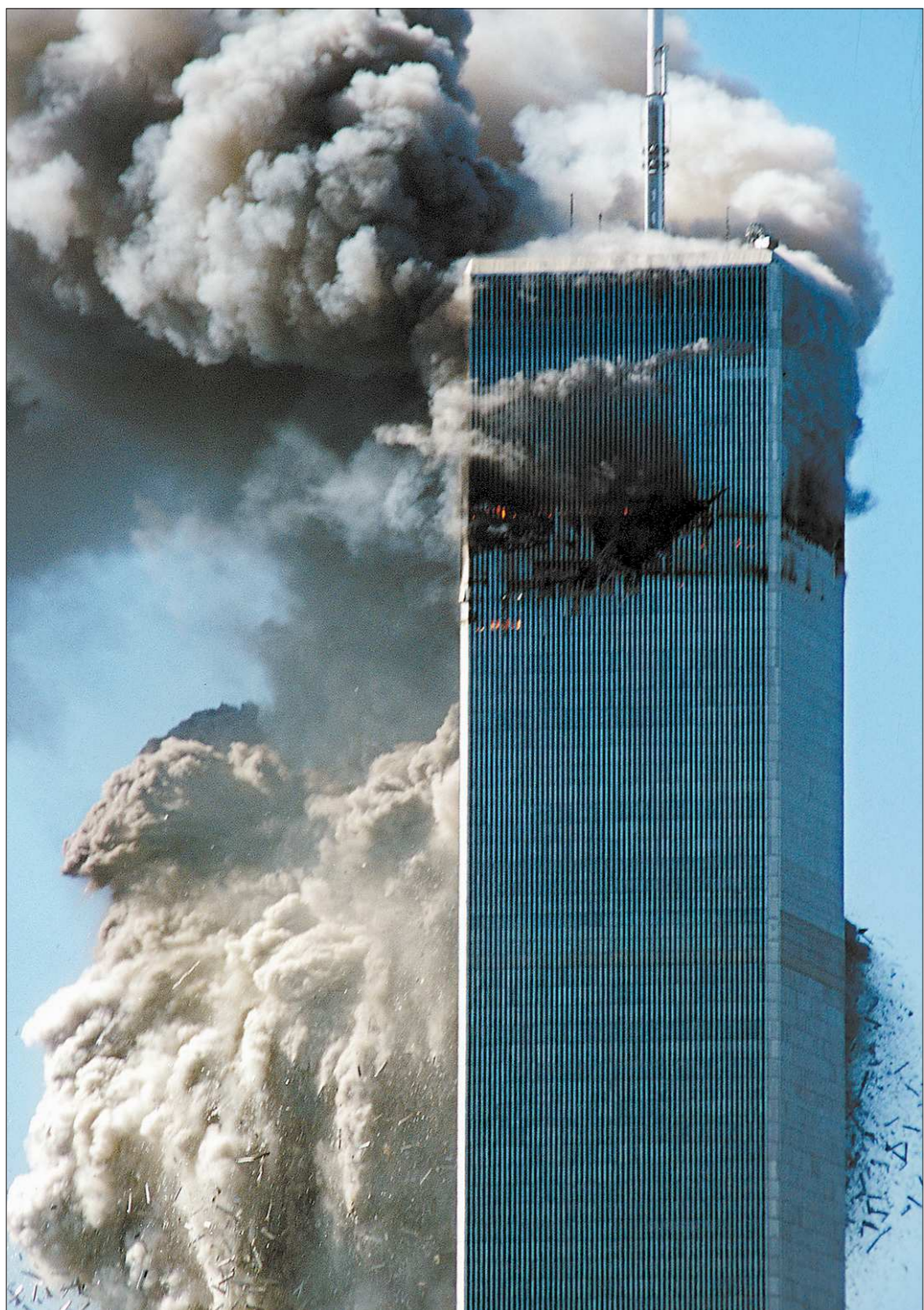
Южная башня Всемирного торгового центра рухнула в 9 часов 59 минут (через 55 минут и 51 секунду после попадания в неё самолёта).

Северная башня, хотя и была атакована раньше, простояла ещё полчаса, выдержав после удара 1 час 41 минуту и 51 секунду. Из-за полного разрушения лестничных колодцев в зоне попадания самолёта никто из оказавшихся на верхних этажах северной башни не выжил. Предполагается, что в ловушке оказалось 1366 человек.