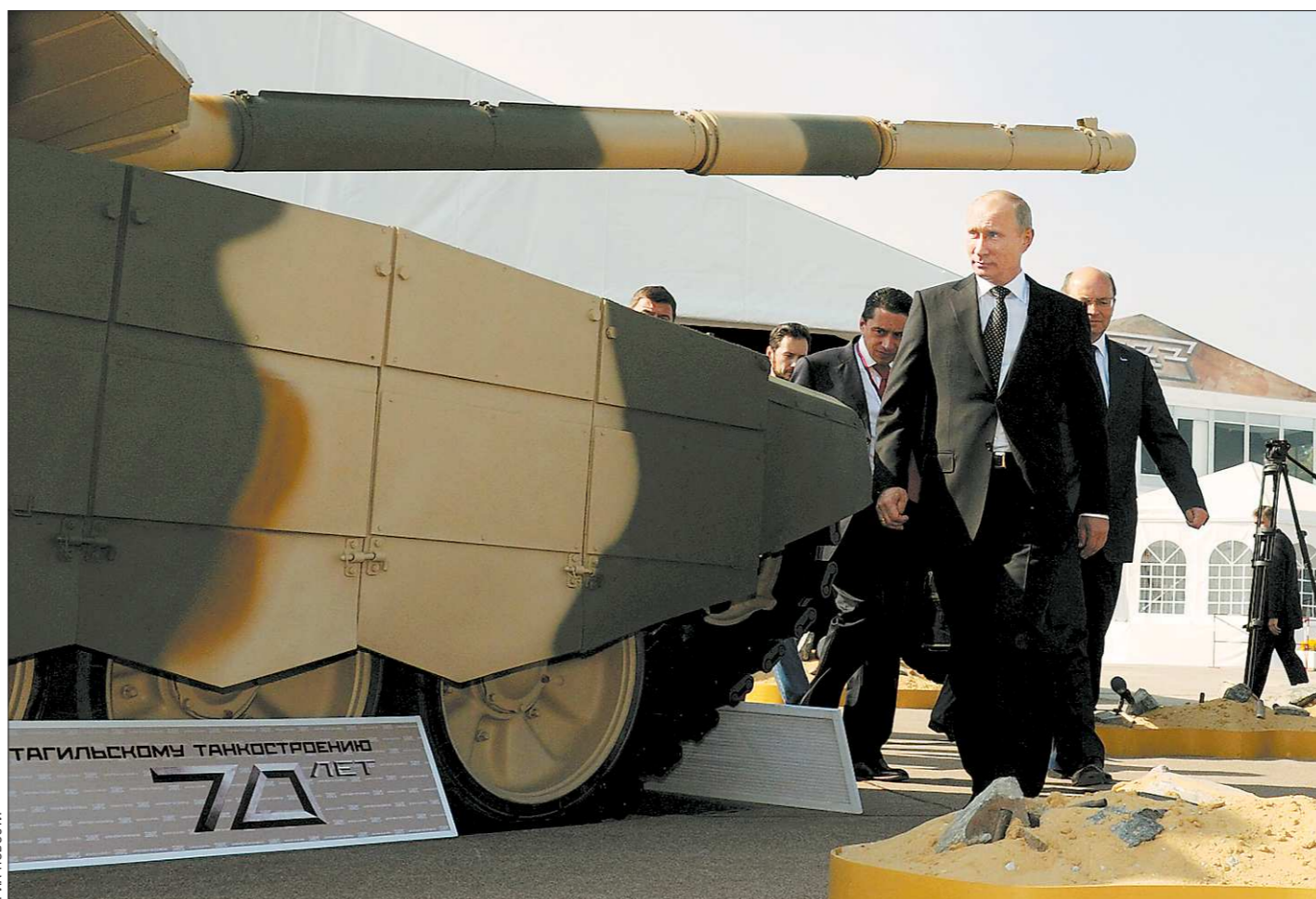
Владимир Путин досконально осмотрел выставочные экспозиции российских оборонных предприятий

Надо сказать, что это не первое посещение Влади-