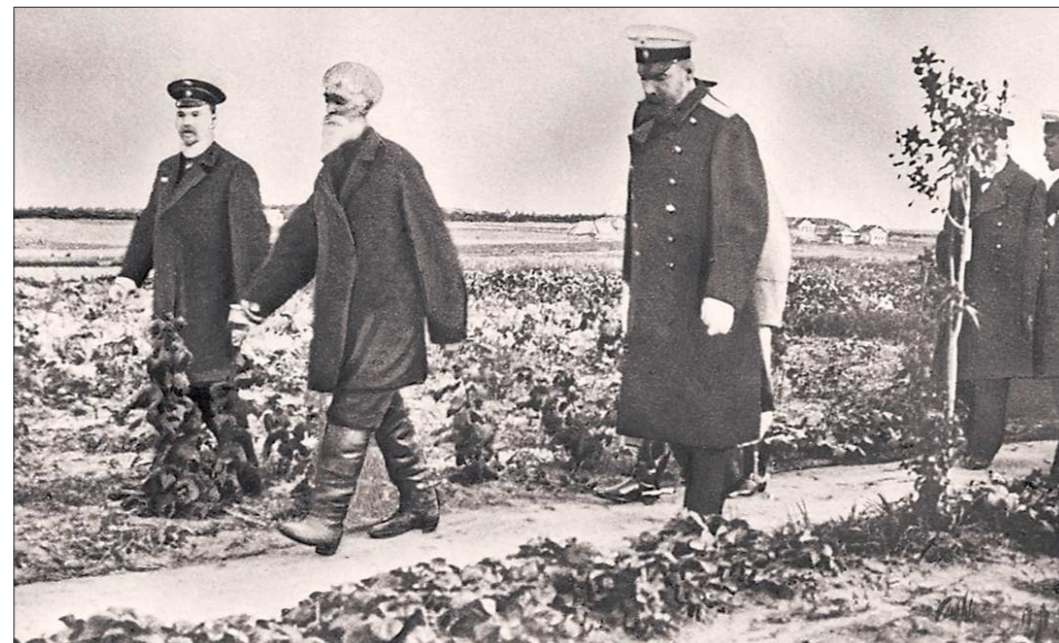
Аграрная реформа Петра Столыпина была направлена на разрушение общинного землевладения и создание класса крестьян – полноправных собственников земли. При этом около трёх миллионов крестьян переселились на выделенные им правительствами в частную собственность земли в Сибири.

Убийство Столыпина в сентябре 1911 года оказалось на руку полярным политическим силам. С одной стороны, левым, которых реформы Столыпина лишили социальной базы и исторической перспектив. С другой стороны – крайне правым, усмотревшим в деятельности премьер-министра покушение на свои привилегии. Лидер «октябристов» Гучков так охарактеризовал суть этой ситуации: «Человек, которого в общественных кругах привыкли считать врагом общественности и реакционером, представлялся в глазах тогдашних реакционных кругов самым опасным революционером».