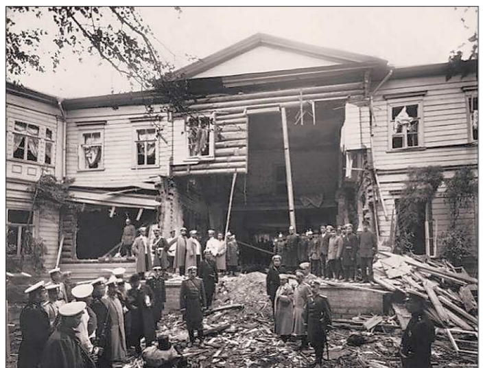
25 (12) августа 1906 года террористы попытались убить Петра Столыпина, устроив взрыв на его казённой даче на Аптекарском острове в Санкт-Петербурге. В результате погибли 27 человек, сам премьер-министр почти не пострадал. Так выглядела дача после взрыва

Пёрл-Харбор, как известно, – это не только трагедия, но и вступление Америки во Вторую мировую войну, из которой она вышла мощнейшей державой, способной управлять большей частью мира. Но вот чем закончится цепь событий, начало которым положило 11 сентября?