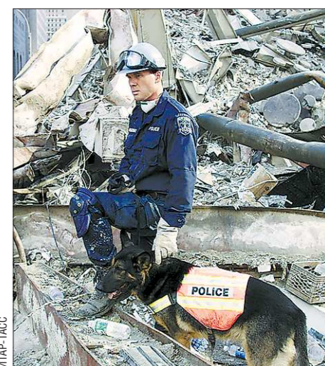
Руины башен Всемирного торгового центра

Демократические правительства всегда уязвимы перед террористами. Если власти не поддадутся на шантаж и в результате пострадают заложники, если силовая ответная акция окажется неудачной, общество потребует ответа. Но если хоть в чём-то уступить террористам, следующие их вылазки будут всё наглее и наглее.