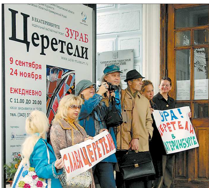
Очередь в музей. Просили занимать

Очередь (этакий флэш-моб) «организовал» сам музей, постаравшись тем самым привлечь внимание горожан к открывающейся экспозиции.