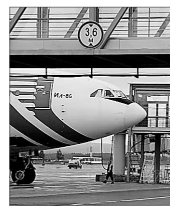
Так кто же останется «с носом»?

Также сообщается, что в настоящее время в аэропорту Екатеринбургa «имеется запас топлива, который обеспечит бесперебойную работу аэропорта в течение 5-7 дней. Законтрактовано уже 11,5 тысячи тонн из 14 необходимых на сентябрь. В частности, ОАО «Газпром-нефть» подтвердило дополнительную заявку ТЭК Кольцово на поставку в этом месяце трёх тысяч тонн авиакеросина». Беспочвенно по поводу нехватки топлива было выдвинуто тем, что накануне поставщики не полностью подтвердили направленные в их адрес заявки на сентябрь. Ссылаясь на отсутствие производственных мощностей и переориентацию по-