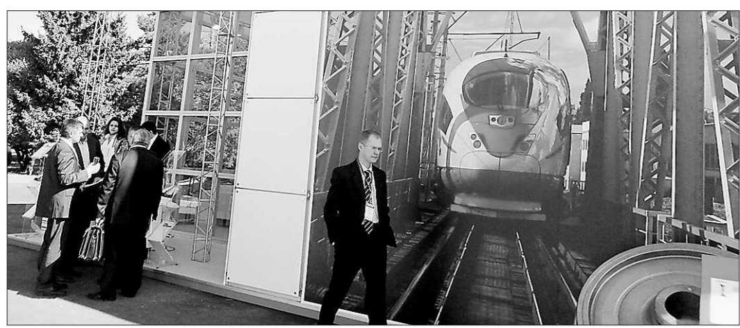
Новые локомотивы: мощнее, быстрее, надёжнее

Отдельно были сделаны выводы по результатам деятельности некоторых управляющих компаний: скорей всего в ближайшее время их ждёт дерзкая прокурорская проверка. Возможно, эти жёсткие меры помогут дать тепло в квартиры красноуральцев в срок.