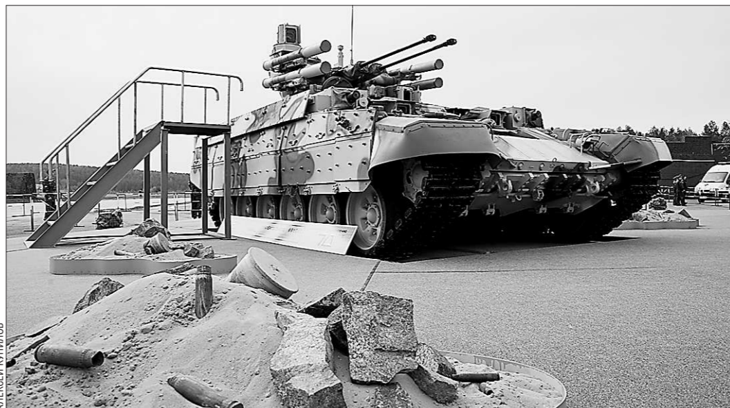
У бронетехники есть хороший помощник — боевая машина поддержки танков «Терминатор»

О необходимости скорейшего подписания такого документа также шла речь на российско-турецкой встрече на высшем уровне.