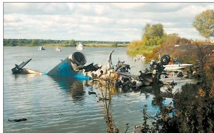
Часть самолёта Як-42 упала на берег, а часть — в реку

Самолёт — основной вид транспорта для клубов КХЛ. При крайне плотном графике игр, когда матчи проводятся через день, иного способа добраться до места назначения и успеть хоть в какой-то