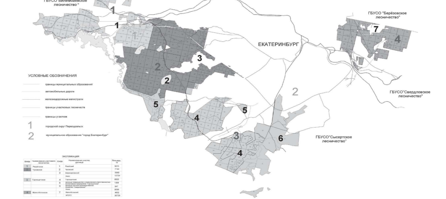
КАРТА-СХЕМА 1 расположение участковых лесничеств ГБУСО «Верх-Исетское лесничество» Свердловской области

Все леса Верх-Исетского лесничества по целевому назначению разделены на: 1) защитные; 2) эксплуатационные. На долю защитных лесов приходится большая часть территории Верх-Исетского лесничества — 96 процентов, эксплуатационные составляют 4 процента.