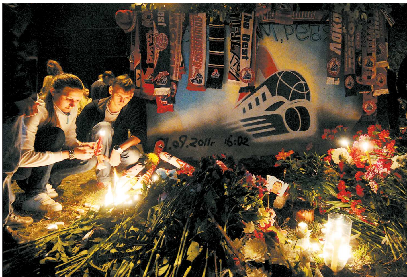
Ночь на восьмое сентября, Ярославль. Болельщики «Локомотива» у стадиона «Арена-2000»

При этом вполне очевидно, что взлёт проходил не в штатном режиме: Як-42 оторвался от земли уже за пределами полосы.