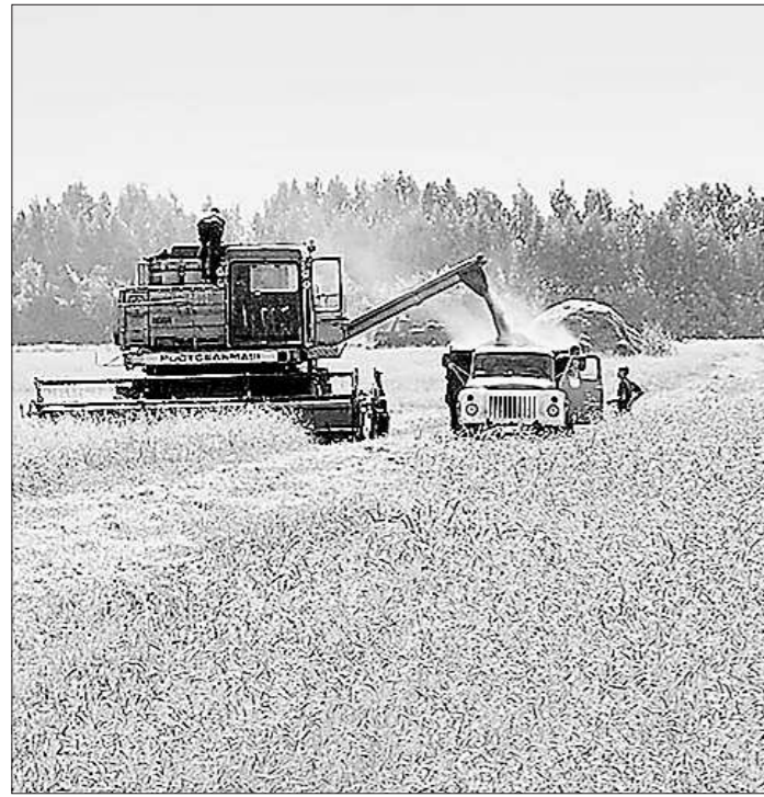
Трактор РТМ-60 проходит полевые испытания