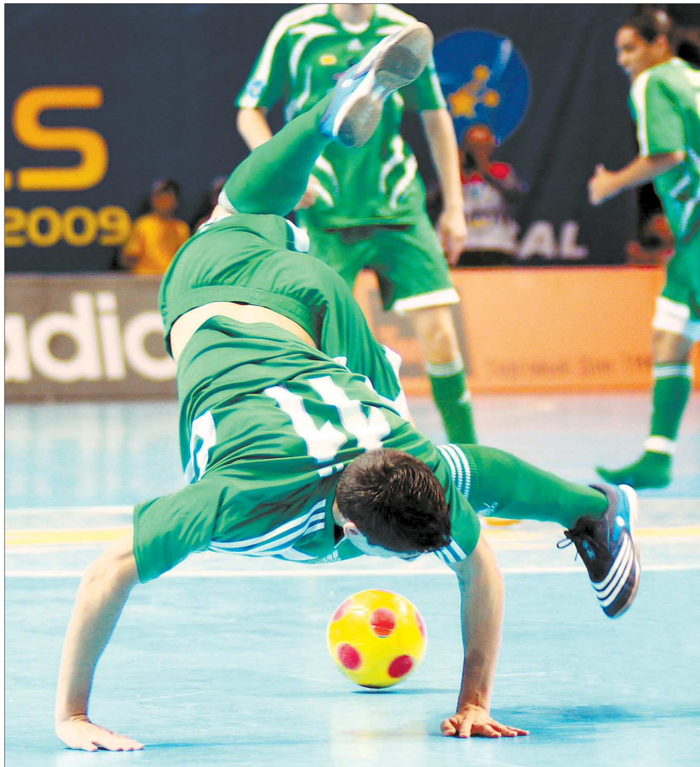
Отечественный мини-футбол оказался в положении вверх ногами: титул чемпиона России большинство команд пытаются завоевать усилиями иностранцев

—Конечно, для нас это стало небольшой неожидан-