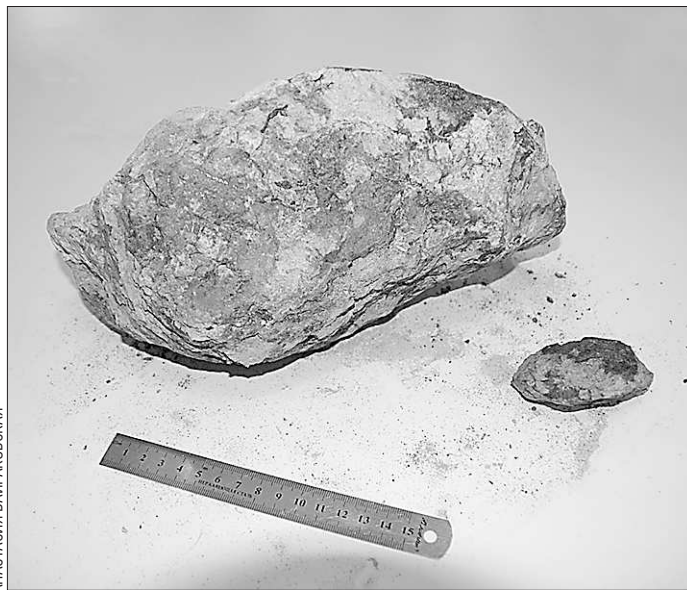
Образцы метеорита Дронино станут объектом исследований для дипломных работ студентов

Любопытно, что более десяти лет назад один из местных жителей Яманской области нашёл у себя в огороде странный камень и передал образец в Российскую академию наук, где и заключили, что это вещество — внеземное. После этого в Кашиновский