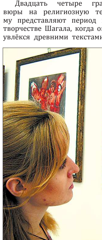
Графика Шагала вызвала у нижнетуринцев живой интерес

Двадцать четыре гравюры на религиозную тему представляют период в творчестве Шагала, когда он увлекся древними текстами.