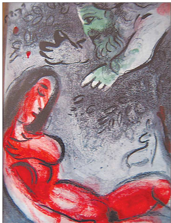
Литография Марка Шагал «Бог и Ева»