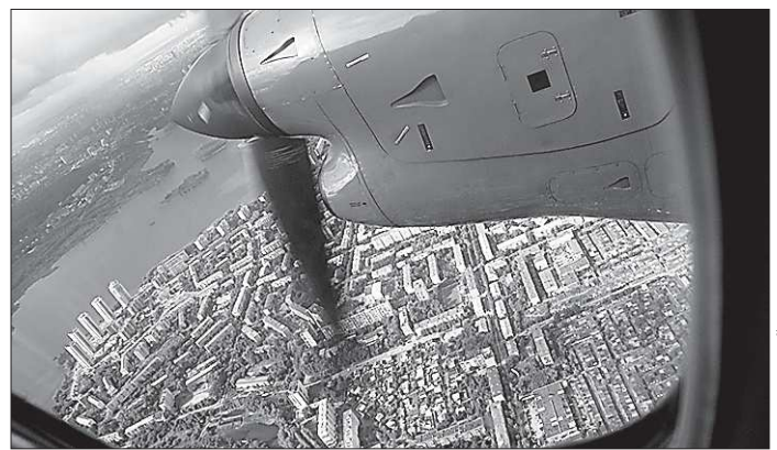
Под крылом самолёта — море недвижимости, которую надо учесть