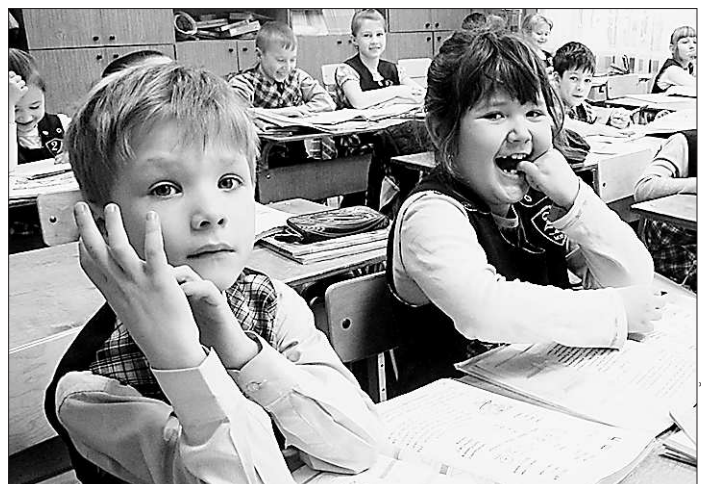
Новые игрушки или школьные тетради? Некоторым детям порой приходится выбирать