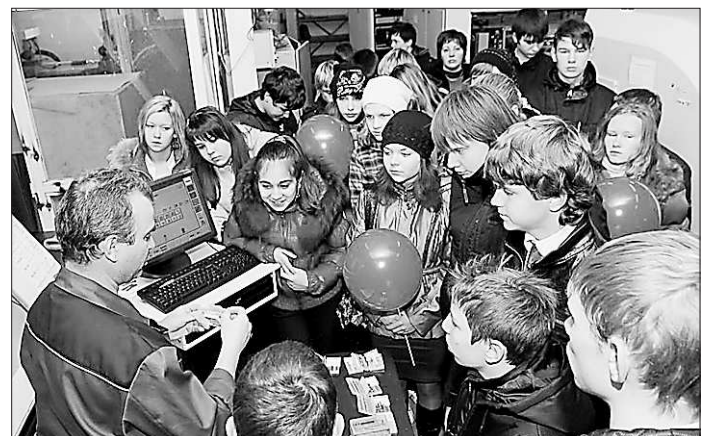
Дети должны стать частыми гостями производственников