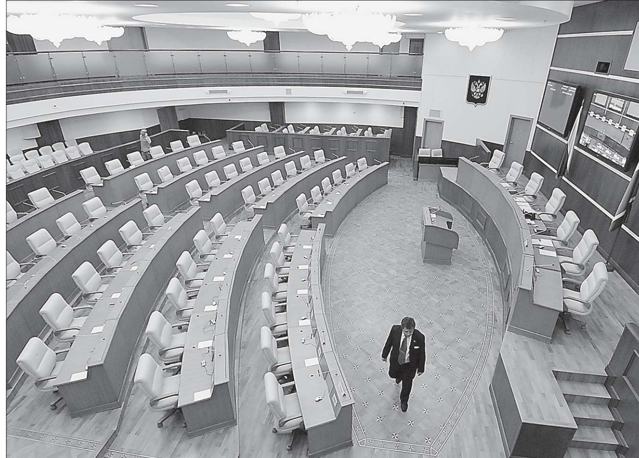
После выборов четвёртого декабря в этом зале соберётся новый состав нового — однопалатного парламента

«На федеральных выборах, я думаю, все семь партий будут участвовать в выдвижении своих списков, — рассуждает Владимир Мостовщи-