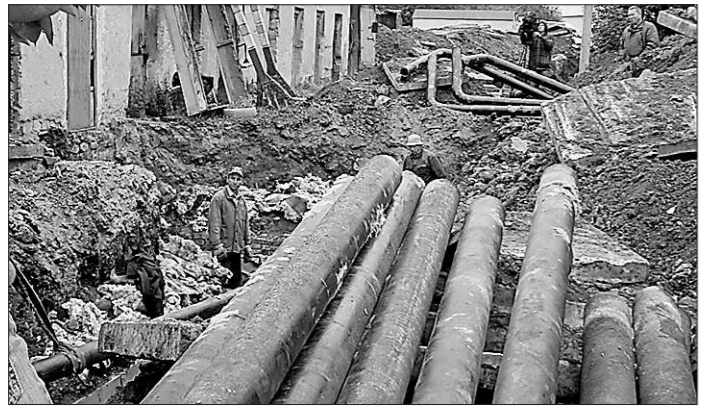
Коммунальный пейзаж на Елизаветинском шоссе: выкопали старые трубы, уложим новые