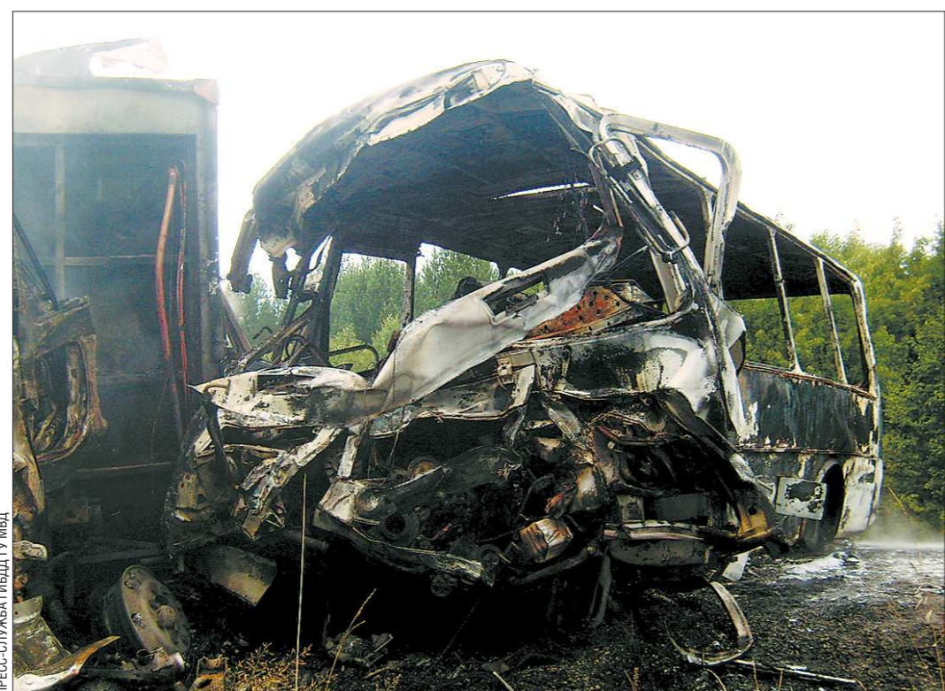
После лобового столкновения и фургон, и автобус сгорели

По информации пресс-службы областного полицейского главка, произошло следующее. Служебный автобус ПАЗ, принадлежащий ДРСУ Березовского, вез бригаду рабочих в Ачит. В том же западном направлении двигался автомобиль «Лада-Калина». На 29-м километре областной автодороги Первоуральск — Шамары (Первоуральского ГО) водитель «Лады» решил обогнать колонну транспорта по правой обочине. Однако во время этого маневра он не справился с управлением, машину занесло, и она врезалась в переднее колесо автобуса. От удара ПАЗ выскочило на встречную полосу, по которой двигались гружёный овощами изотермический автомобиль-фургон мар-