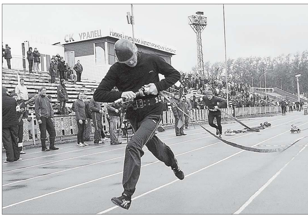
Дождь спортсменам мешал, а зрители, как могли, помогали. Стометровку пожарные брали на одном дыхании

За победу боролись сто лучших огнеборцев Свердловской области