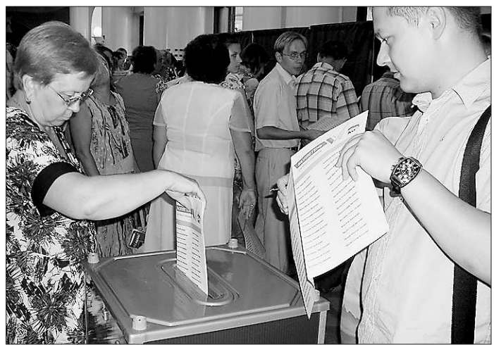
Семь раз подумал — один раз проголосовал