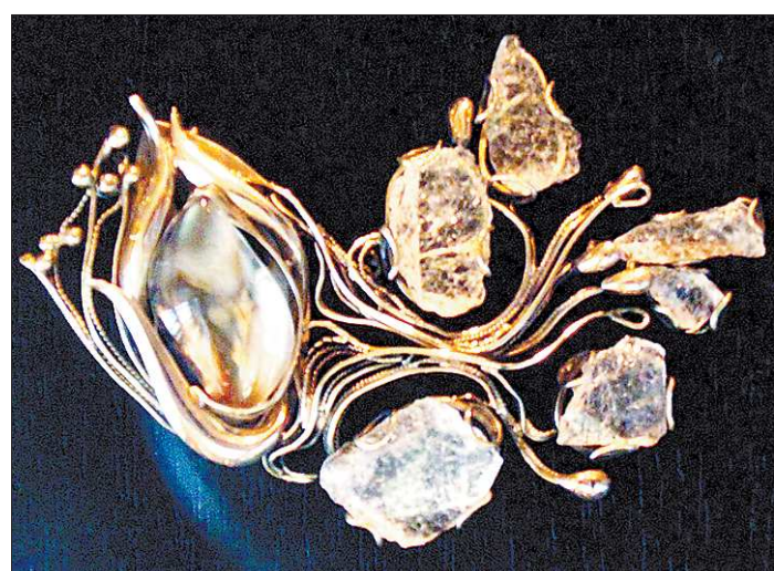
В руках мастера хрусталь и кварц превращаются в апрельские льдинки. Брошь «Апрель»