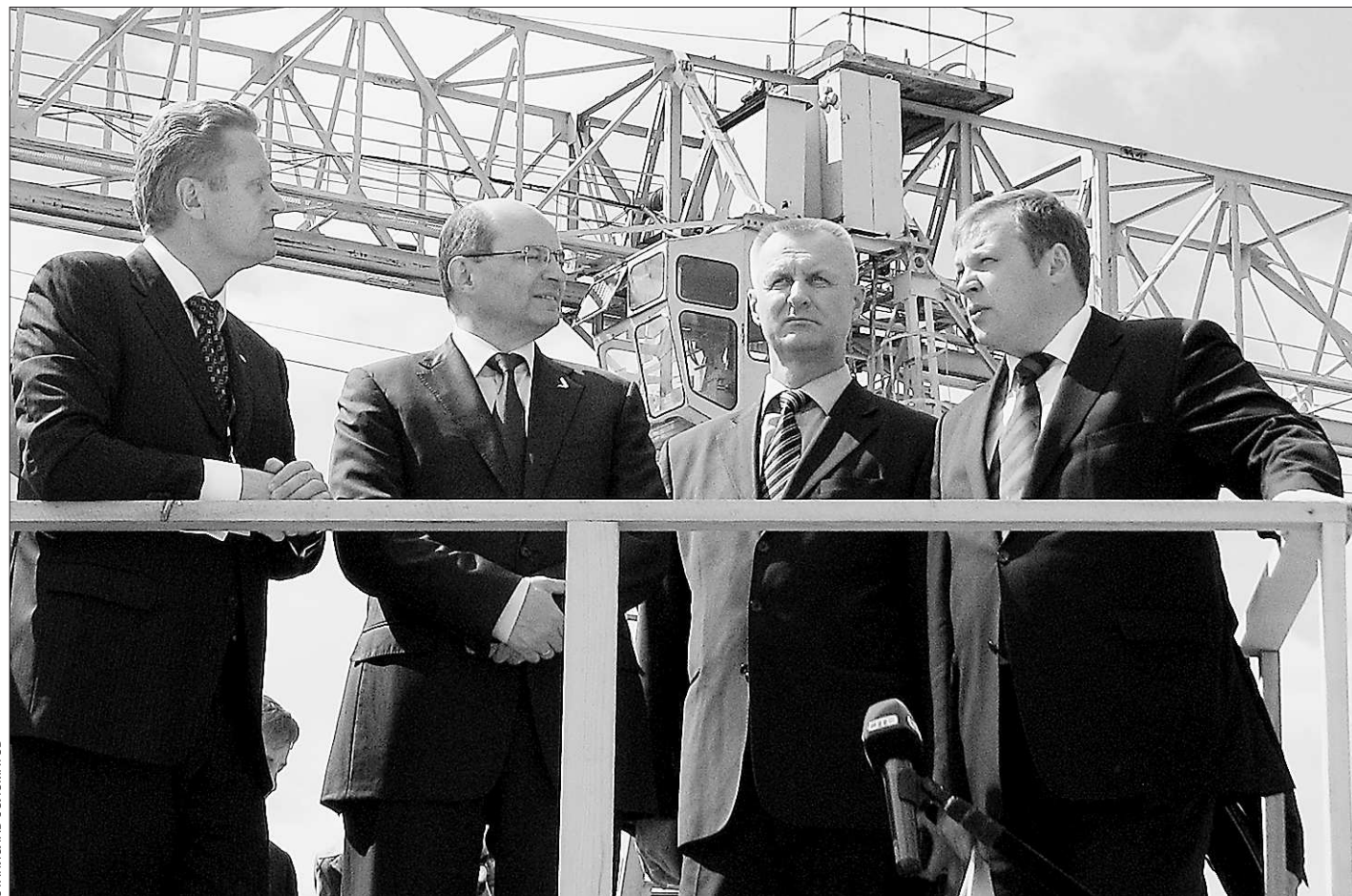
А. Мишарин осматривает на предприятии «Стройкомплект» площадку будущего автомобильного хаба

В своём заключительном слове на заседании губернатор подчеркнул, что, прежде всего, должно быть ускорено создание схемы размещения транспортных объектов области. Это предложение было внесено в решение президиума. В документ вошёл также и ряд конкретных предложений, в частности, решено определить сроки переноса грузового двора станции Екатеринбург-Товарный с улицы Челюскинцев в столице Урала в район железнодорожной станции Гипсовая.