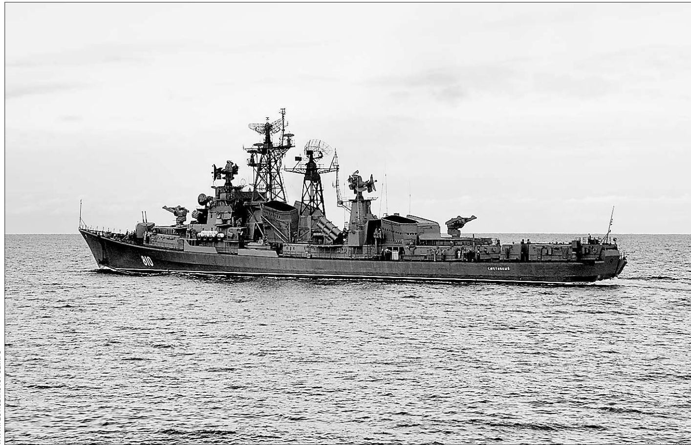
«Сметливый» – последний корабль из серии «поющих фрегатов», оставшихся в строю отечественного ВМФ. Прозвище «поющие» эти суда получили за характерный звук, который издают работающие газовые турбины

Добавим, что информация об обстоятельствах произошедшего, которую вдова пилота выискивала сама, поступала крайне противоречивая. По сообщениям шведских СМИ, русского пилота жестоко убили, затем, со слов Вейнберга, появилась версия о самоубийстве. Некоторые коллеги погибшего, недавно вернувшиеся из Швеции, склонны к версии несчастного случая.