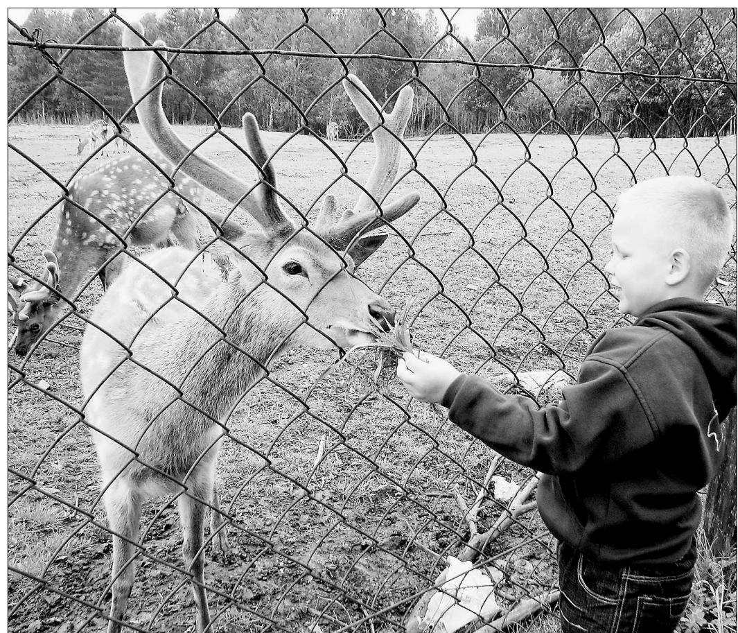
Легче всего общий язык с оленями находят дети

Практически все машины, следующие по висимской дороге, притормаживают возле ограды, за которой пасутся пятнистые олени. Благородные животные привыкли к людям и их подаркам: кусочкам хлеба, баранкам, подсоленным крекерам. Они доверчиво подходят к воротам, не сопротивляются, когда гости гладят их по спине, ощупывают бархатистые молодые рожки. Эти ещё не окостеневшие панты – и есть главное богатство двухсот пятнистых оленей и маралов, живущих в Висиме. С древних времён панты являлись сырьём в фармакологии, и, например, в китайской медицине им отводятся наряду с женьшенем главенствующие роли. У висимских животноводов установлены связи с