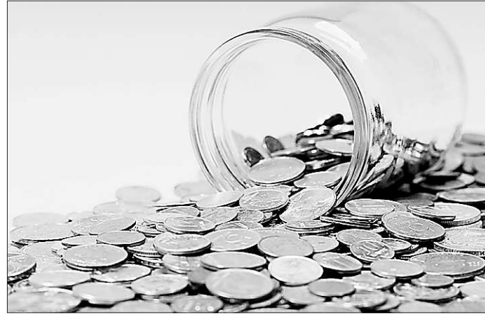
А вот таким способом денег на старость не накопишь...

«Все мы привыкли нашим судам ставить в упрек их «непрозрачность». Но теперь каждый районный и городской суд имеет свой интернет-сайт, где публикует все выносимые судьями постановления. Эта практика будет продолжаться?»