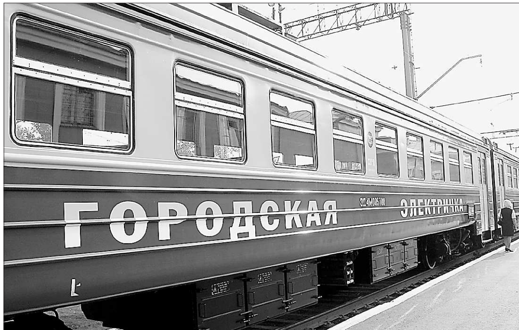
Уже сейчас городская электричка перевозит по 70-75 тысяч человек в месяц

— Значит, в ближайшее время тарифы расти не будут? — СПК в росте не заинтересована. Но мы несем убытки от перевозок по тарифам, устанавливаемым регионом, поэтому дотируемся из областного бюджета. Понимаем, что на другой чаше весов