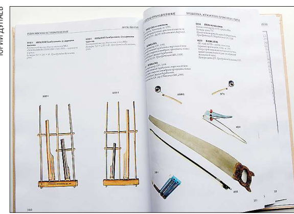
Этот же инструмент на страницах каталога