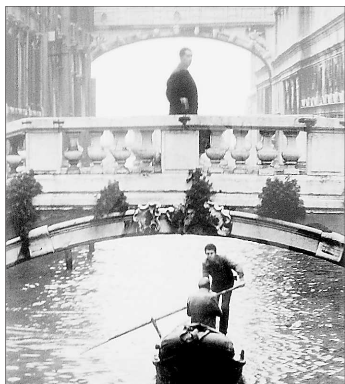
Вечная вода Венеции

Стоит предупредить. Те, кто не следит за перипетиями отечественных реалий, скорее всего, «споткнутся» о подзаголовок выставки: «Дом-2» в реальности. Выставка – совместный проект фотохудожника и продюсера рейтинговой телепередачи. Однако когда остаётся с портретами участниц реалити-шоу один на один, не выискивай телевизионных знаменитостей – напитывайся эмоциями, атмосферой, «ошибками» фотосессии.