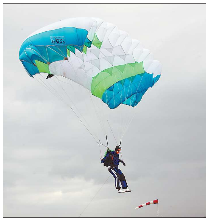
Праздничный десант в небе над Логиновым

Сельчане жаловались губернатору много, долго и эмоционально.