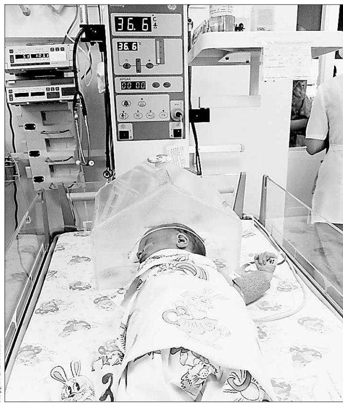
В нашей области охрана материнства и детства – приоритеты

В ходе слушаний обозначены и поддержаны такие программы, как «Здоровые семьи — забота народная», «Реабилитация детей с экстремально низкой массой тела», «Народные лекарства», а также профилактической направленности инициатива по социальной рекламе «Урал — территория здоровья» и другие.