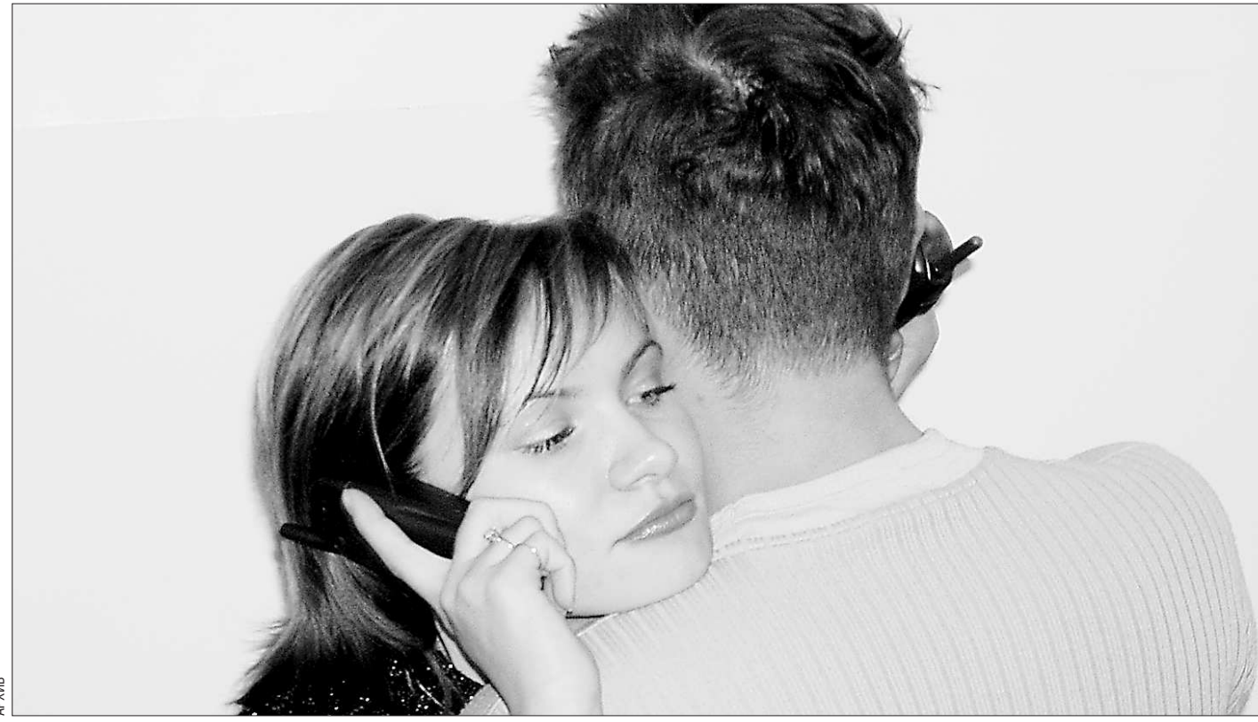
Хорошо, когда абонент в зоне доступа... А если нет?

—Средняя точка безубыточности — 300–500 квадратных метров, в зависимости от износа, — считает Николай Смирнов. — Поэтому не исключено, что в ближайшее время мы будем наблюдать процесс укрупнения компаний, а также процесс появления муниципальных УК.