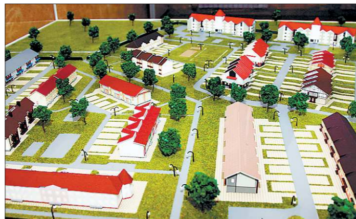
Светлореченский готов к новосельям

В этом экспериментальном посёлке всё радует глаз — и ландшафтный дизайн, и просторные детские и спортивные площадки, и оборудованная стоянка для авто, и даже специальные места для выгула домашних животных. А каждый из таунхаусов — индивидуален. Это вистину жилой, а не просто спальный район. В одном из домов сделано даже невидимое отопление — тепловые панели, создающие осо-