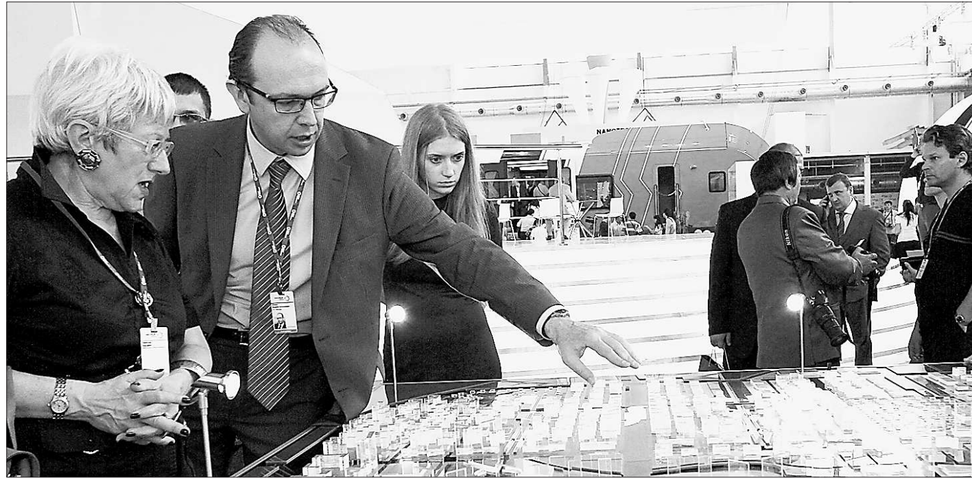
Сверху лучше видны перспективы мегаполиса

Среди перспективных направлений сотрудничества сторон назвали металлургию, машиностроение, строительство, энергетику.