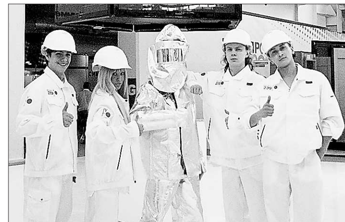
Сегодня это стажёры, а завтра – новая смена металлургов

Подтверждение тому – Авионик Корпорации «ВСПО-АВИА», основные мощности по переработке титана которой размещены в Верхней Салде. Особую гордость корпорации и Свердловской области составляют изделия из титана и его сплавов почти для всех самолётов, выпускаемых в мире. В том числе, для уникального дриллаера (самолёта мечты) – Боинга-787.