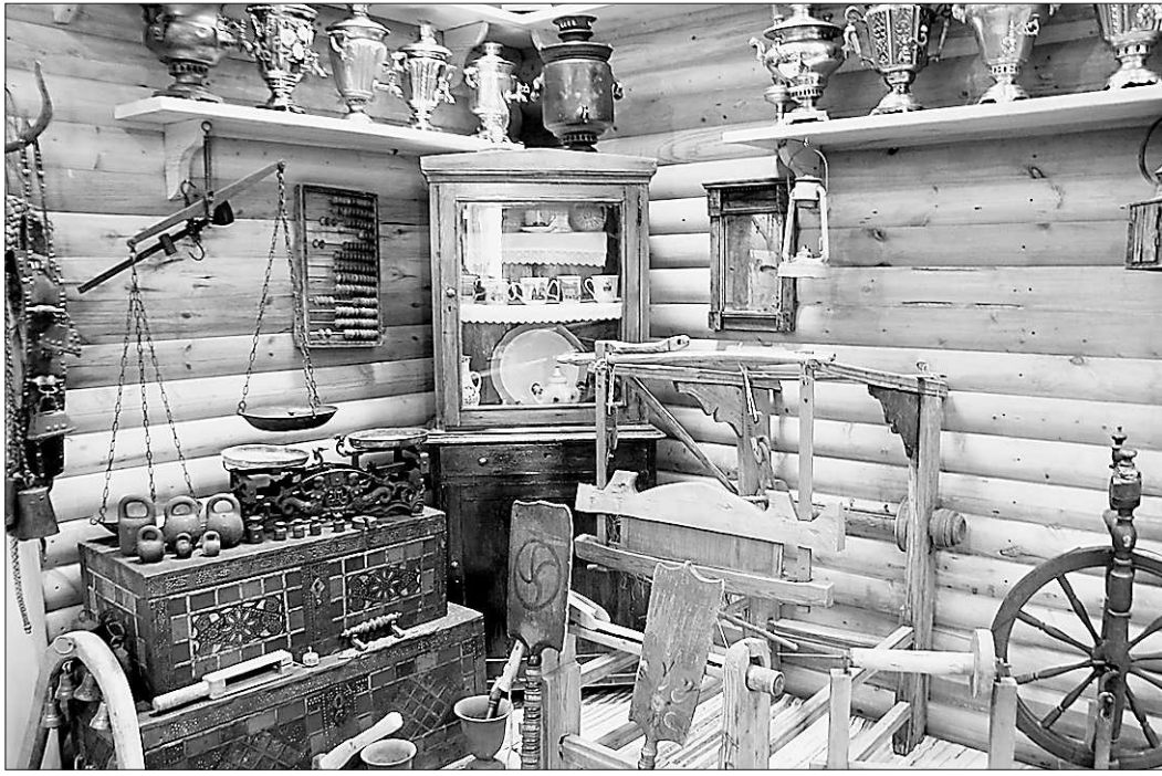
Уголок крестьянского быта

Теперь ни одна ярмарка, ни один городской или сельский праздник не обходится без чаепития, а самовар-богатырь путешествует по району, радуя