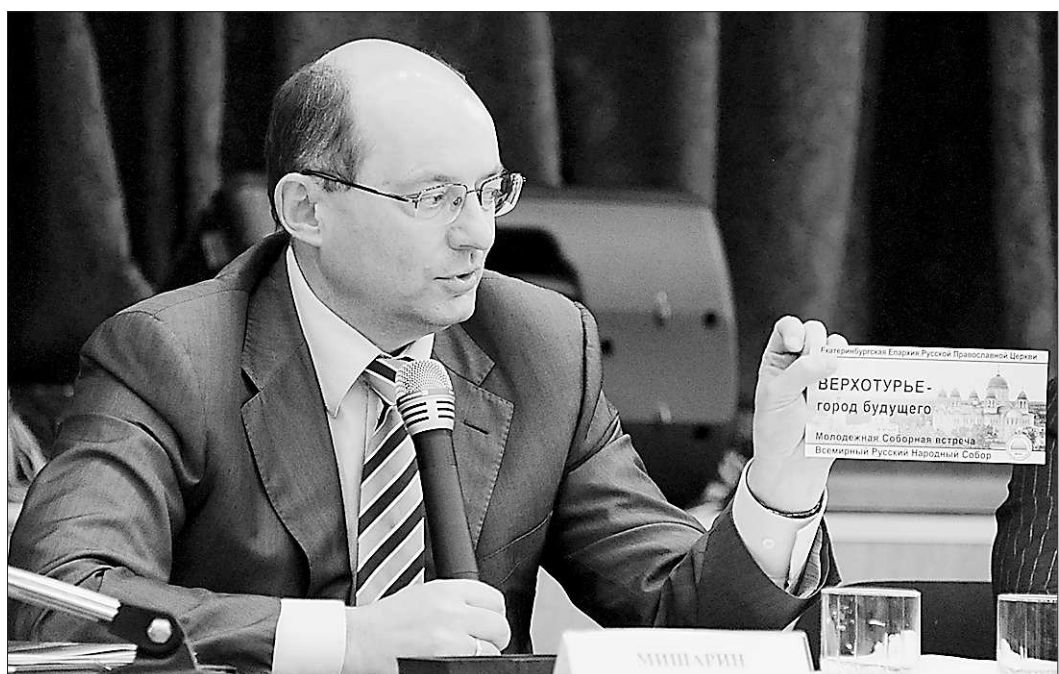
Губернатор Александр Мишарин призвал молодых объединиться во имя города будущего