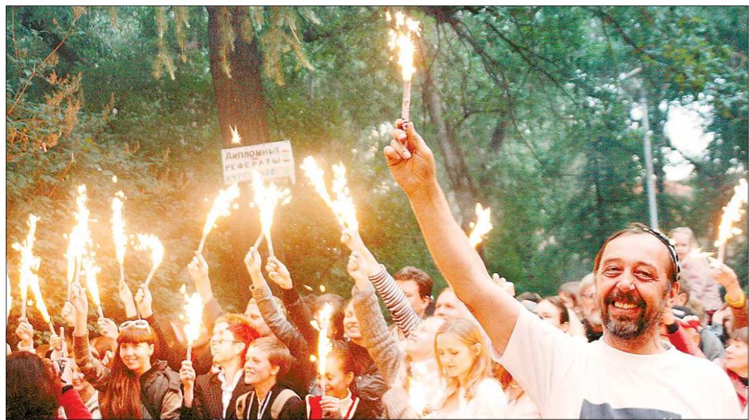
Огня и тепла Коляды хватят на всех