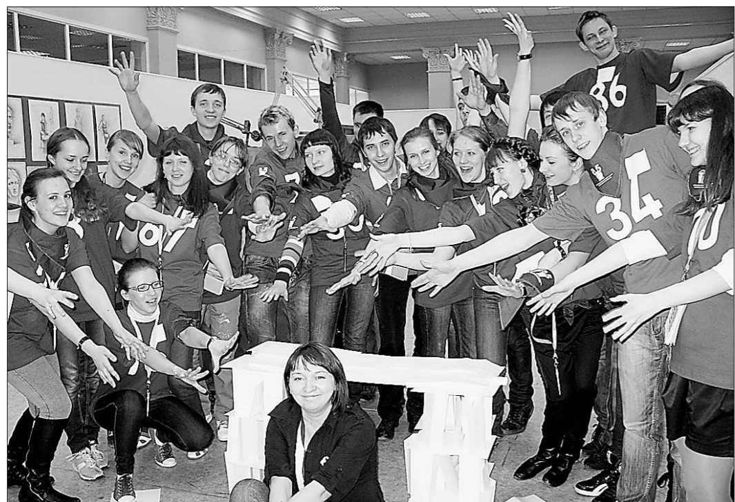
Это не просто игры в ходе отбора ребятам приходится проявлять различные качества, ведь быть только отличником для стипендии недостаточно