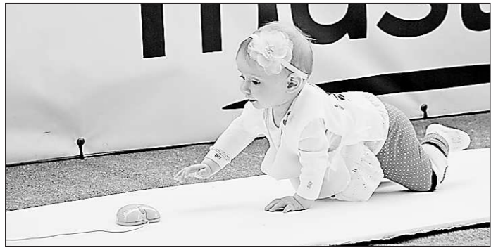
Средняя скорость девочек – 0,58 километра в час, мальчиков – 0,48 километра в час