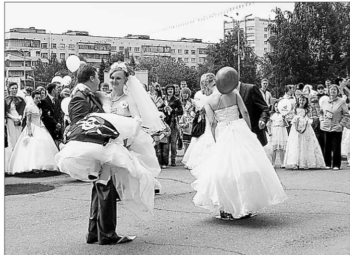
Мужчины показали, что всегда готовы носить своё счастье на руках

Когда просматриваешь весь список победителей, смущает, что в основном все они из крупных городов. Так, второе и третье места достались педагогам екатеринбургских школ. Лишь три сельских учителя нашли своё место в рейтинге.