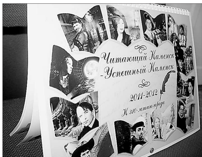
Их пример – другим наука..

Треть из них – аспиранты, одна – кандидат медицинских наук, двое имеют по два высших образования, остальные учатся. Это выяснилось уже в ходе работы над календарём, тяга к знаниям оказалась характерным признаком успешности. Ещё одна отличительная особенность – дисциплина. Точнее – самодисциплина. Несмотря на огромный занятость, все они чётко соблюдали график съёмки, были точны и обязательны. Ну и конечно, отсутствие комплексов, готовность к творческому эксперименту – главная изюминка проекта. Как выяснилось, внутренняя свобода свойственна им по жизни.