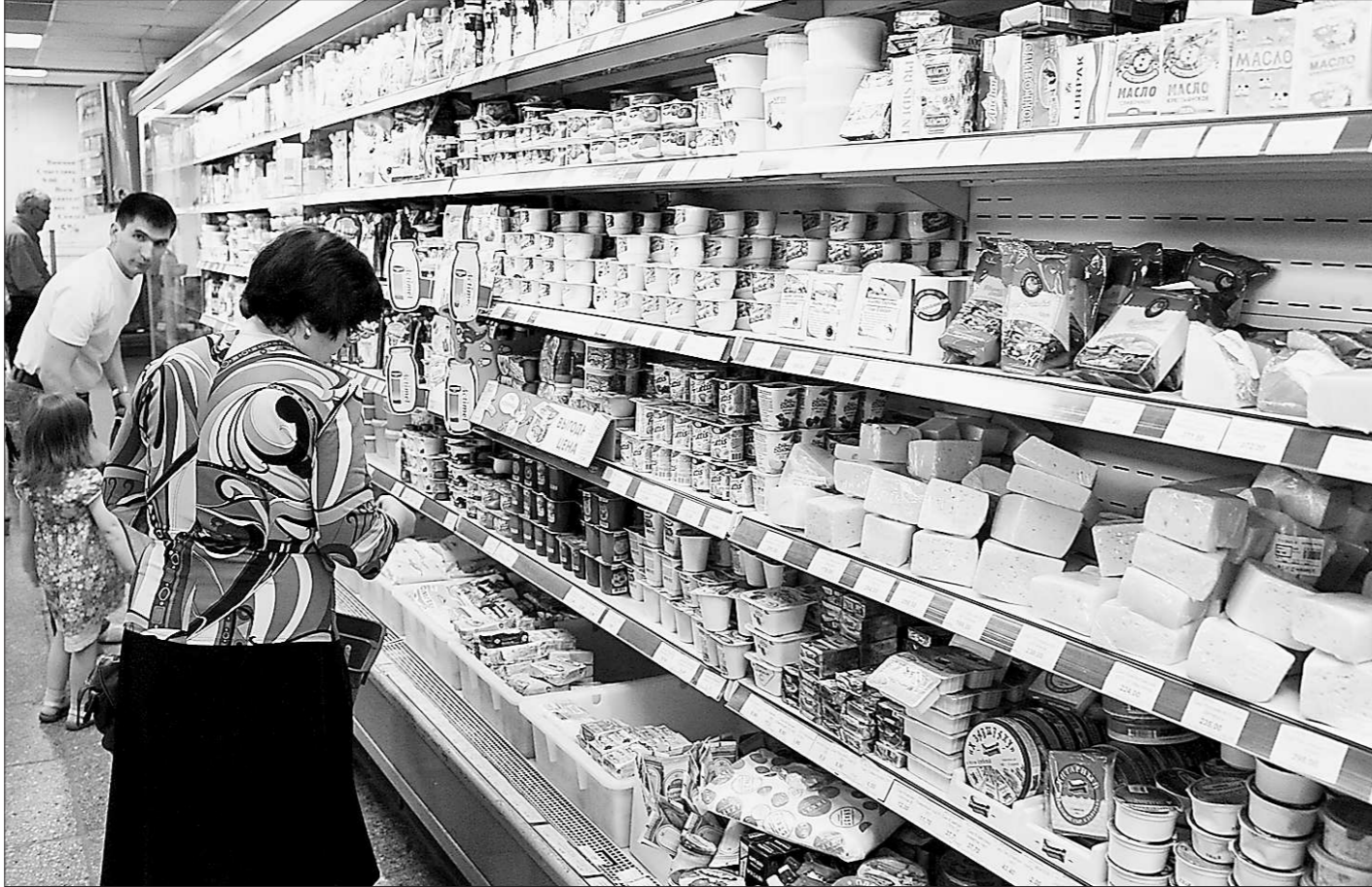
Порой среди изобилия на магазинных прилавках проблематично найти местный продукт

Понятно, у бизнеса свои законы. Прибыль прежде всего. Но как быть, если в результате бурного продвижения феде-