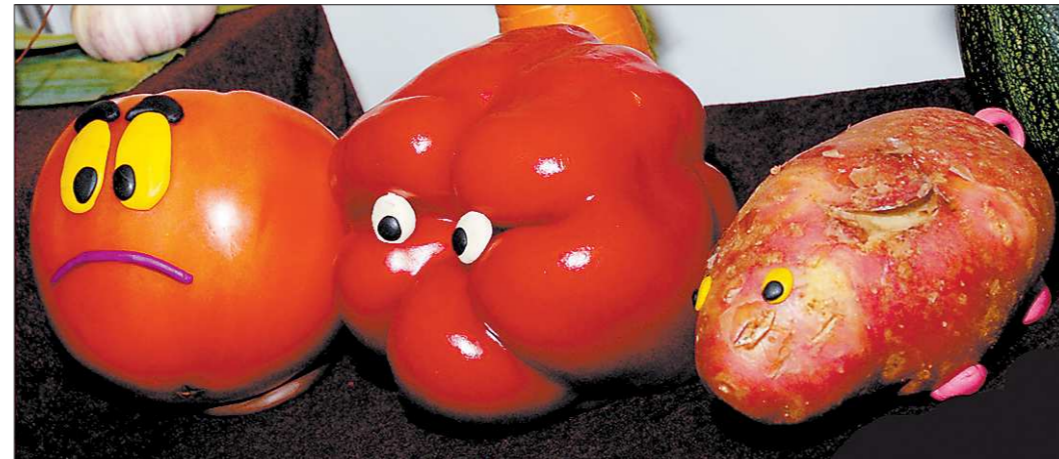
Носителям палочки вход заказан

Не получив от еврочиновников внятных ответов по поводу причин появления и распространения заболевания, вызванного энтерогеморрагической кишечной палочкой, главный государственный санитарный врач, он же глава Роспотребнадзора Геннадий Онищенко, выразился довольно резко: «Это является свидетельством того, что хваленое европейское санитарное законодательство, к переходу на которое склоняют Россию, не