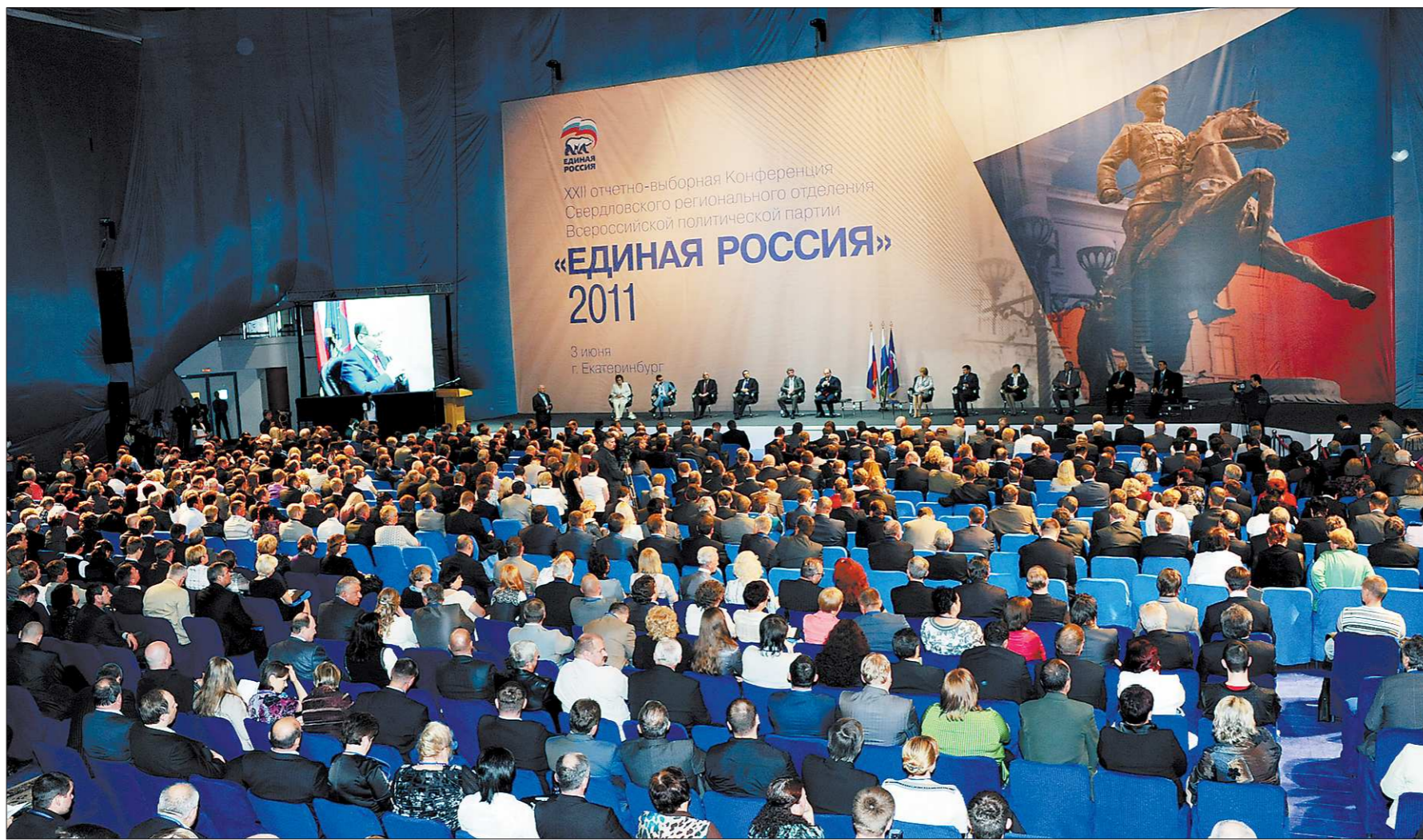
«Единая Россия» — партия растущая