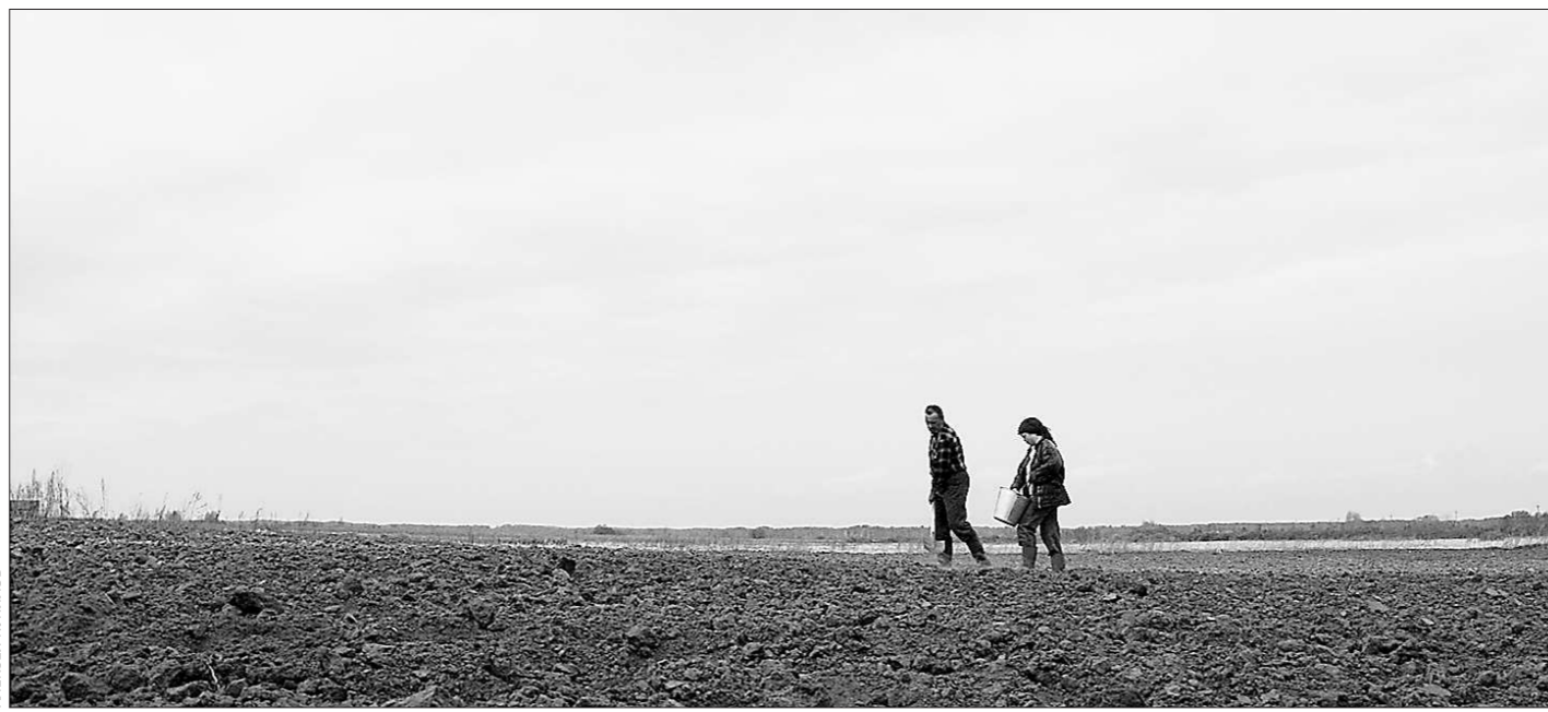
Много ли настоящих хозяев на российских просторах?

Сами потребители, проявляя активность, могут способствовать очищению рынка от недобросовестных поставщиков и торговцев. Огласка, испорченная репутация и наказанная рублём очень быстро дисциплинируют таких нерадивых коммерсантов.