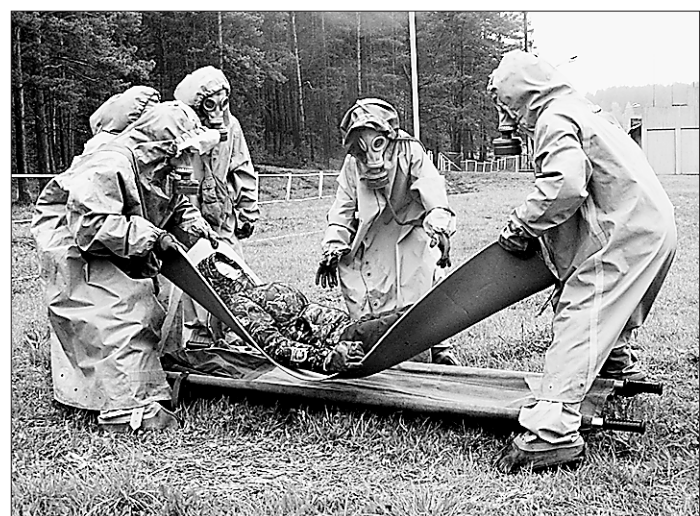
Противогаз надевай и товарища выручай!

В соревнованиях приняли участие 11 команд – победители городских и район-