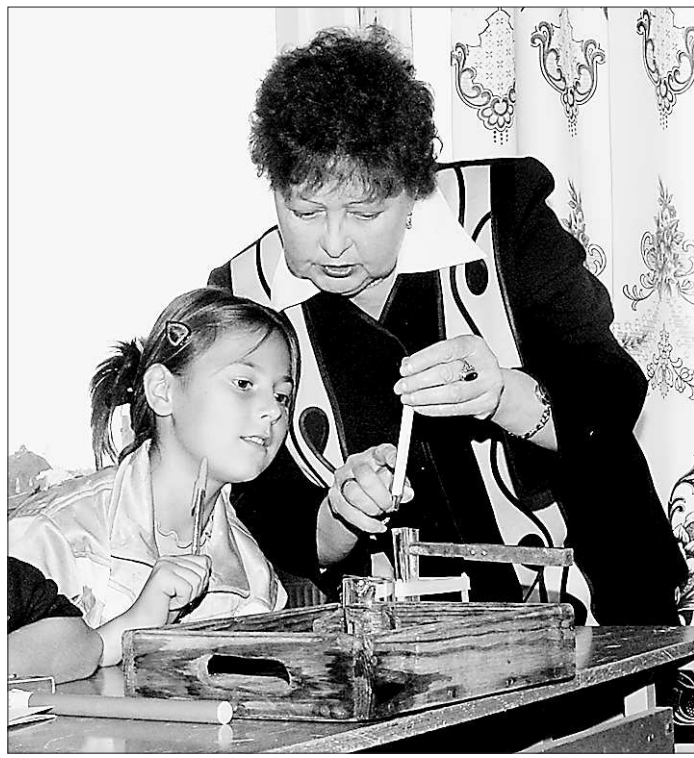
Ученики растут быстрее, чем зарплата педагога...

Выступление премьер-министра обсуждают в эти дни и в Уральском государственном педагогическом универ-