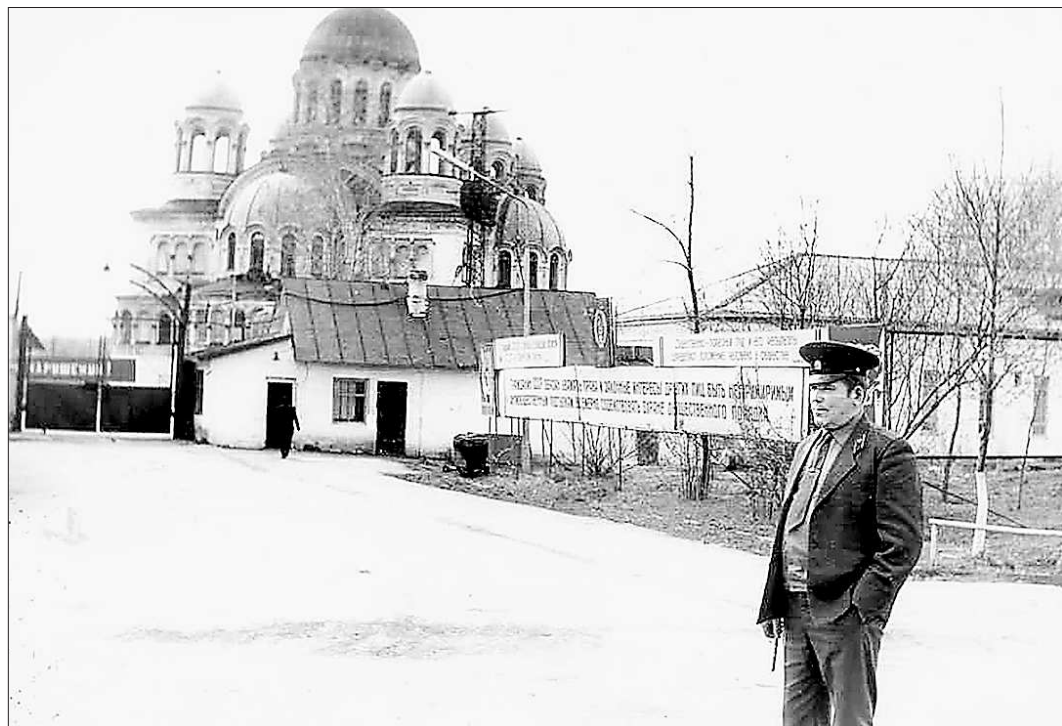
Монастырский пейзаж тех лет

Три века подряд (XVII, XVIII, XIX) два вектора Верхотурья – пенитенциарный и православный – развивались параллельно. В начале 20-х годов XX века монастыри были закрыты, им на смену пришли подразделения Главного управления мест заключения НКВД РСФСР, затем – Главного управления лагерей. ГУЛАГ надолго одержал победу над духовностью. Лишь в 90-е годы минувшего века в Верхотурье возвращается нормальный ход вещей: святых – обществу, ко-