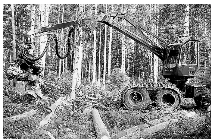
Чем дальше в лес, тем больше дров...

Что характерно, наибольшим скептицизмом по поводу быстрого принятия новой программы высказывают руководители департамента лесного хозяйства. И это при том, что интерес к ней у этого ведомства должен быть особенно высок. Ведь многие жалобы тех же арендаторов поступают как раз в адрес департамента. Нет, его руководители не против программы, но считают, что на её разработку и принятие потребуется минимум полтора года. Лесопромышленники же предлагают запустить её уже нынче, самое позднее — через полгода. Разумеется, если идею одобрит областное правительство и примет программу.