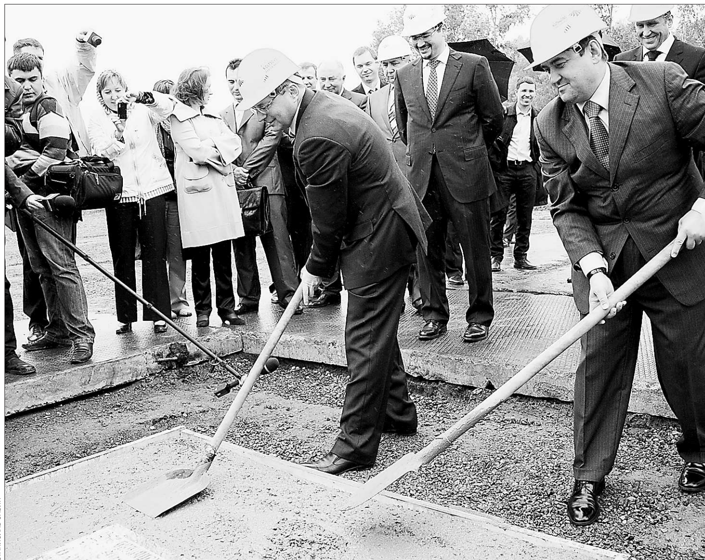
Время закладывать камни (губернатор Александр Мишарин и министр транспорта РФ Игорь Левитин открывают строительство)