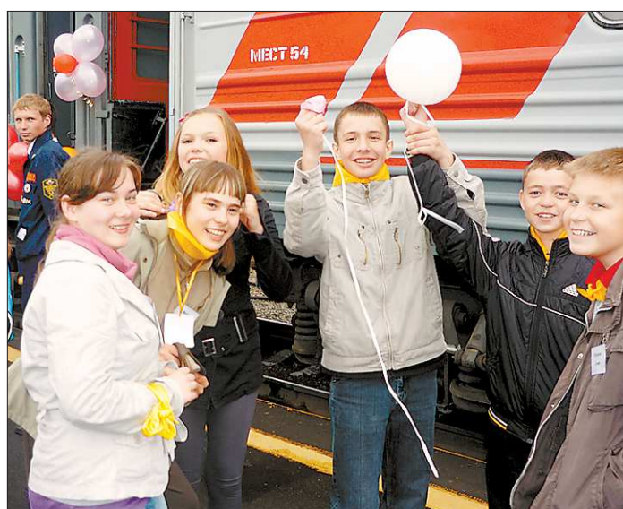
Эти ребята из Верхней Пышмы уже представляют себя на море