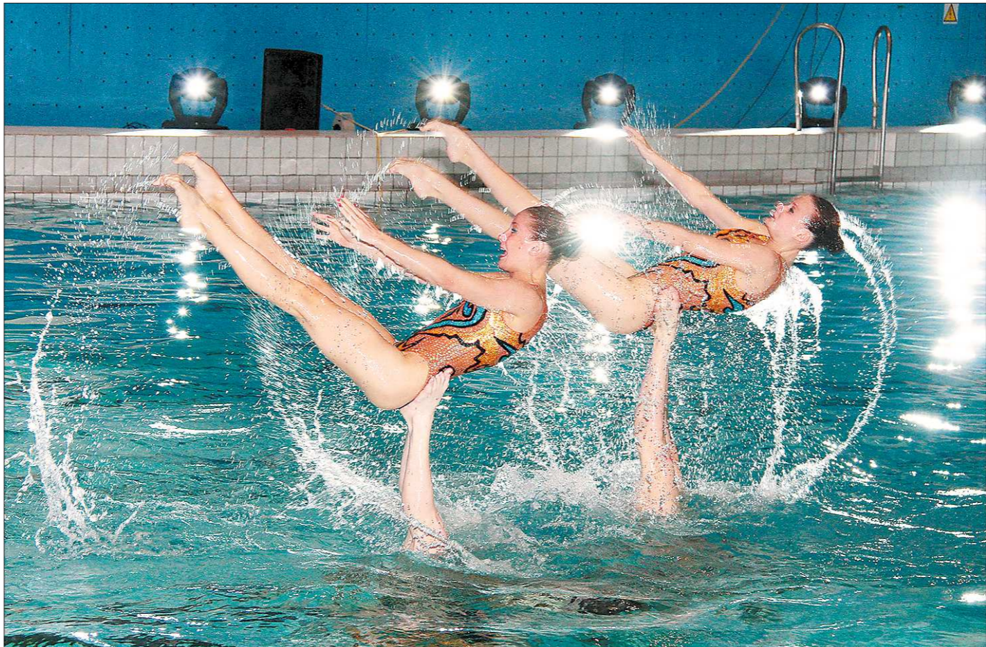
Фигуры высшего пилотажа

4 июня наша команда дома принимает «Енисей» (17:00).