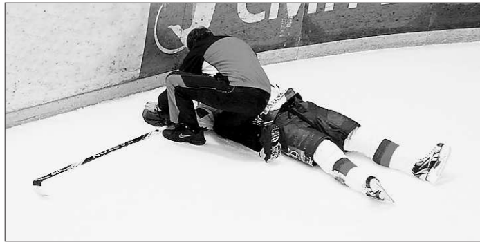
Спорт – опасней любого производства, зато медпомощь тут гарантирована

Впрочем, работы хватит всем. Несколько лет активно и успешно занимаются поддержкой детей-сирот многие общественные организации области.