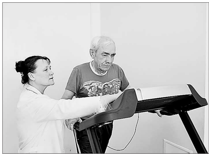
Медики утверждают: будущее — за оздоровительным санаторным отдыхом