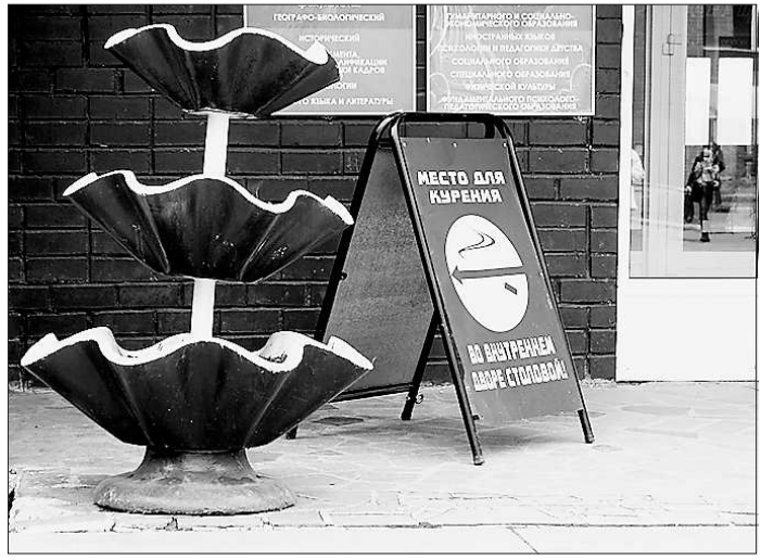
Курьльщикам указали на место