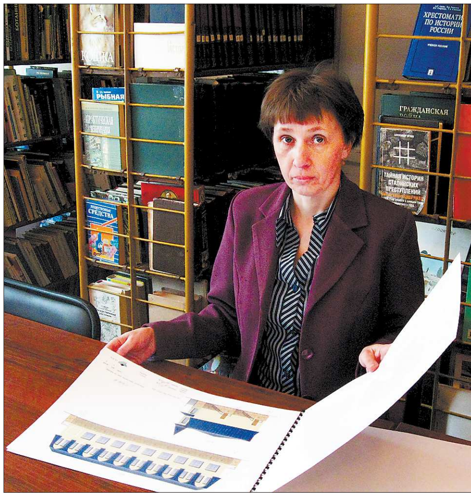
Библиотечарей в Нижних Сергах долго мечтали о новоселье. Сколько придётся ждать ещё?

И всё-таки ложка дёгтя в этой шикарной бочке мёда горчит. Буквально на следующей неделе реконструкция может серьёзно затормозиться. Причина – пандус. Вернее, его отсутствие в проекте реконструкции. Библиотечарей объект социального значения, а значит, должна быть доступна абсолютно всем (в том числе и людям с ограниченными возможностями). В первой редакции проекта реконструкции его авторы (Уральский научно-исследовательский институт архитектуры и строительства) этот момент упустили. Правда, потом в целях удешевления проекта решено было обойтись без пандуса. С чем не согласился муниципальный комитет архитектуры и градостроительства. «Сейчас нижнесергинская библиотека и проектировщики через посредников договариваются о восстановлении проекта в прежнем виде (что, разумеется, потребует дополнительных расходов). Чем дело кончится, станет понятно в ближайшее время. Хотелось бы, чтобы пандус не стал непреодолимым препятствием для читателей, а повод для публикации через несколько месяцев не отдавал горечью».