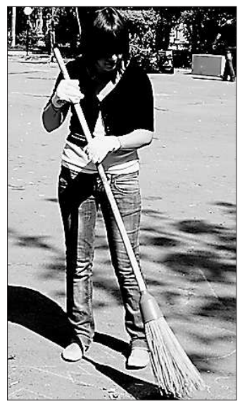
Чисто должно быть не только на улицах, но и в трудовых отношениях