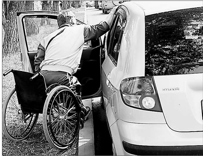
У этих людей за рулём две проблемы: мало спецпарковок и невозможность пользоваться уже созданными. Теперь станет на одну проблему меньше