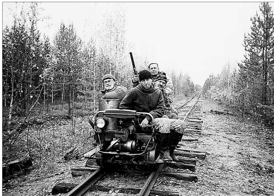
С новым охотничьим билетом можно ехать хоть на край света!

В Свердловской области выдачей новых билетов займется департамент охраны, контролю и регулирова-