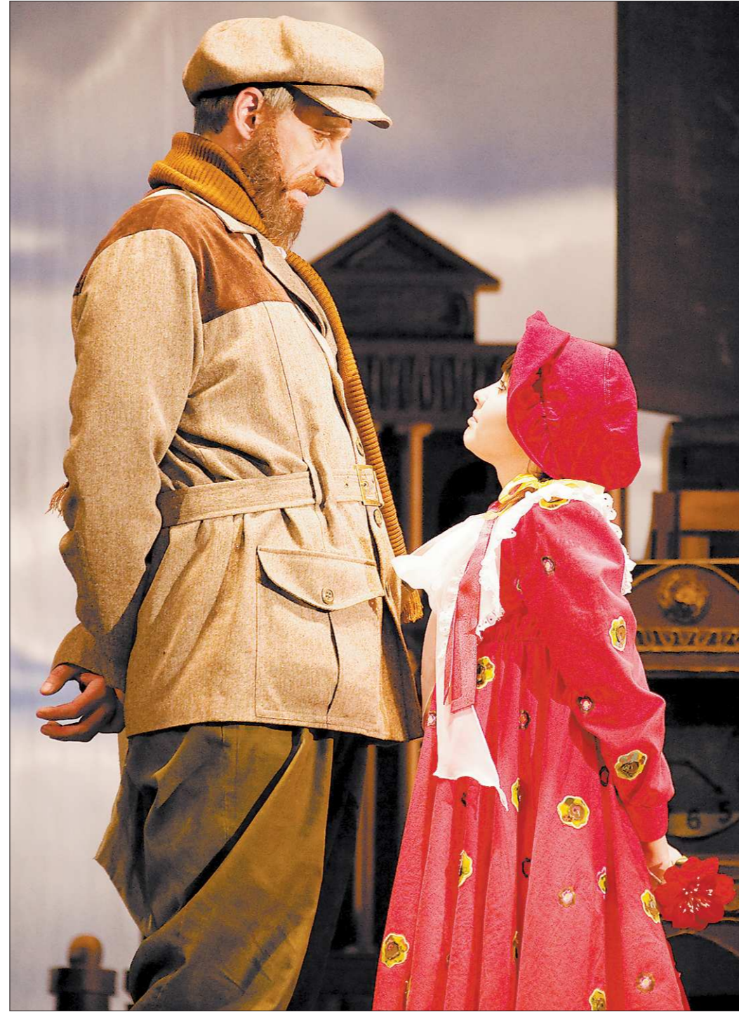
Философия мизантропа Пендлтона или философия радости Поллианны?

– Как ты создавала Поллианну, как работала над ролью?