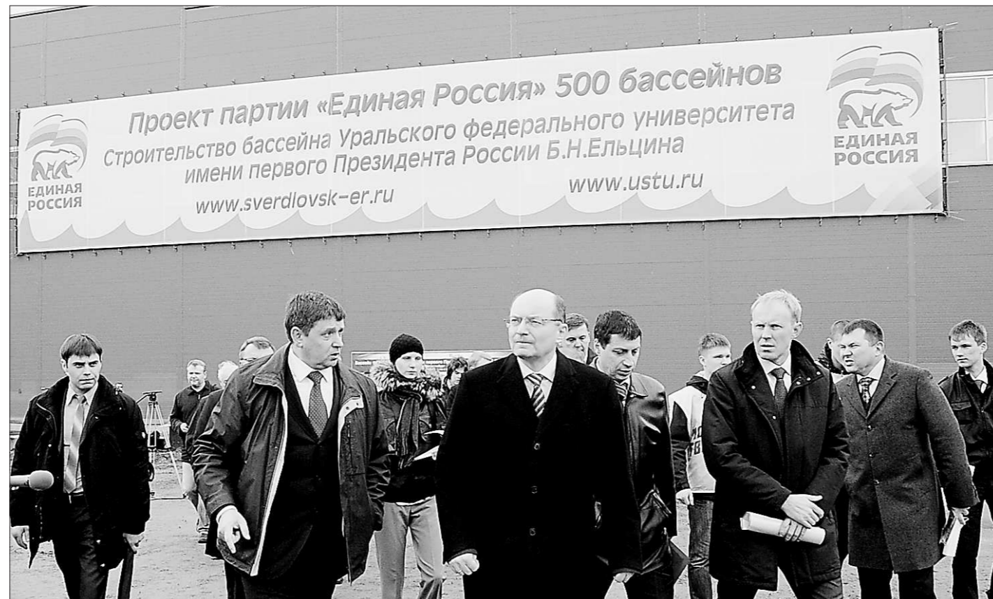
Побывав на строительной площадке бассейна УрФУ, губернатор поставил задачу сдать объект на месяц раньше срока.

Основными задачами плана являются повышение информированности населения о факторах риска, скрининговое обследование целевой группы, формирование группы высокого риска, индивидуальный подход к каждому пациенту и разработка тактики его дальнейшего лечения. Обследование мужчин будет организовано на базе 18 медицинских учреждений, обследовано прошли уже 1700 человек.