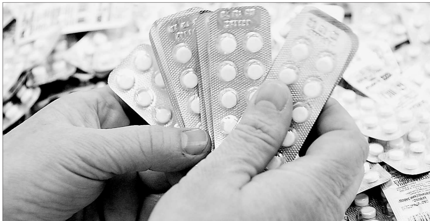
Из этой горсти упаковок только одна имеет российское происхождение.

Во время беседы с журналистами большое внимание он уделил также теме энергосбережения.