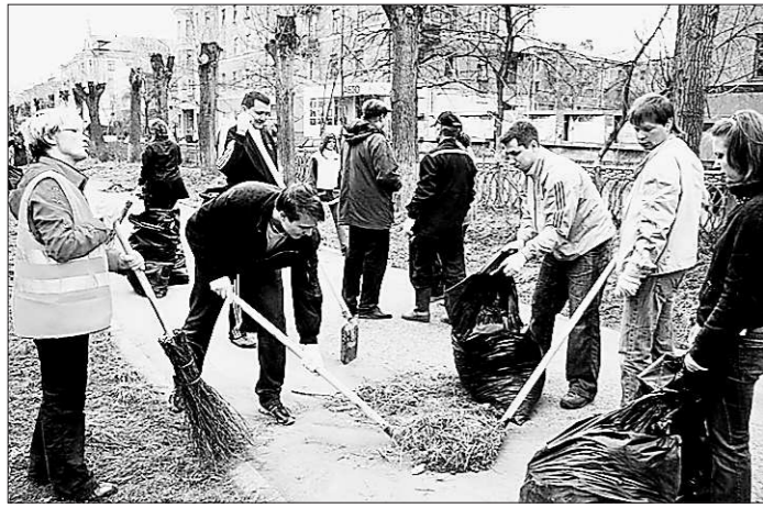
Субботник — дело грязное, но нужное.