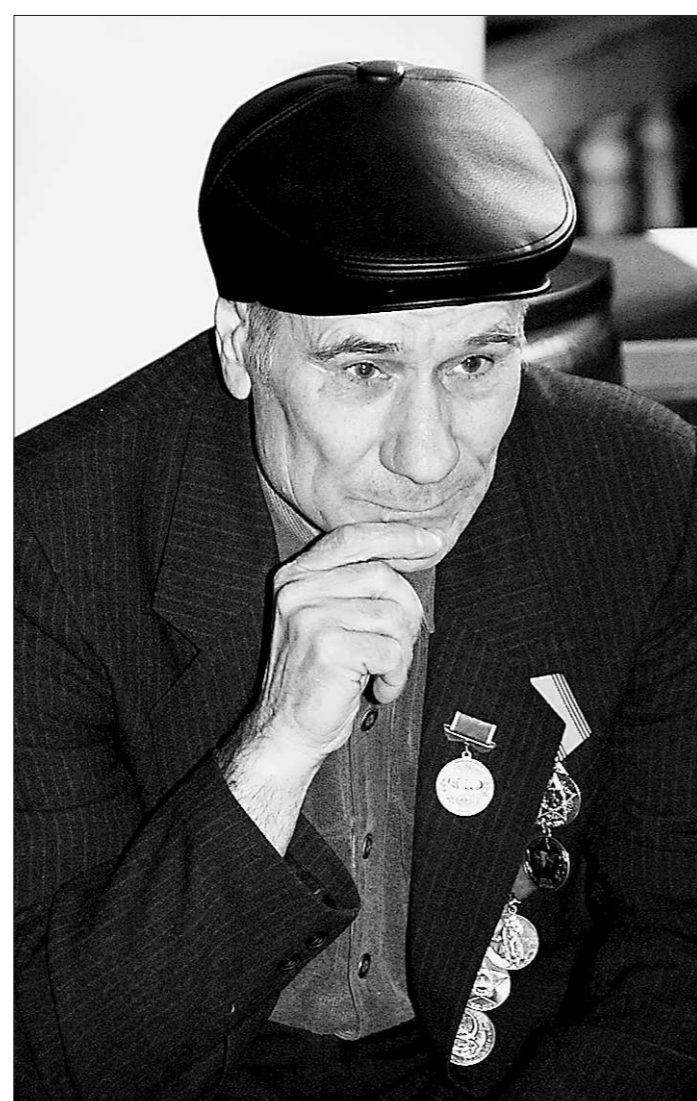
Пережитое остаётся с этими людьми на всю оставшуюся жизнь.

Вчера в Свердловской области почтили память жертв, пострадавших в нацистских и сталинских лагерях