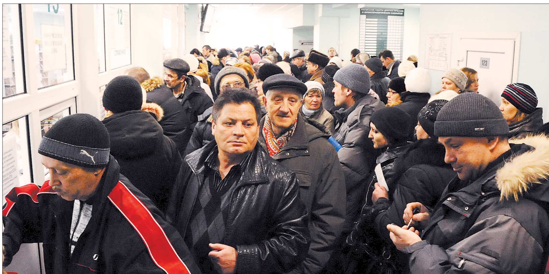
Обычная утренняя давка в поликлинике на Уралмаше.