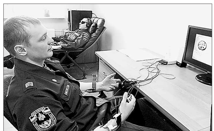
Тестирование уровня самочувствия и психологическая реабилитация сотрудников МЧС в Уральском филиале ЦЭПП.