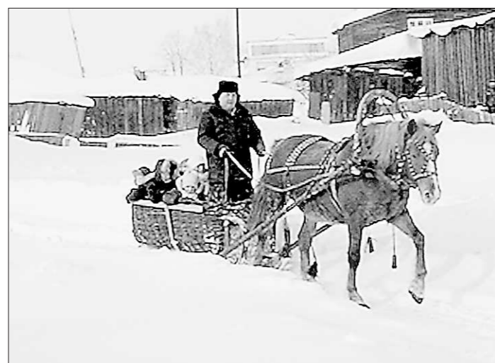
Какой праздник без катания в санях?!..