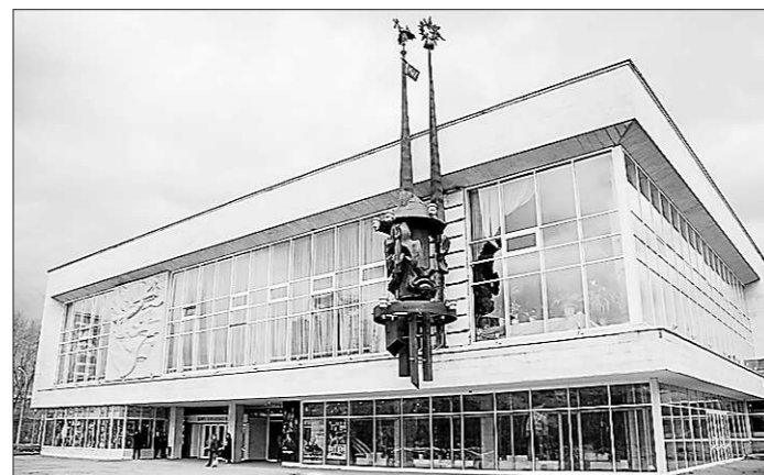
Таким его запомнят тысячи театралов.