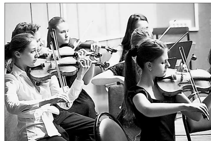
Уникальной школе будут помогать.