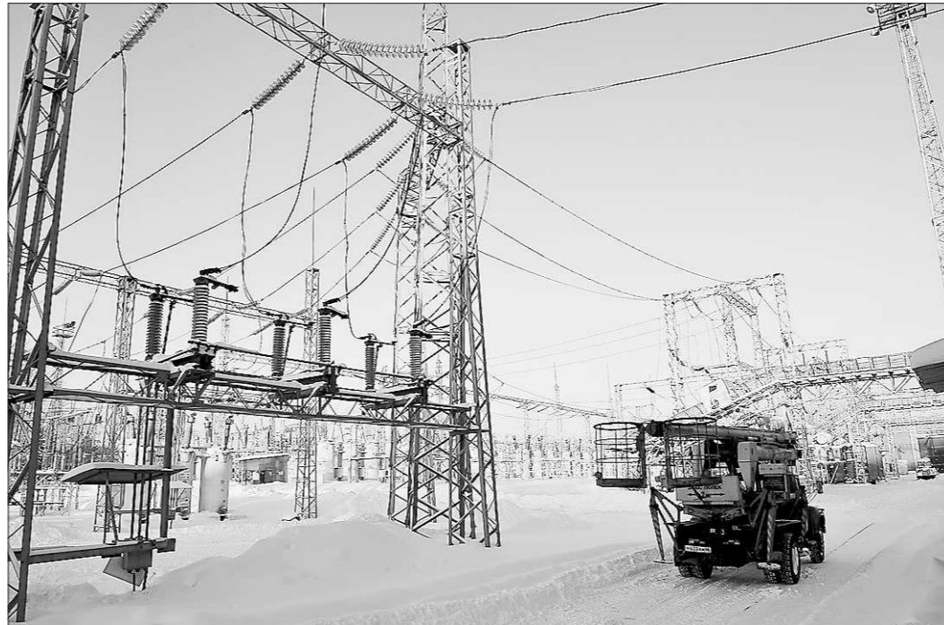
Промышленности не обойтись без энергии, если предприятия будут закрываться?

«За последние годы в этой отрасли накопилось много проблем. На Среднем Урале