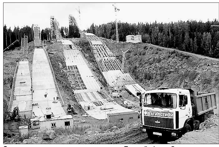
Строительство трамплинов на горе Долгой.