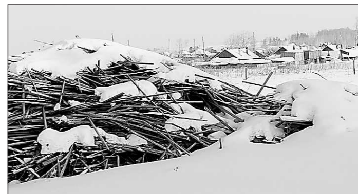
Горы древесных отходов у деревни Кальтоковой Туринского ГО.

Казалось бы, беспокойство по очистке населённых пунктов от отходов производства должны проявлять главы сельских администраций. Но таких тревог они тоже не выражают. – Честно говоря, портить отношения с хозяевами пилорам не очень хочется, – открыто признаётся глава одного из сельских поселений Туринского городского округа. – Они же мои помощники и спонсоры. Часто с просьбами к ним обращаются прихожане. Кроме того, они и работу людям дают. Один из предпринимателей, к примеру, бесплатно обеспечивает дровами пенсионеров. Поэто-