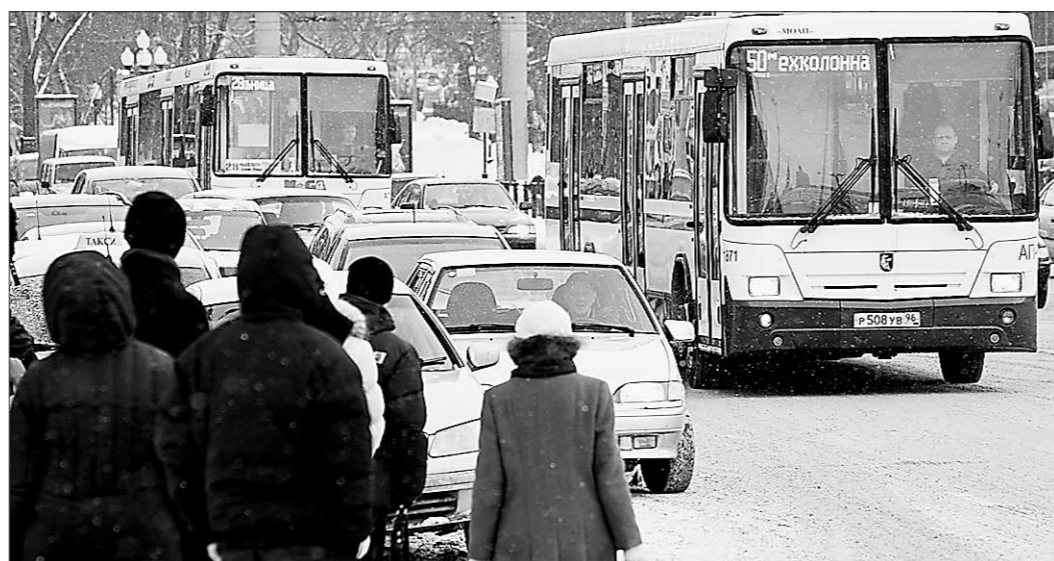
Горожане ожидают нужный транспорт, транспортники ожидают перемен к лучшему.

Перевозчики из Свердловской, Курганской и Челябинской областей, собравшиеся в Каменске-Уральском, констатировали, что наиболее остро перед ними стоят кадровые проблемы, особенно в сфере пассажирского транспорта. Главные причины — тяжёлые условия труда и низкая заработная плата, не соответствующая уровню пси-