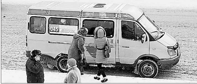
В Каменске-Уральском таких маршруток уже не встретишь.