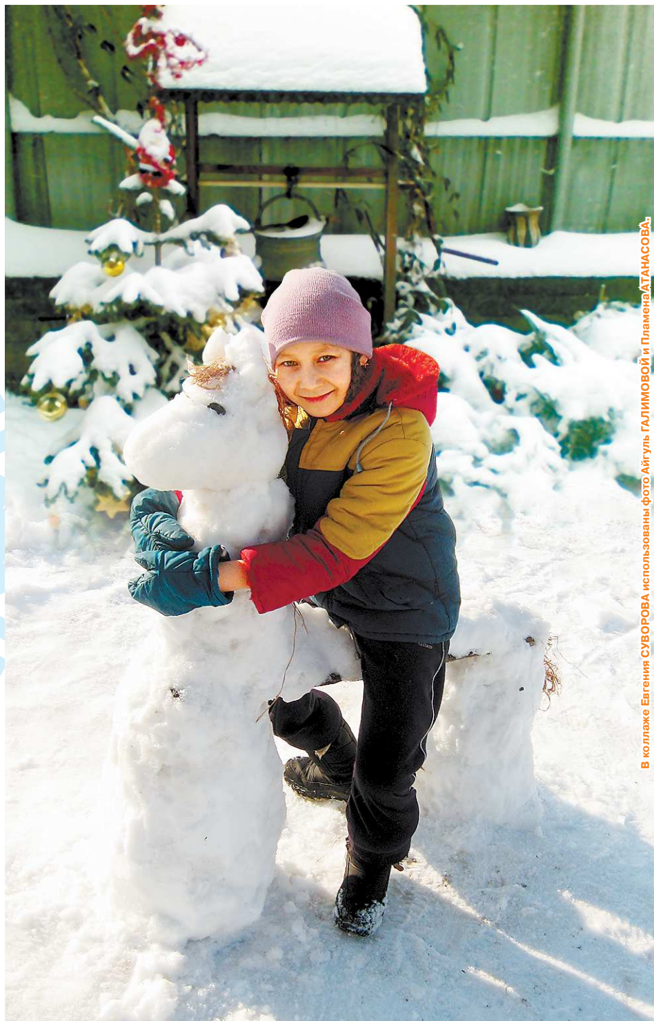
В коллаже Евгения СУВОРОВА использованы фото Айгуль ГАЛИМОВОЙ и Пламена ДАНАСОВА.