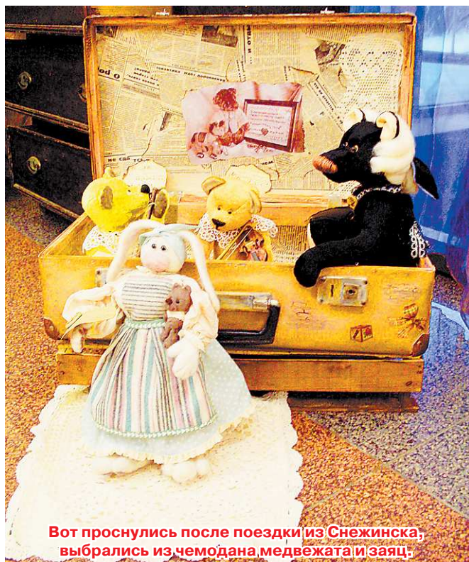
Вот проснулись после поездки из Снежинска, выбрались из чемодана медвежата и заяц.