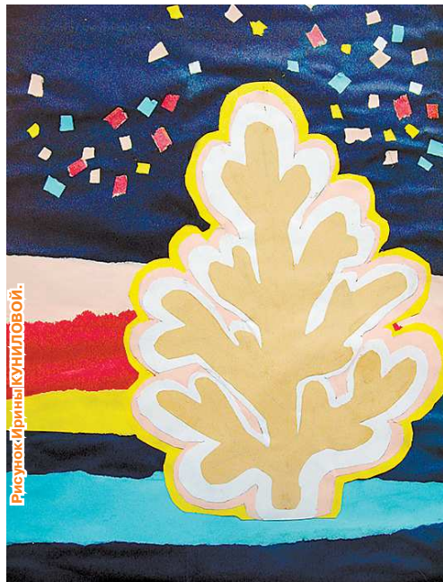
Рисунок Ирины Кучиловой.

–В этот день нас освобождают от нескольких уроков! Мы тепло одеваемся, берём инструменты и минут тридцать идём до рощи. Ёлку ищем самую пышную, метра два высотой, чтобы была до потолка в нашем актовом зале. Потом разжигаем ко-