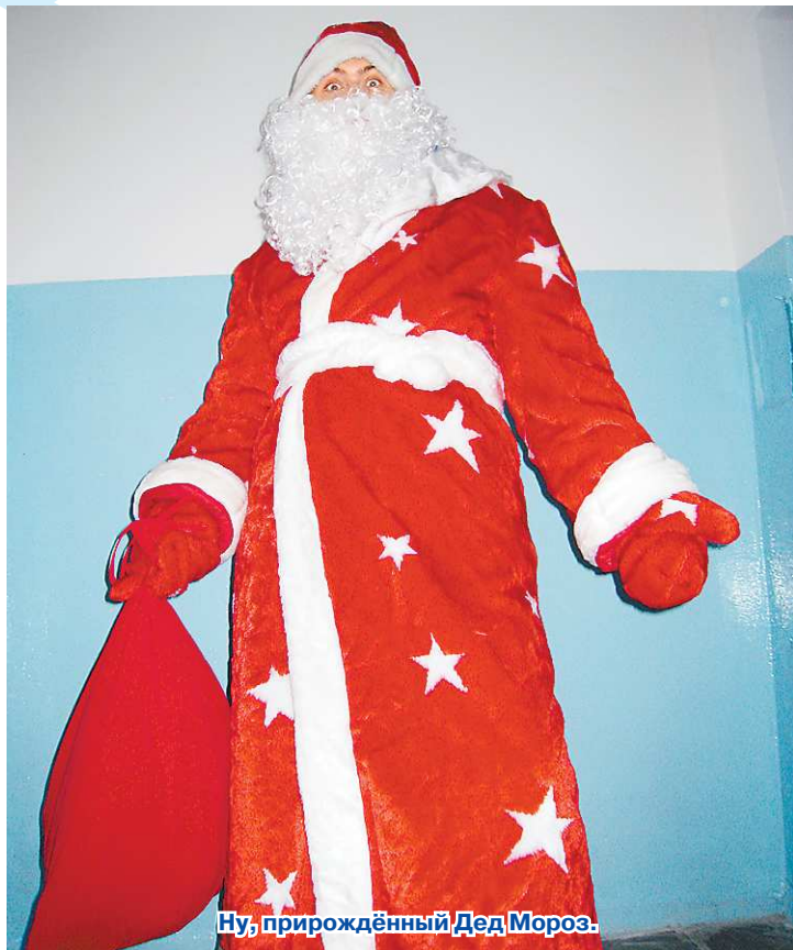
Ну, прирождённый Дед Мороз.

В первую очередь необходимо было понять, насколько же востребованы неопытные артисты, и какой гонорар будет нам причитаться. Для этого мы разместили объявление на самых популярных интернет-порталах Екатеринбурга, отправили резюме и заранее подготовленные фотографии в ряд агентств по организации праздников. Первую неделю наши телефоны молчали, а когда мы уже загрузили, раздался звонок из одного праздничного агентства, куда нас и пригласили на собеседование. Организаторов удовлетворило наше умение общаться и желание работать в новогоднюю декаду за довольно скромные деньги – 1500 рублей на двоих за одну точку. Продолжительность работы на одном заказе – 30-35 минут.