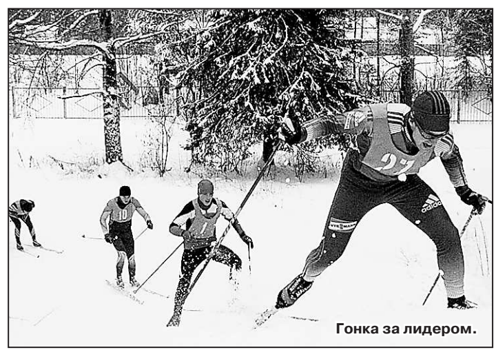
Гонка за лидером.