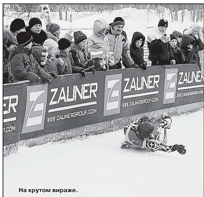
На крутом вираже.