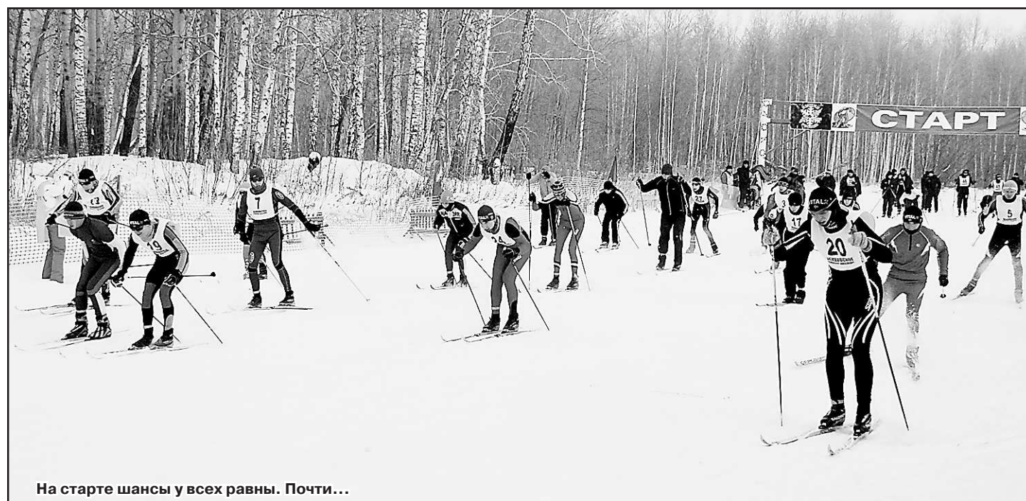
На старте шансы у всех равны. Почти...

В торжественном параде участвовало 407 гонщиков. Это рекорд камышловских стартов: в прошлом году было 374 участника. А на первых стартах на призы «ОГ» в Октябрьском в 2004 году было всего 75 гонщиков. Одно только сравнение этих цифр красноречиво говорит о видимом прогрессе в пропаганде лыжных гонок. А если сказать, что в Октябрьский нынче приехали и поклонники лыжных гонок из других городов (Ирбита и Байкалово, Богдановича и Талицы, Сухого Лога и Тугулыма, Заречного и Артёмовского), то станет понятно, что большинство муницип