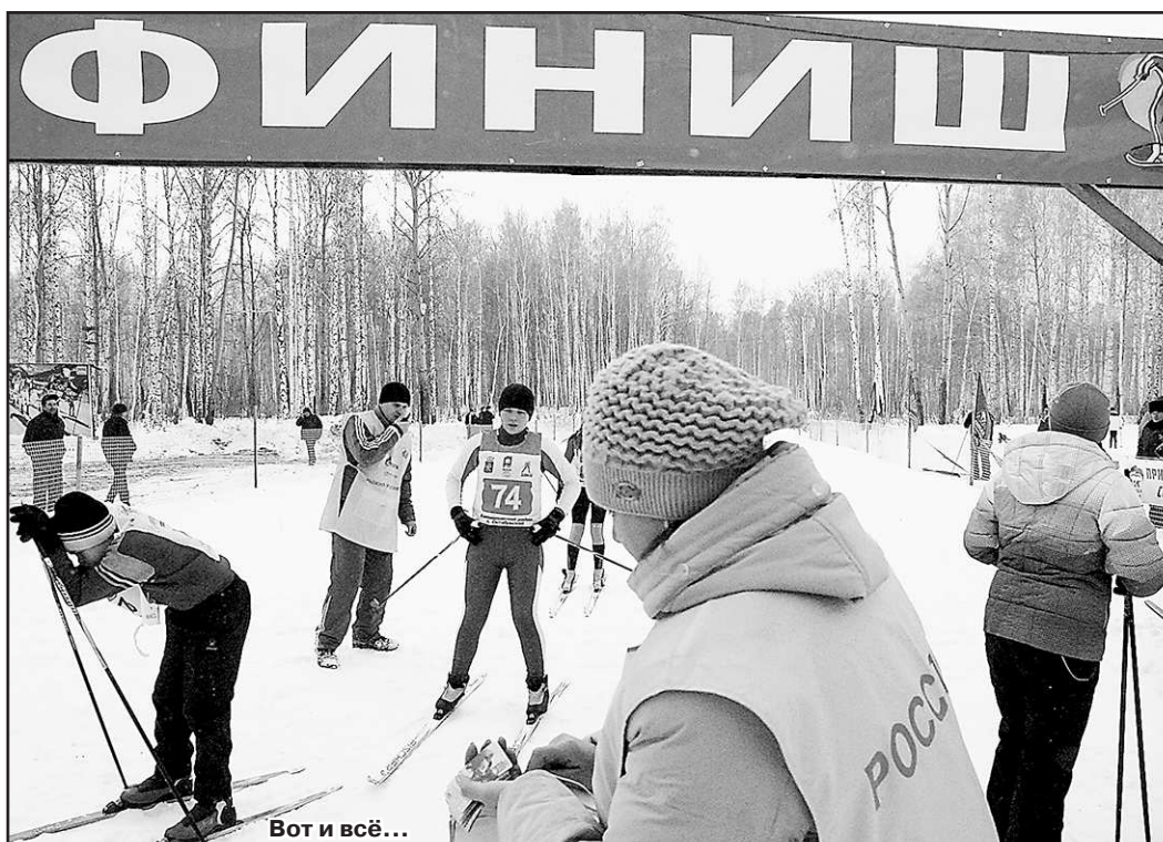
Вот и всё...