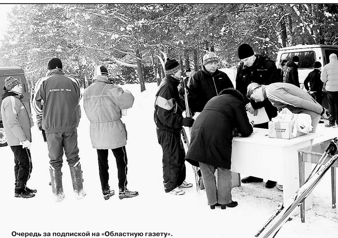
Очередь за подпиской на «Областную газету».