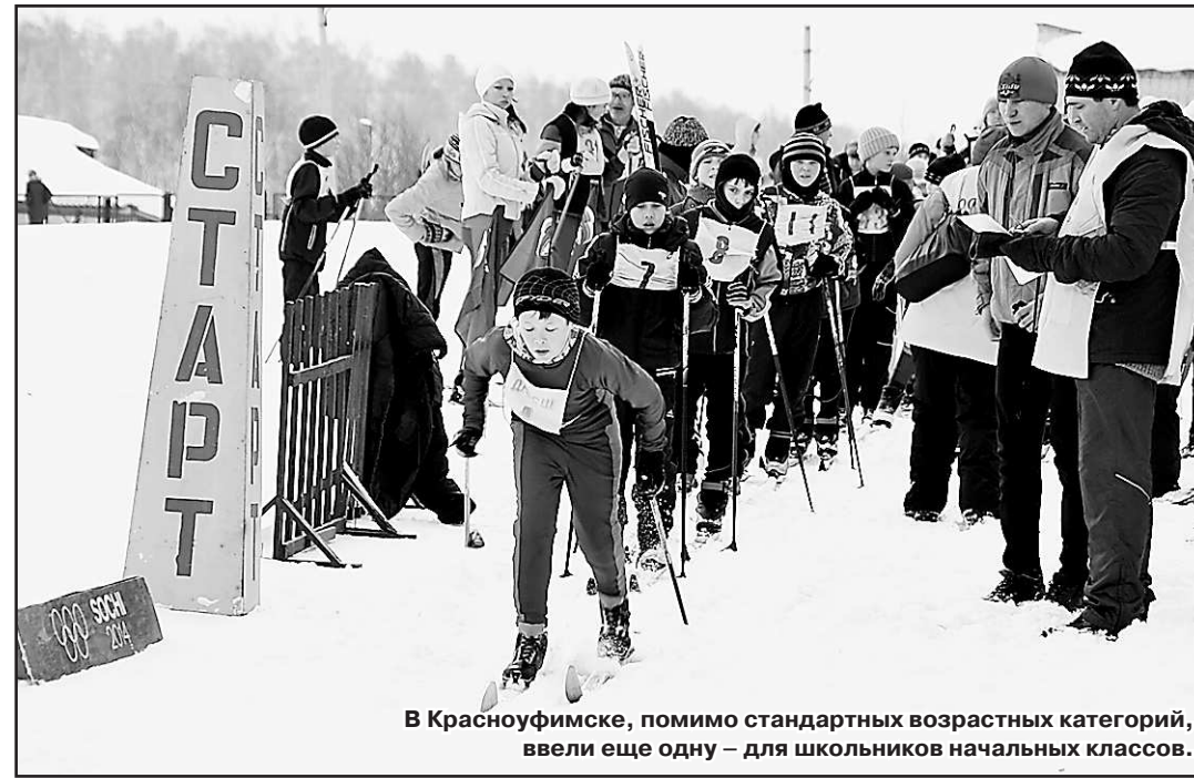
В Красноуфимске, помимо стандартных возрастных категорий, ввели ещё одну – для школьников начальных классов.

Хорошо, если бы она была круглогодичной. Летом – тренировки и старты на лыжероллерной трассе, зимой – лыжные гонки. Нужна и гостиница, чтобы лыжная база стала для свердловчан и местом отдыха. Большим бы достижением стало создание на базе ДЮСШ филиала Екатеринбургского училища олимпийского резерва № 1. Надеюсь, что когда-нибудь наши мечты станут