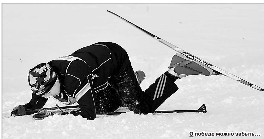
О победе можно забыть...