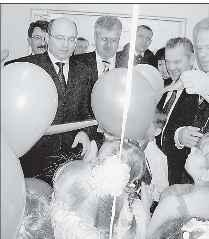
(Окончание. Начало на 1-й стр.).

Реализация проекта отвечает задачам федеральной целевой программы «Развитие гражданской авиационной техники России на период до 2015 года» и Стратегии развития металлургической промышленности России на период до 2020 года.