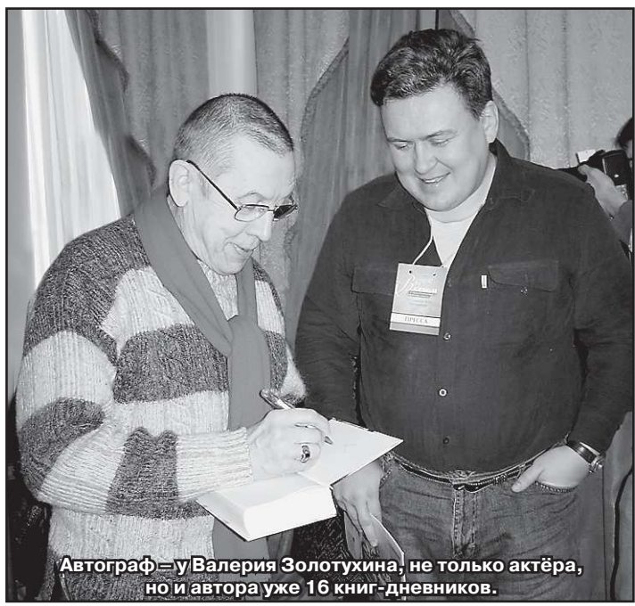
Автограф – у Валерия Золотухина, не только актёра, но и автора уже 16 книг-дневников.

Антрепризный спектакль «Все мои сыновья» предвратит кинофестиваль, а уже с 7 декабря на площадках ведущих кинотеатров Екатеринбурга начнётся кинопрограмма, в которой около 60 художественных, короткометражных, документальных и анимационных фильмов на тему семьи и детства. Фильмы – из 20 стран мира: России, Франции, Новой Зеландии, Германии, Италии, США, Китая и других.