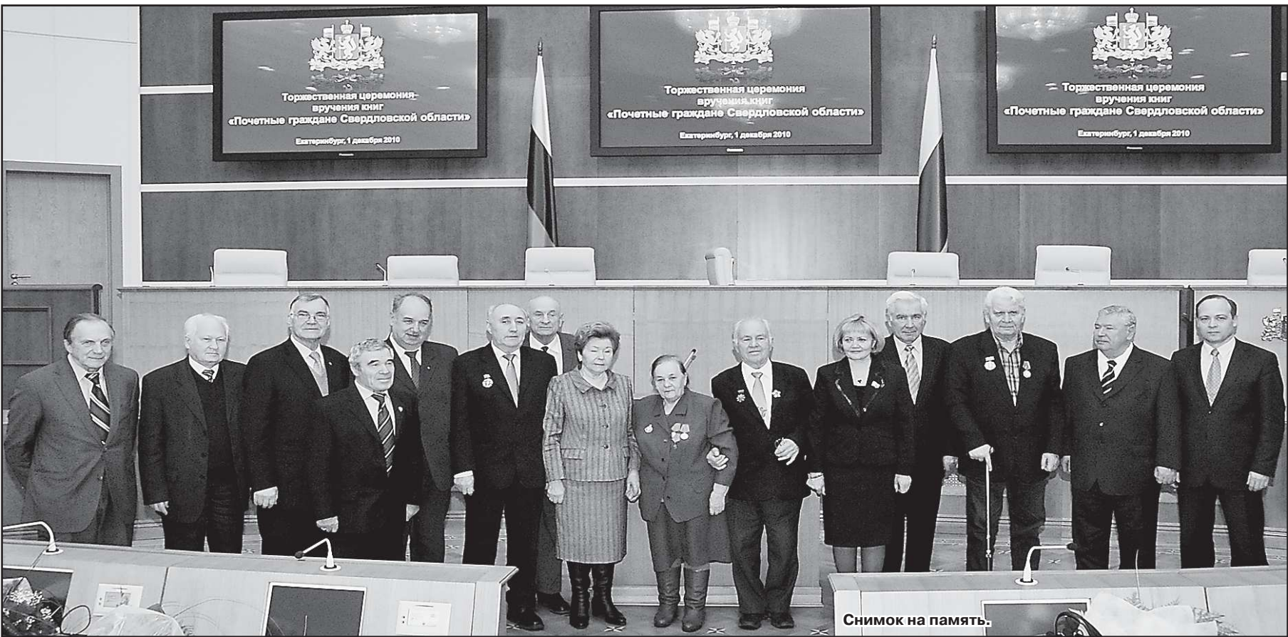
Снимок на память.

Никогда ещё в одном зале я не видел столько известных на Среднем Урале людей. Учёные, политики, конструкторы, промышленники, представители искусства. Но всех их объединяло одно. Они удостоены звания «Почётный гражданин Свердловской области». В Законодательном Собрании они собрались по приглашению депутатов. А поводом стало вручение Почётным гражданам посвящённой им книги, недавно вышедшей в издательстве «ПАКРУС». Разумеется, на встречу со своими героями пришли и авторы роскошного издания.