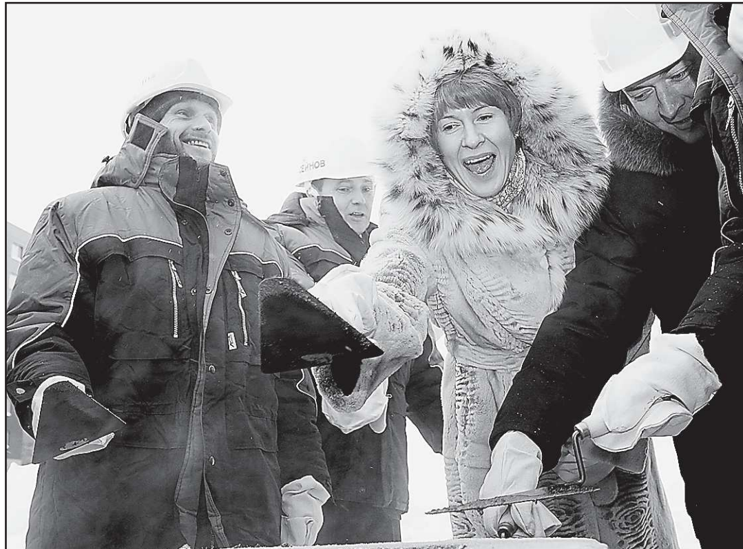
Как уже сообщала «ОГ», во вторник на улице Коминтерна, рядом с манежем УрФУ состоялась торжественная церемония закладки первого кирпича на месте строительства первого в Екатеринбурге студенческого бассейна.

ректора университета дальше это развивать, что можно только приветствовать. Нужна система соревнований среди студентов, квалифицированные тренеры и, прежде всего, желание самих студентов заниматься спортом. Если всё это будет, мы сможем интегрироваться в мировую студенческую спортивную среду.