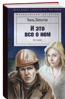
«И ЭТО ВСЁ О НЁМ» Виль Липатов

В основу романа положена история о подпольной молодёжной организации, которая действовала в Краснодаре во время Великой Отечественной войны. Олег Кошевой, Любовь Шевцова, Ульяна Громова, Сергей Тюленин, Иван Земнухов – все эти герои были списаны Фадеевым с реальных людей. Это, пожалуй, самое известное произведение из нашего списка, но тем не менее мы думаем, что читали его немногие из вас.