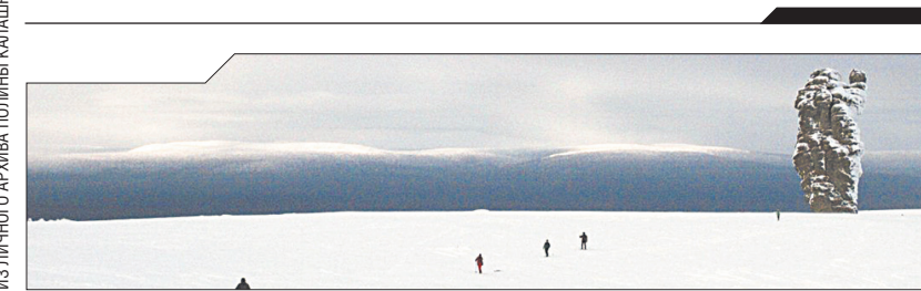
Плато Маньпупунёр ещё называют Столбами выветривания

■ А первое место отдаю прекрасному Атлантическому океану. Я бы предпочла на него смотреть с высокой «Башии Геркулеса», которая находится в городе Лакоруния на севере Испании.