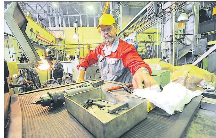
Бережливые технологии также предполагают внедрение новой организации рабочего места сотрудников предприятий

Сейчас мы сосредоточились на крупных обрабатывающих предприятиях. В нашем регионе около 400 крупных предприятий, которые подходят под критерии участника проекта, в том числе, имеющих выручку от 400 миллионов до 30 миллиардов рублей в год. В список потенциальных участников национального проекта вошли на сегодняшний день 308 организаций. Это компании из отраслей сельского хозяйства, транспорта, строительства, обрабатывающего производства и жилищно-коммунального хозяйства. Практически половину из списка составляет промышленный сектор.