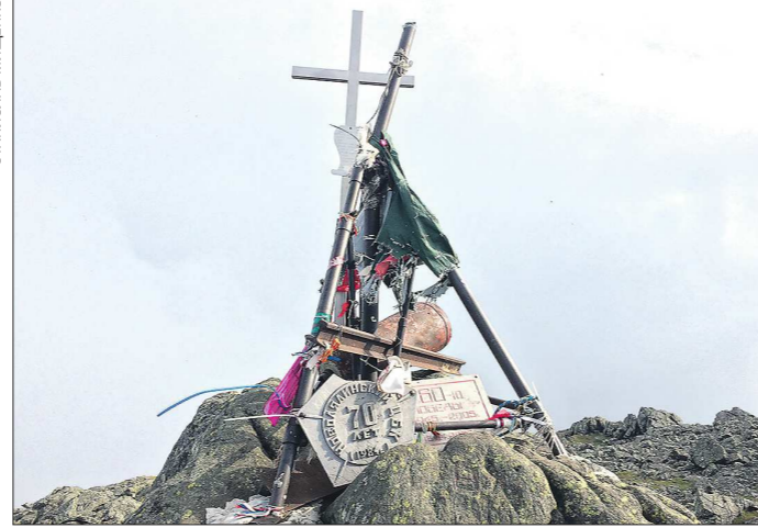
На вершине Конжака туристы оставляют разные вещи в память о восхождении на гору. Здесь лежат металлические таблички, старый огнетушитель и другие предметы

Несмотря на большой туристский поток, проблем с экологией в этих местах нет. Рекреационная нагрузка на Конжаке в разы ниже, чем на популярных уральских курортах, например, горе Белой под Нижним Тагилом. Дунитовый карьер тоже не влияет на состояние окружающей среды: добыча этого минерала не представляет опасности для природы, в отличие от медных или