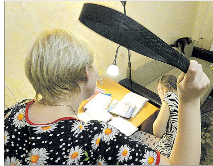
По данным Следственного комитета РФ по Свердловской области, в регионе за год регистрируется примерно 80 случаев жестокого обращения с детьми, когда против агрессоров заводят уголовные дела

По мнению участников общественных слушаний, это административное наказание следовало бы ужесточить. Речь не идёт об увеличении суммы штрафа, но срок заключения стоит увеличить с 15 суток до 30, точно так же в два раза увеличить и продолжительность обществен-