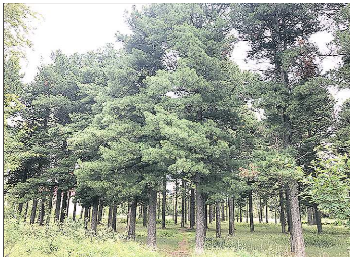
Этой кедровой роще на окраине Карпинска более 200 лет