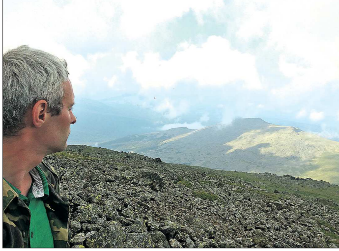
С Конжаковского Камня открывается вид на гряды Уральских гор, тянущуюся далеко на север до Карского моря

Хотя по сравнению с Южным Уралом здесь их немного. Даёт о себе знать удалённость от Екатеринбурга: до Конжака от него 475 километров. Но живописные ландшафты, чистый горный воздух и душистые альпийские луга всё равно притягива-