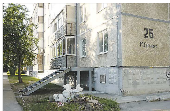
Жильцы дома на Горького, 26 забили тревогу, когда к одному из окон на первом этаже построили лестницу. Здесь должен был быть вход в магазин

В начале июня в России вступили в силу поправки в Жилищный кодекс, ужесточающие правила перевода жилых помещений в нежилые в многоквартирных домах. Нововведения призваны защитить интересы и комфорт жильцов, которые нередко страдают от неудачного соседства с офисом или магазином. Поэтому предпринимателям проще открывать точки в торговых центрах: жильцам теперь намного легче отказаться пускать бизнес в жилой дом. Прецеденты уже есть.