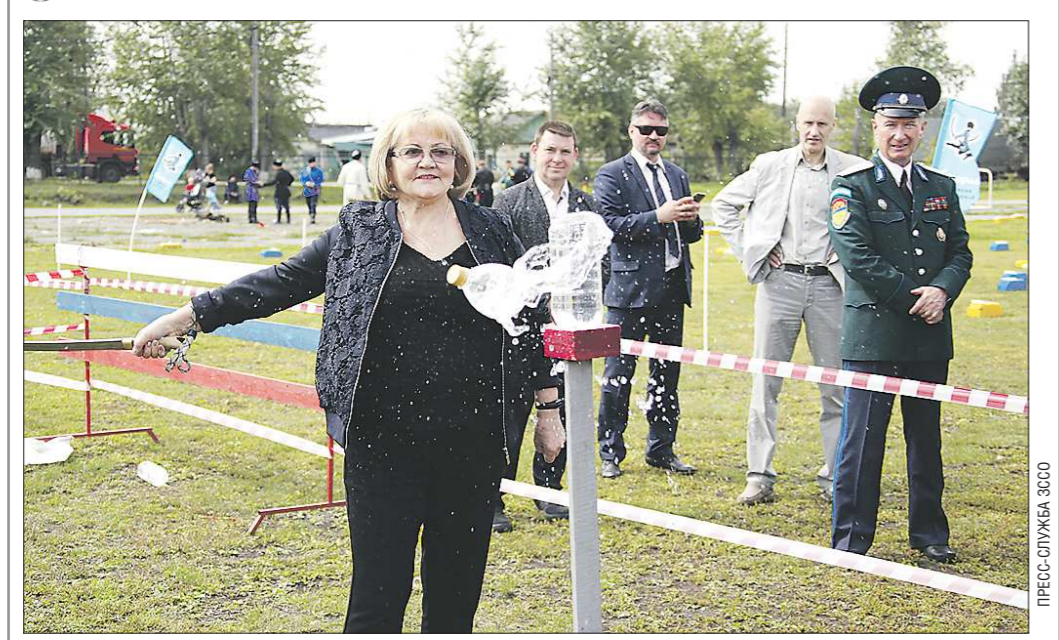
В минувшие выходные в Богдановиче прошёл IV Всероссийский чемпионат по рубке шаашкой «Казарла», который собрал более 200 казаков. Это гости из Омской, Курганской, Новосибирской, Пензенской, Волгоградской, Смоленской, Ульяновской, Челябинской, Ярославской, Иркутской и Свердловской областей, Краснодарского, Пермского и Ставропольского краёв, Башкирии, Ханты-Мансийского автономного округа, Москвы и Московской области. Гостей поприветствовала председатель свердловского Заксоборания Людмила Бабушкина, которая тоже попробовала себя в традиционном казачьем виде спорта