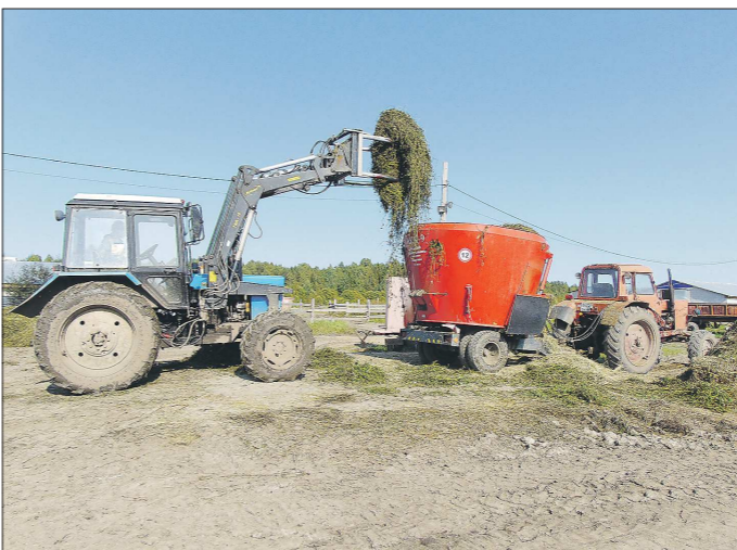
Денги в рамках «Агростартапа» выдаются на условиях софинансирования, где 10 процентов – это собственные средства получателя. Предпочтение – бизнес-планам по приоритетным направлениям развития сельского хозяйства в регионе