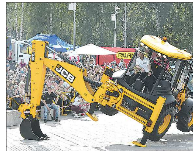
Многотонные гиганты исполнили коронные подьёмы на ковше на высоту больше двух метров, а также танцевали вальс и танго

У центрального входа в парк гостей встречала строительная техника – гусеничные и колёсные экскаваторы, погрузчики, грейдер, автокраны, генераторы, а также оркестр «Уралбэнд» под управлением Александра Павлова. На центральной аллее проходили строительные мастер-классы, в которых участвовали не только дети, но и взрослые. В фан-зоне проходило шоу танцующей техники. Там же состоялось состязание «Золотой ковш» и конкурс крановщиков. После участия в развлекательных мероприятиях гости парка с удовольствием угощались солдатской кашей.