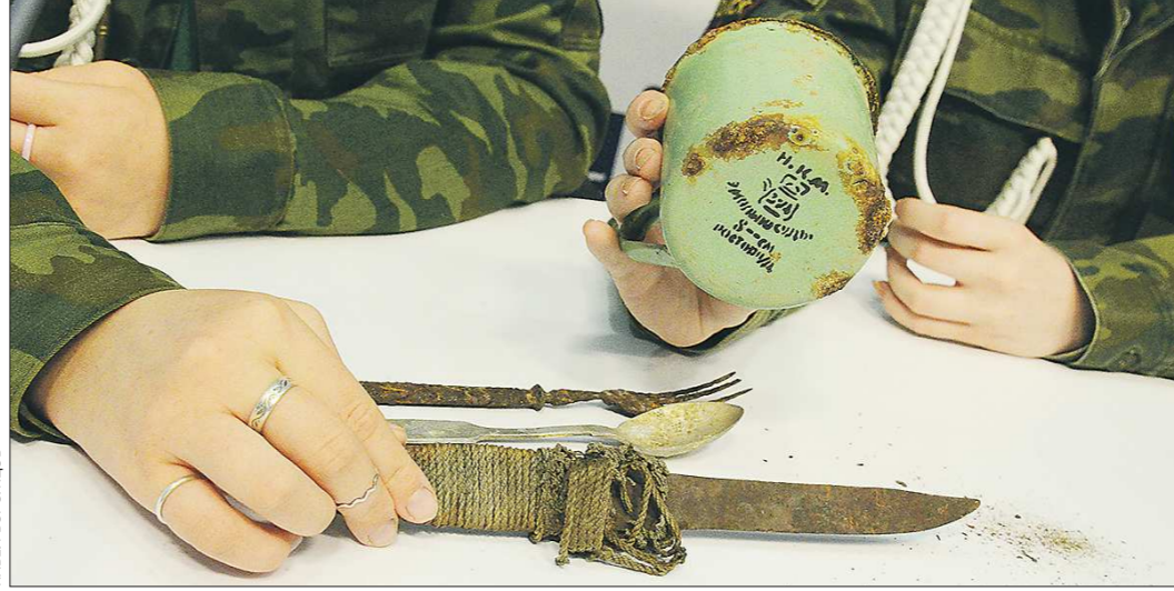
Из найденных поисковиками солдатских вещей особенно хорошо сохранилась эмалированная кружка. Даже можно прочитать, где она изготовлена — в Ростове-на-Дону

Часть поисковых отрядов уже вернулась из экспедиции. Например — юнармейский отряд «Поиск» школы №2 горо-