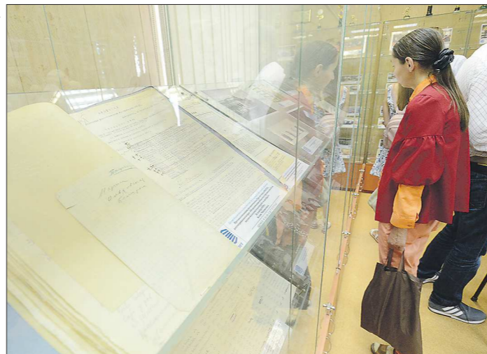
Людям интересны такие архивные выставки, так как экспонаты на них нередко выставляются впервые