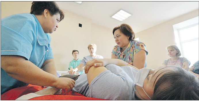
По данным Минздрава РФ, общее число волонтеров-медиков в стране уже превышает 24 000 человек. Среди них люди разного возраста