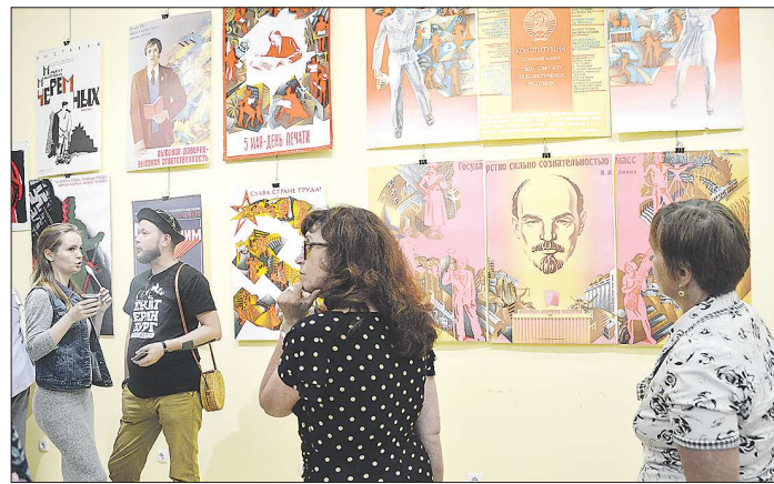
Агитационный плакат был самым распространённым советским визуальным жанром. С ним были хорошо знакомы даже те, кто ни разу в жизни не был на выставках художников