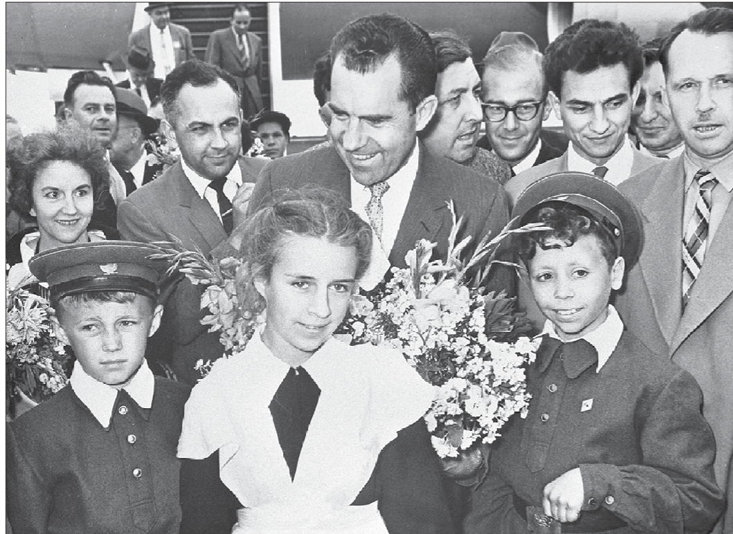
Ричарда Никсона в аэропорту Свердловска встречало много людей. Фотокорреспонденты сделали традиционное «фото с пионерами»

60 лет назад, 29 июля 1959 года, в Свердловске приземлился самолёт, на котором прибыл вице-президент США Ричард Никсон. Будущий 37-й президент Соединённых Штатов провёл в городе три неполных дня, посетив ещё Первоуральск, строительство Белоярской АЭС, а также Дегтярск, где спустился в шахту. Последнее обстоятельство породило огромный миф: Никсон поехал в Дегтярск не потому, что бывал там в детстве, то ли потому, что там когда-то работали его родители, то ли его предки владели акциями компании «Lena Goldfields», которая в конце 20-х управляла Дегтярскими рудниками. К годовщине приезда Ричарда Никсона на Урал «Областная газета» изучила несколько десятков источников, чтобы разобраться, где всё-таки правда, а где вымысел.