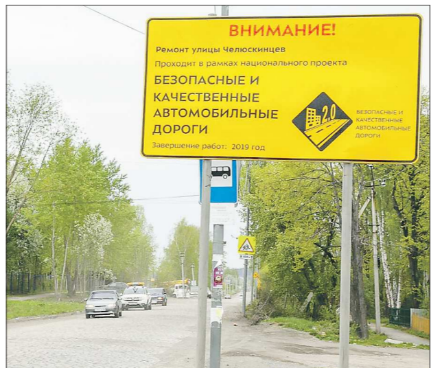
Такие картины на дорогах сейчас можно увидеть по всему Нижнему Тагилу. Первые дорожные объекты сдадут ко Дню города, остальные – в сентябре

улучшения дорожной сети Нижнего Тагила выиграют и тагильчане, и жители границащих с ним городских округов.